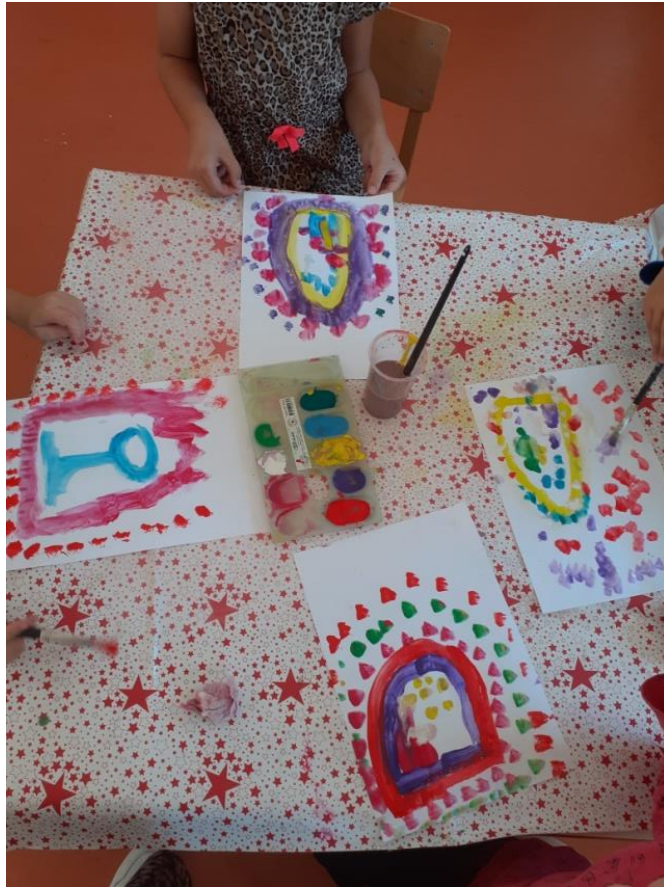
Slika br. 14: Djeca prilikom izvođenja likovne aktivnosti