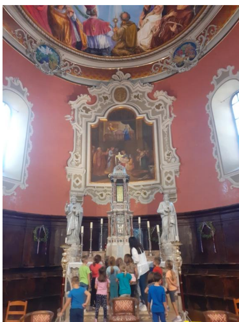
Slika br. 7: Voditeljica zbirke sa skupinom djece ispred glavnog oltara unutar crkve Porođenja Blažene Djevice Marije u Skradinu