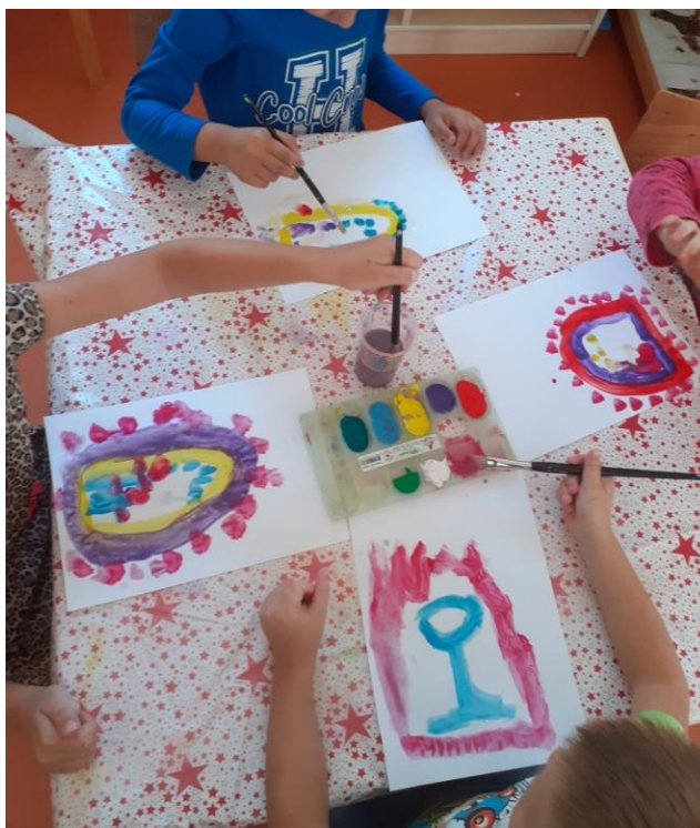
Slika br. 12: Djeca prilikom izvođenja likovne aktivnosti