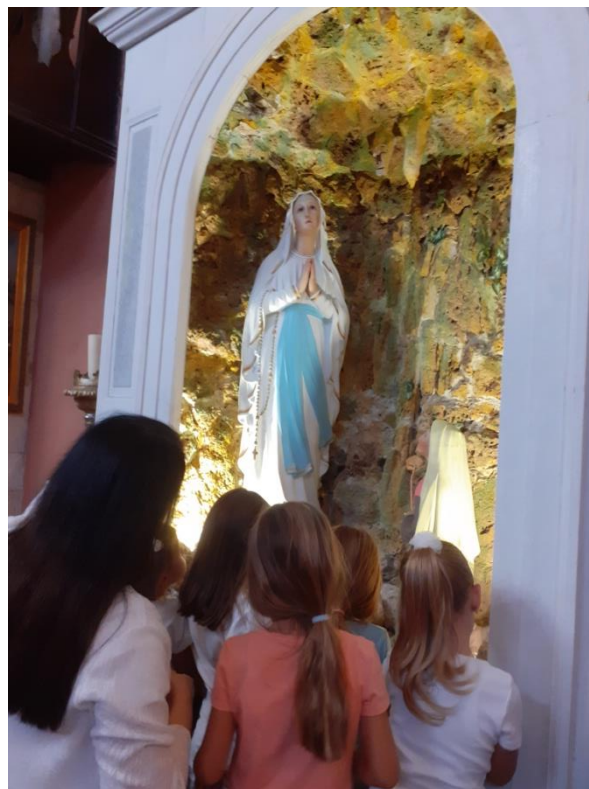
Slika br. 11: Razgledavanje unutrašnjosti crkve Porođenja Blažene Djevice Marije