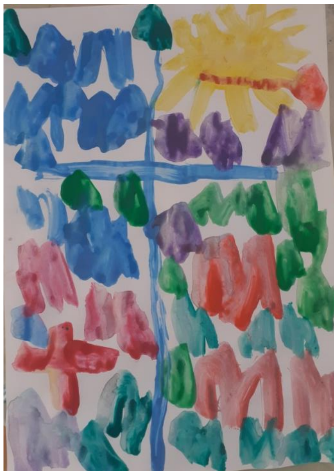
Slika br. 19: Primjer rada djevojčice (5 godina)

Prema izjavi djeteta možemo zaključiti da je dijete na papiru pokušalo prikazati kip i cvijeće na vlastiti i vrlo zanimljiv način.