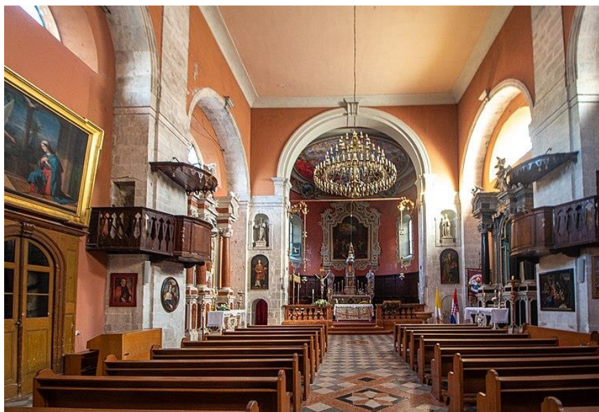
Slika br. 4: Unutrašnjost crkve Porodenja Blažene Djevice Marije u Skradinu

Prekrasni inventar kojeg crkva zajedno s župno-opatskim dvorom ima su razne slike, skulpture, liturgijski predmeti i liturgijsko ruho, a najvrjedniji su oltarna pala, Bogorodica s Djetetom i sv. Ivanom, kaleži, procesijski križevi i dvije slike koje prikazuju scene Navještenja i Getsemana, a koje je naslikao talijanski slikar Antoonio Zuccaro krajem 19. stoljeća (Juric, Šišak, 2022).