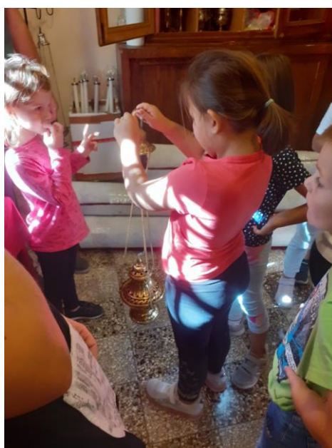
Slika br. 9: Razgledavanje liturgijskih predmeta u sakristiji