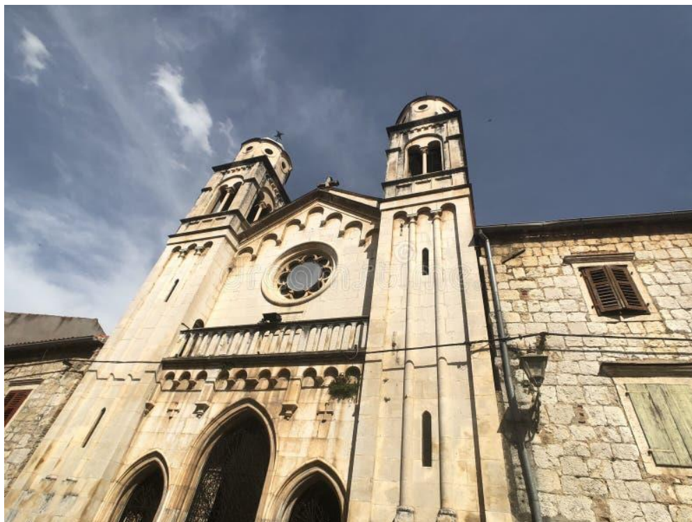
Slika br. 5: Crkva sv. Spiridona u Skradinu