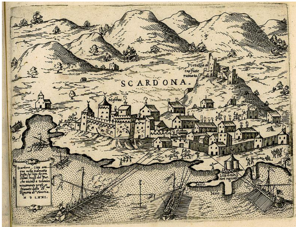
Slika br. 1: Skradin u XVI. Stoljeću