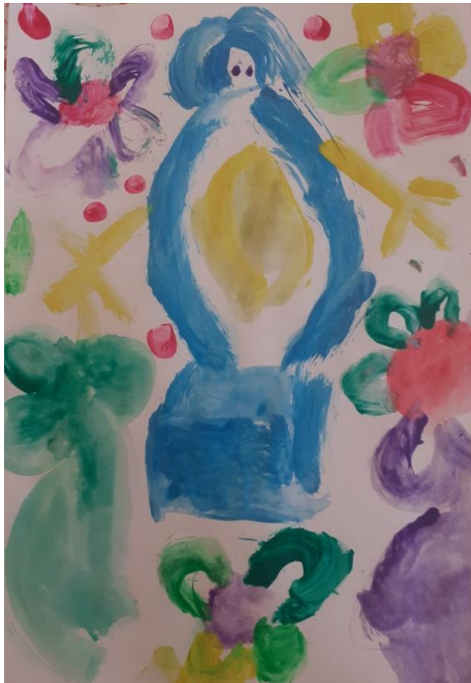
Slika br. 17: Primjer rada djevojčice (5 godina)

Djetetu se prema njegovoj izjavi, najviše svidjela liturgijska odjeća koju nam je prezentirala voditeljica zbirke, ali se u likovnoj aktivnosti ipak usmjerilo na motiv križa.