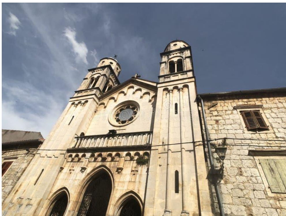
Slika br. 5: Crkva sv. Spiridona u Skradinu