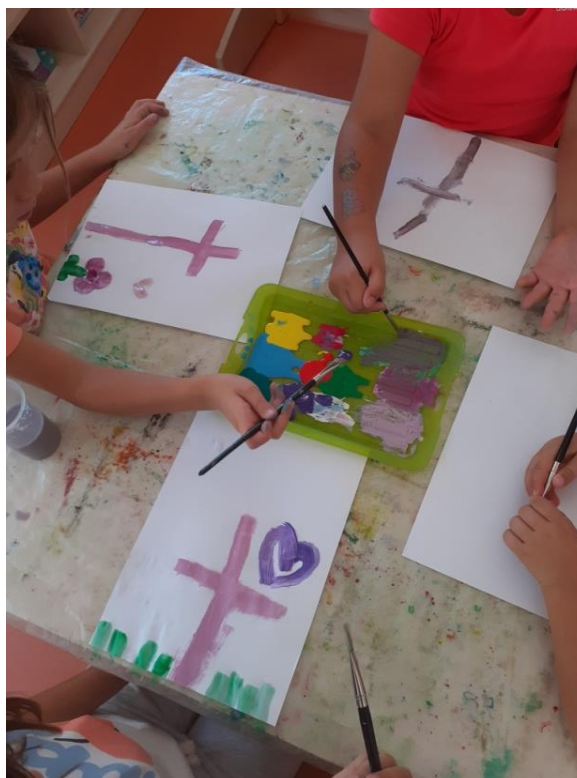
Slika br. 13: Djeca prilikom izvođenja likovne aktivnosti