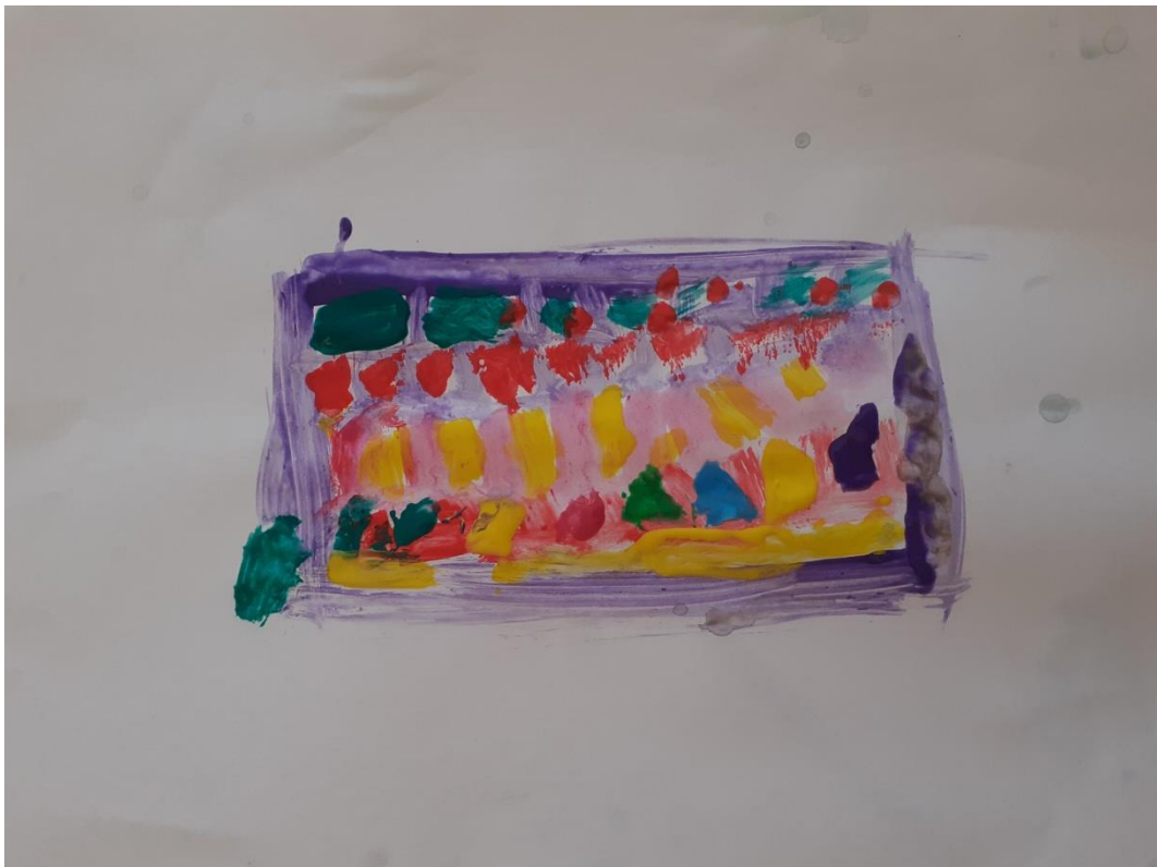
Slika br. 20: Primjer rada dječaka (5 godina)

Možemo primijetiti da je dijete u crkvi uočilo različite sadržaje, ali je odlučilo naslikati križ. Pretpostavljamo da pokreti kista koje uočavamo na slici predstavljaju kišu koju je dijete spomenulo u intervjuu.