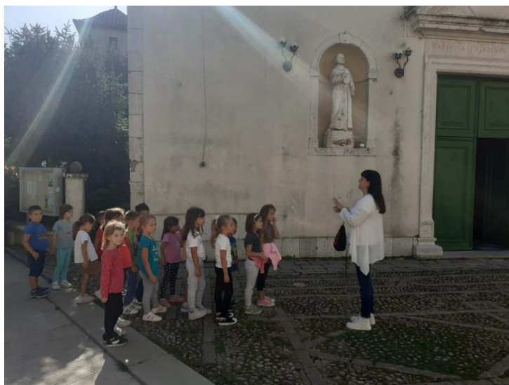
Slika br. 6: Voditeljica zbirke sa skupinom djece ispred crkve Porođenja Blažene Djevice Marije u Skradinu

sadržaje u crkvi. Nakon likovne aktivnosti sa svakim djetetom proveden je polustrukturirani intervju.