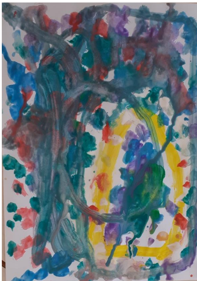
Slika br. 18: Primjer rada dječaka (4,5 godina)

Iz razgovora s djetetom možemo zaključiti da je djetetov glavni motiv bio kip Gospe iako je dijete u crkvi primijetilo i druge motive i sadržaje.