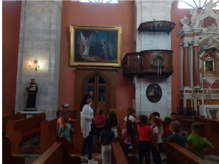
Slika br. 10: Razgledavanje unutrašnjosti crkve Porođenja Blažene Djevice Marije