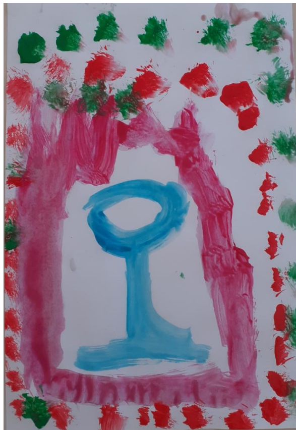
Slika br. 15: Primjer rada dječaka (5 godina)

Od šesnaest dječjih radova koje su djeca naslikala na likovnoj aktivnosti nakon posjeta crkvi, odabrala sam ih šest koje ću zasebno opisati uz izjave djece odnosno polustrukturirane intervjue koje sam s djecom provela. U polustrukturiranom intervjuu djeci sam postavljala pitanja: gdje su danas bili, što su vidjeli u crkvi, što im se najviše svidjelo u crkvi, postoji li nešto što bi u crkvi promijenili, što su naslikali i zašto su baš to naslikali.