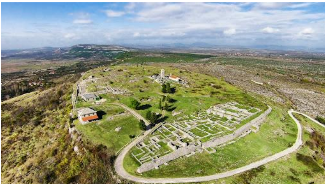
Slika br. 3: Bribirska glavica