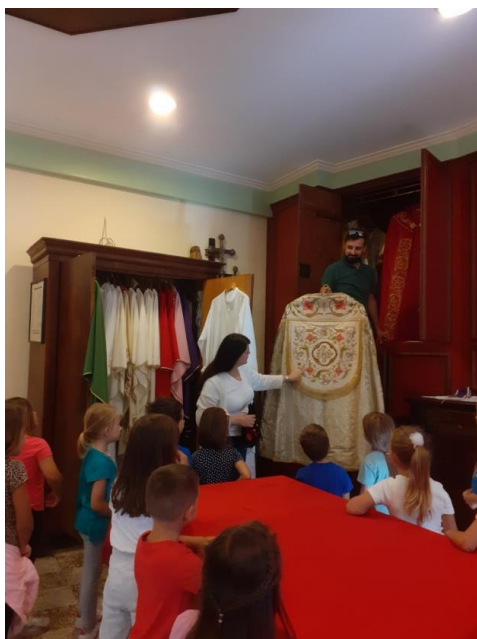
Slika br. 8: Razgledavanje liturgijskog ruha u sakristiji