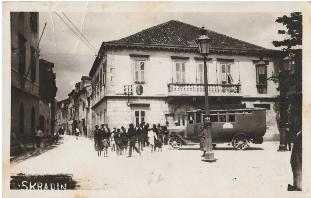
Slika br. 2: Skradin 1934. godine