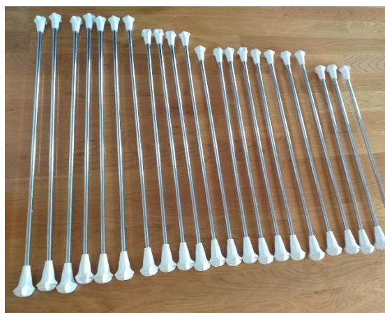
Slika 8. Mažoret štapovi

U ovom poglavlju obradit će se nekoliko elemenata, to jest tehnika koje su osnova mažoret plesa. Tehniciranje sa štapom je podijeljeno u više nivoa, stoga je bitno krenuti od najjednostavnijih, koji se lako usvajaju, prema onim složenijima. Prvi puta kada se djeca susretnu s mažoret štapom trener ih mora naučiti kako se štap u pravilu drži u desnoj ruci. Djeci koja pišu desnom rukom to neće predstavljati problem, međutim djeca koja pišu lijevom rukom automatski će krenuti izvoditi elemente s lijevom rukom. Važno je ovaj problem uočiti na samom početku kako bi se odmah mogao ispraviti. Djecu prvo moramo upoznati s mažoret štapom. Djeca će uočiti kako mažoret štap sa svake strane ima takozvanu „kuglu“. Primijetit će da je jedna „kugla“ veća, a jedna manja. Trener/voditelj treba objasniti kako „kugle“ služe za balans mažoret štapa te se unutar njih nalaze mali utezi koji održavaju ravnotežu. Također, djeca će primijetiti kako mažoret štap nije lagan te ih trener/voditelj mora upozoriti kako trebaju oprezno rukovati njime kako ne bi ozlijedili sebe ili druge. Mažoret štap odabiremo prema veličini ruke, ne smije biti ni predug ni prekratak. Oko mažoret štapa se može omotati grip traka kako se ruka ne bi znojila i klizila po štapu. Grip trake se uobičajeno koriste za omatanje drška teniske reketi iz istog razloga.