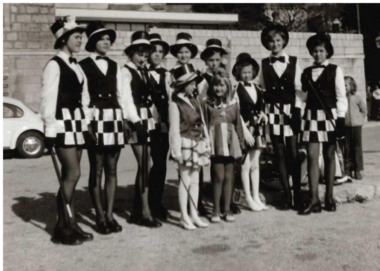
Slika 5. Cavtatske mažoretkinje

Nakon smrti profesorice Varge mažoret ples u Hrvatskoj je stagnirao. Preporod mažoret plesa se javlja 1993. godine osnivanjem Zagrebačkih mažoretkinja. U jesen 1994. godine Hrvatska broji 12 timova, a već 1995. broj se povećao na preko 20. Zagrebačke mažoretkinje su redovito nastupale na HTV-u, za Hrvatski nogometni savez, Predsjednika Republike Hrvatske i brojne druge manifestacije i organizacije (Šćuric, 2017).