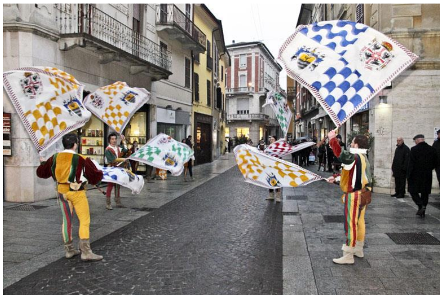
Slika 2. Bacači zastava

Jedna od teorija je da su mažoretkinje nastale od švicarskih muškaraca koji su u paradama nosili šarolike zastave na kopljima. Umjesto da su samo nosili zastave „bandieratori“ kako su ih kasnije nazivali, izvodili su figure, vrtjeli zastave, bacali ih u zrak, njihali i okretali. Bandieratori su danas jedna od glavnih atrakcija na brojnim karnevalima i povorkama diljem svijeta. Akrobatika sa jednom ili više zastava je jedna od karakteristika ovog izražaja. Uz glazbu orkestra i udaraljki izvođači bacaju svoje zastave više do deset metara u zrak, rotiraju ih oko ruku i ostalih dijelova tijela, a uz to na sebi nose tradicionalne uniforme. Zbog ovih karakteristika švicarske bacače zastava smatramo pretečom mažoret plesa (Šćuric, 2017).