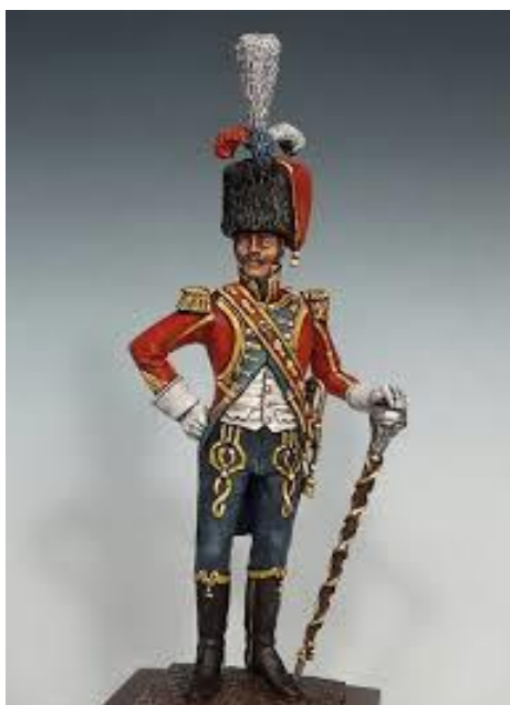
Slika 3. Tambour major ( https://www.zinnfigur.com/en/Round-Figures/Unpainted Kits/Manufacturers-A-C/Atelier-Maket/Drum-Major-4th-Swiss-Regiment-1809.html )

Teorija da su mažoretkinje nastale kao zamjena za tambur majoru je najvjerojatnija teorija i službenom ju smatra Europska mažoret asocijacija. Po ovoj teoriji preteča mažoret plesa je dirigent paradnog vojnog orkestra. Dirigent je ispred orkestra dirigirao ukrašenom palicom od dva metra. Bitno je naglasiti da su ove palice slične današnjim mažoret štapovima. S vremenom je dirigent uz pratnju orkestra izvodio razne figure koje danas podsjećaju na mažoret ples. Naziv dirigenta bio je tambour major (franc. bubnjarski bojnik) te se može pretpostaviti da je naziv mažoretkinja nastao od riječi major. Krajem 18. stoljeća grupa djevojaka koja je u ruci imala palice predvodila je vojnu paradu uz pratnju vojnog orkestra. Djevojke su bile obučene u odore, a predvodile su paradu da bi odlazak na bojište učinile lakšim i manje stresnijim (Šćuric, 2017).