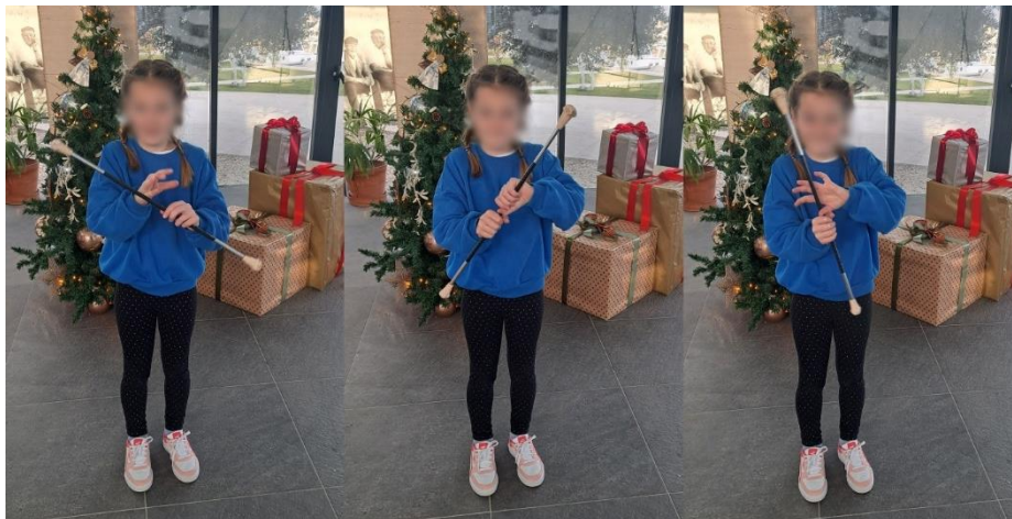
Slika 11. „Sunce“

Mažoret element „Sunce“ možemo definirati kao rotaciju mažoret štapa u desnu stranu prebacujući mažoret štap iz jedne u drugu ruku. Ovaj element je dobio naziv „sunce“ jer kada rotiramo mažoret štap većom brzinom stvaramo dojam kružnice. Ovaj element djeca često lakše usvajaju od „osmice“. Kada prvi put poučavamo djecu ovaj element možemo im reći da se pokušaju sjetiti ako su gledali koji film u kojem glumi Jackie Chan. U takvim filmovima imamo česte scene vrtnje štapom upravo ovog oblika. Potrebno je prvo djeci demonstrirati tehniku a zatim im pokazati početnu poziciju. Štap držimo okomito u desnoj ruci u prostoru između palca i kažiprsta kao da smo stisnuli šaku. Lijevi dlan namješamo pokraj desne ruke dlanom otvorenim prema gore. Zatim prebacujemo mažoret štap iz desne u lijevu ruku „od ispod“ u prostor između lijevog palca i kažiprsta.. Nakon toga opet prebacujemo štap u desnu ruku u smjeru rotacije u desnu stranu te ponavljamo postupak. Važno je da djeci cijelo vrijeme demonstriramo tehniku kako bi lakše uočila kako se štap rotira. Također i u ovoj tehnici nam je jako bitna rotacija zglobova.