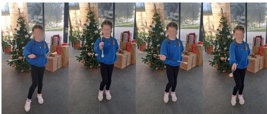
Slika 9. „Kuhanje“