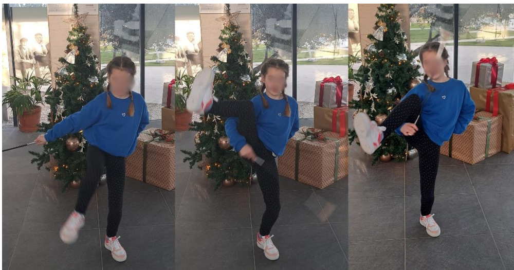
Slika 14. „Izbačaj mažoret štapa ispod noge“

Kada djeca nauče izbačaj štapa u zrak možemo im demonstrirati ovu tehniku. Prvo demonstriramo cijeli postupak, a zatim dio po dio. Početni položaj tijela je takav da mažoret štap držimo za „kuglu“ u desnoj ruci, a istovremeno podižemo lijevu ili desnu nogu i savijamo koljeno pod kutom od 90 stupnjeva. Kod ove tehnike vrlo bitna je ravnoteža i koordinacija. Zatim uhvatimo zamah štapom (možemo napraviti cijeli krug iznad glave s lijeva na desno) i bacimo štap ispod lijeve ili desne noge u zrak. Štap mora postići rotaciju u zraku, a zatim ga lovimo u desnu ruku i spuštamo nogu na tlo.