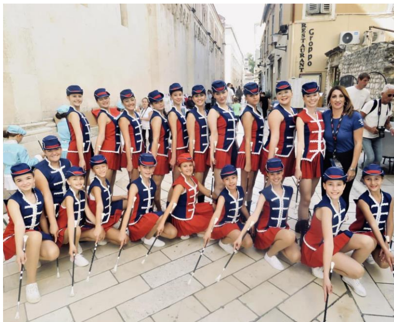
Slika 7. Mažoretkinje grada Zadra

Pod općim dojmom podrazumijevamo dojam kojeg su mažoretkinje ostavile na gledatelje. U opći dojam svrstavamo odoriranost i izgled mažoretkinja. Jedna od glavnih karakteristika mažoretkinja je njihova odora. Svaki tim ima svoju karakterističnu odoru i po tome se prepoznaje. Mažoret uniforma se sastoji od kape, sakoa, suknje i čizama. Boja uniformi je najčešće izrađuje po boji zastave grada ili općine. Prema članku 37. o uniformiranosti Pravilnika Hrvatskog mažoret saveza čitava formacija (tim) mora biti jednako uniformiran, a iznimka je predvodnica koja može imati različitu uniformu od ostalih (Šćuric, 2017). U izgled mažoretkinja u kojeg ubrajamo osmijeh, držanje, frizuru i šminku. Mažoretkinja dok izvodi koreografiju treba imati osmijeh na licu. Osim osmijeha, mažoretkinja mora imati čvrsto držanje glave, ramena, ruku, prsa, struka i bokova. Glava uvijek mora biti prema gore, osim ako koreografija ne zahtijeva drugačije te pogled usmjeren na suce i publiku. Sve djevojke u mažoret timu moraju imati iste frizure te moraju biti jednako našminkane. Kosa mora biti čvrsto vezana te se nalaziti ispod kape (Žigman, 2014).