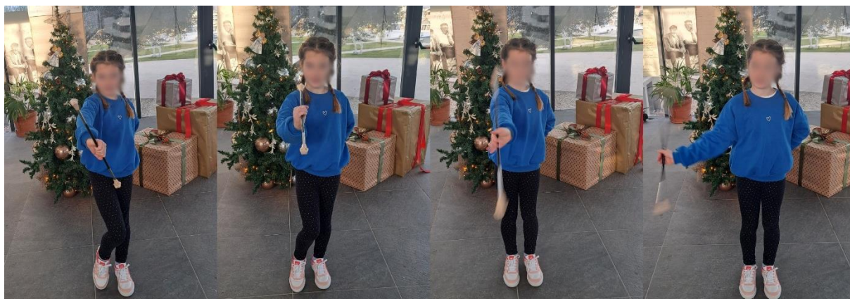
Slika 10. „Osmica“

Druga osnovna tehnika mažoret plesa je „osmica“. Osmicu možemo objasniti kao okomitu vrtnju mažoret štapom u obliku „ležećeg“ broja osam. Često kažemo djeci kada uvježbavamo ovu tehniku da zamisle broj osam, ali kako leži. Trener/voditelj demonstrira i govori djeci da je početni položaj držanje mažoret štapa okomito gdje nam je „velika kugla“ okrenuta prema gore, a „mala kugla“ prema dolje. Ponovno, štap držimo čvrsto u području između kažiprsta i palca i cijeli proces je u rotiranju zgloba. Sada zamislimo kako se ispred nas nalazi ležeći broj osam te ga krećemo „oslikavati“ mažoret štapom. Također možemo reći kako mažoret štapom „crtamo“ ribicu jer ona podsjeća na polegnuti broj osam. Ako ovaj način objašnjavanja tehnike ne uspijeva, tehniku djeci možemo opisati kao da nešto „grabimo“. Namjestimo štap u početni položaj te govorimo kako „velikom kuglicom“ prvo grabimo u lijevu stranu kažemo „prema naprijed“ u obliku kružnice, a zatim grabimo u desnu stranu „od iza“ u obliku kružnice. Kada djeca usporeno usvoje tehniku potičemo ih da pokušaju vrtjeti mažoret štap i zglob što brže kako bi došli do krajnjeg rezultata. Ako djeca ne razumiju ovu tehniku možemo uzeti jedan vršak mažoret štapa dok je u njihovoj ruci i pokazati im u kojem smjeru štap treba ići kako bi djeca dobila osjećaj kuda se štap mora kretati. Ovu tehniku je kompliciranije usvojiti od tehnike „kuhanja“ i trebamo izdvojiti više vremena, ali je neophodna za mažoret ples i daljnji napredak.