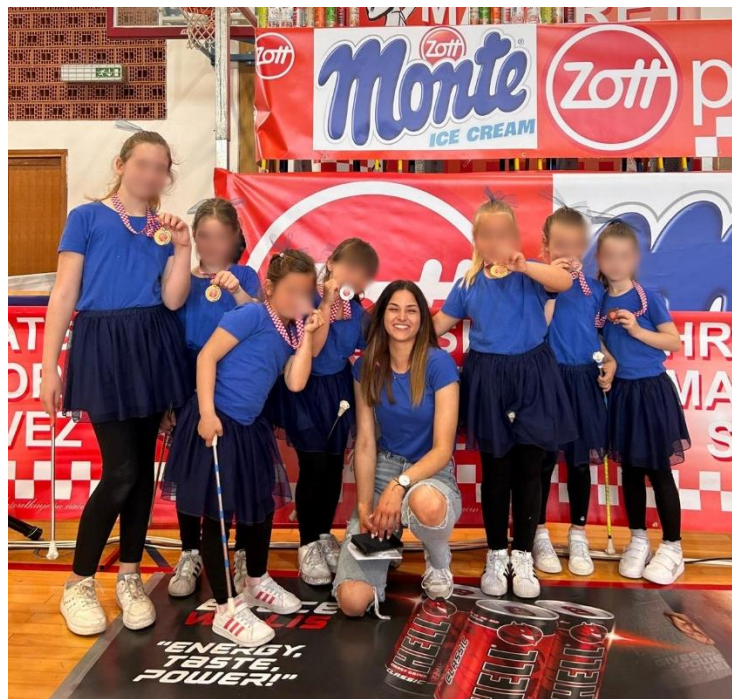
Slika 1. Natjecanje u prvom i višem koraku

Zadnjih godina Hrvatski mažoret savez osmislio je natjecanje u „prvom“ i „višem“ koraku. Prvi korak osmišljen je za mažoretkinje od 4 do 9 godina, a viši korak za mažoretkinje od 10 do 25 godina. Ovaj sustav natjecanja osmišljen je za mažoretkinje početnice koje još uvijek nisu spremne za sudjelovanje na državnom natjecanju. Mažoretkinje nekoliko mjeseci prije „prvog“ i „višeg“ koraka dobivaju snimak koreografije koju moraju izvesti ispred suca samostalno na zadanu glazbu. Sudac nakon njihove izvedbe odlučuje hoće li mažoretkinja dobiti brončanu, srebrnu ili zlatnu medalju. Ovaj sustav natjecanja je idealan za poticanje bavljenja mažoret plesom i daje vjetar u leđa mažoretkinjama koje su tek krenule sa svojim radom.