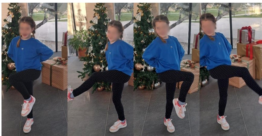
Slika 17. „Kick“