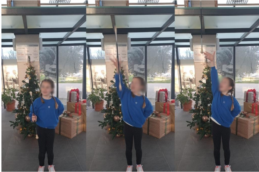
Slika 12. „Izbačaj mažoret štapa okomito“