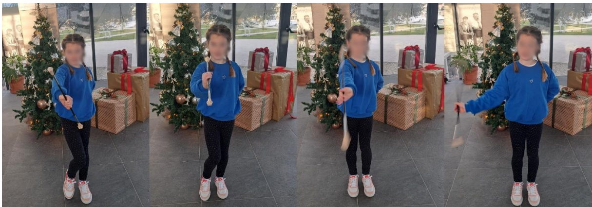
Slika 10. „Osmica“

Druga osnovna tehnika mažoret plesa je „osmica“. Osmicu možemo objasniti kao okomitu vrtnju mažoret štapom u obliku „ležećeg“ broja osam. Često kažemo djeci kada uvježbavamo ovu tehniku da zamisle broj osam, ali kako leži. Trener/voditelj demonstrira i govori djeci da je početni položaj držanje mažoret štapa okomito gdje nam je „velika kugla“ okrenuta prema gore, a „mala kugla“ prema dolje. Ponovno, štap držimo čvrsto u području između kažiprsta i palca i cijeli proces je u rotiranju zgloba. Sada zamislimo kako se ispred nas nalazi ležeći broj osam te ga krećemo „oslikavati“ mažoret štapom. Također možemo reći kako mažoret štapom „crtamo“ ribicu jer ona podsjeća na polegnuti broj osam. Ako ovaj način objašnjavanja tehnike ne uspijeva, tehniku djeci možemo opisati kao da nešto „grabimo“. Namjestimo štap u početni položaj te govorimo kako „velikom kuglicom“ prvo grabimo u lijevu stranu kažemo „prema naprijed“ u obliku kružnice, a zatim grabimo u desnu stranu „od iza“ u obliku kružnice. Kada djeca usporeno usvoje tehniku potičemo ih da pokušaju vrtjeti mažoret štap i zglob što brže kako bi došli do krajnjeg rezultata. Ako djeca ne razumiju ovu tehniku možemo uzeti jedan vršak mažoret štapa dok je u njihovoj ruci i pokazati im u kojem smjeru štap treba ići kako bi djeca dobila osjećaj kuda se štap mora kretati. Ovu tehniku je kompliciranije usvojiti od tehnike „kuhanja“ i trebamo izdvojiti više vremena, ali je neophodna za mažoret ples i daljnji napredak.