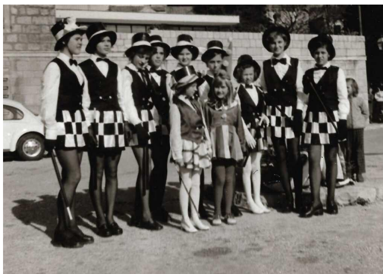
Slika 5. Cavtatske mažoretkinje

Nakon smrti profesorice Varge mažoret ples u Hrvatskoj je stagnirao. Preporod mažoret plesa se javlja 1993. godine osnivanjem Zagrebačkih mažoretkinja. U jesen 1994. godine Hrvatska broji 12 timova, a već 1995. broj se povećao na preko 20. Zagrebačke mažoretkinje su redovito nastupale na HTV-u, za Hrvatski nogometni savez, Predsjednika Republike Hrvatske i brojne druge manifestacije i organizacije (Šćuric, 2017).