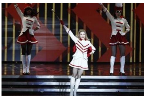
Slika 4. Madonna kao mažoretkinja ( https://blog.dnevnik.hr/zgmazoretkinje/2012/06/1630830974/sef-se-vratio-sa-drzavnog-prvenstva-ceske.html?page=blog&id=1630830974&subpage=0&subdomain=zgmazoretkinje )