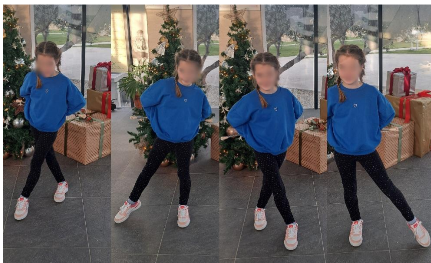
Slika 18. „Križanje“