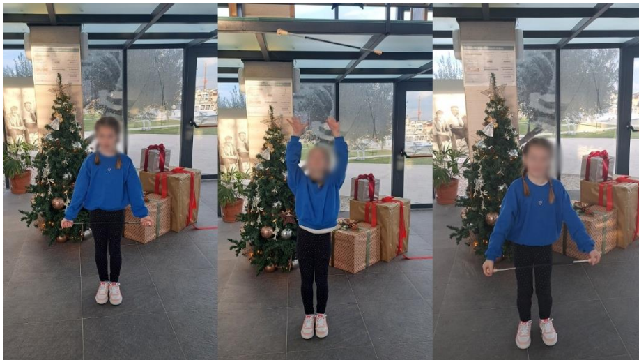
Slika 13. „Izbačaj mažoret šta pa paralelno“