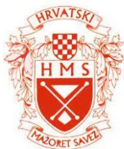
Slika 6. Grb HMS-a ( https://web.facebook.com/hrvatski.mazoret.savez/?_rdc=1&_rdr )