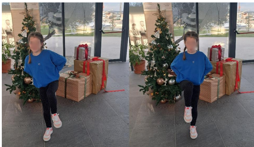
Slika 16. „Stupanje“