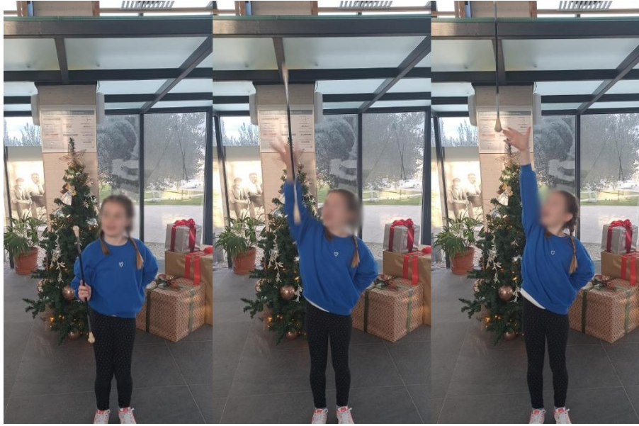
Slika 12. „Izbačaj mažoret štapa okomito“ (vlastita arhiva)