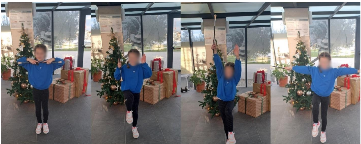
Slika 15. „Semafor“

„Semafor“ nije određena tehnika kao prethodne, već svaki puta može biti drugačija. „Semafor“ smišlja trener/voditelj aktivnosti ili ga čak mogu osmisliti i djeca te dati svoj prijedlog. Najčešće se veže uz „stupanje“ ili „stupovni korak“ koje će se obraditi u idućem poglavlju. „Semafor“ najčešće traje jednu osmicu koju čine osam udaraca. Osmica je osnovna koreografska jedinica u mažoret plesu. Semafor se izvodi najčešće bez vrtnje mažoret štapa, to jest takozvanim „mrtvim štapom“. Određuju ga različiti pokreti ruku i štapa u različitim smjerovima. U poučavanju semafora voditelj je dužan metodom demonstracije pokazati „semafor“ u cijelosti. Zatim krećemo na usvajanje zadanog korak po korak. U semaforu mijenjamo položaj ruku kako bi koreografija izgledala dinamičnije. Ovakve tehnike utječu na razvoj koordinacije kod djece. Ruke i mažoret štap možemo predručiti ispred tijela, u lijevu stranu, u desnu stranu, iza leđa, iznad glave i slično.