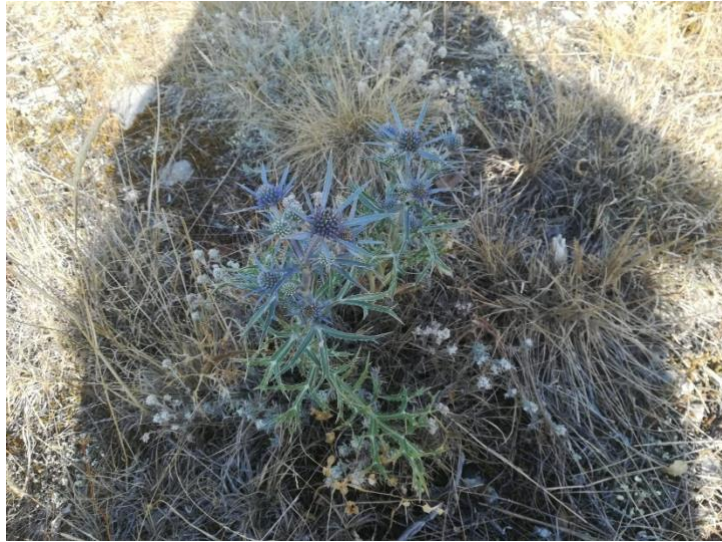
Slika 5. Eryngium amethystinum L.

Plavi kotrljan (slika 5.) je trajna zeljasta biljka koja dolazi iz porodice štitarki ( Apiaceae ).