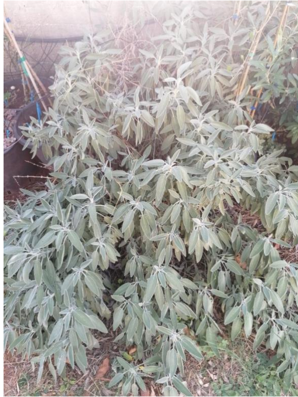
Slika 6. Salvia officinalis L.

Ljekovita kadulja (slika 6.) višegodišnji je polugrm ili mali grm, pripada porodici usnača ( Lamiaceae ). Cvjetovi su ljubičaste boje. U cvatu (pršljenu) ima najviše do 12 cvjetova. Čaška je izrazito dvousnata, a njezini su zupci produljeni. Prašnici na nitima imaju po jedan privjesak u obliku poluge, a njihove antere imaju samo jednu polutku. Vrat tučka je prilegnut uz gornju usnu vjenčica. Listovi su pri dnu bez uškastih lisaka. Stabljika je malo ili uopće nije razgranjena. (Rogošić,2011.)