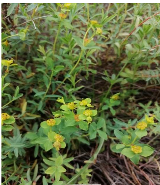
Slika 12. Euphorbia spinosa L.

Trnovita mlječika (slika 12.) je zeljasta trajnica sa uspravnim stabljikom. Cvat je zrakast sa 3-5 cvjetova. Po jedan ženski cvijet i više muških cvjetova, a koji se sastoje od samo jednog prašnika u zajedničkom ovoju, tako da čitav cvat (cijatij) nalikuje na dvospolne cvjetove. Žlijezde ovoja poprečno su ovalne ili okruglaste, a nikad polumjesečaste. Listovi su lancetasti, cjelovita su ruba, nemaju palistića, većinom su izmjenično postavljeni na stabljici. Prošlogodišnje grane su trnovite. Podanak je vertikalalan, a iz njega izbija više cvatućih stabljika. Plod je tobolac, koji ima poluokruglaste ili kratko valjkaste bradavice. Cijatiji sličje pojedinačnim cvjetovima, a svaka se takva skupina (ciatij) sastoji od jednog središnjeg ženskog cvijeta, koji je opkoljen sa deset ili više vrlo jednostavnih muških cvjetova, gdje su svi obavijeni zajedničkim ovojem u obliku zvonca. (Rogošić,2011.)