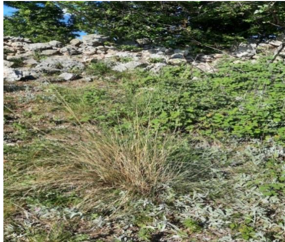
Slika 3. Festuca valesiaca Schleich.

Vlasulja (slika 3.) busenasta je trajnica koja naseljava osunčane, suhe kamenjarske padine koje su orijentirane pretežno prema jugu ili zapadu i na području gdje je plitko siromašnije tlo (crljenica među kamenjem ili čak pjeskovito tlo). Također, tvori i posebne livade koje se mogu pronaći na područjima kao što su otok Pag, Lika i Krbava. Podnosi niže temperature (sjemenke počnu klijati nešto iznad 5°C) te ispašu. Vrijeme cvjetanja joj je od svibnja do srpnja, a oprašivač je vjetar. Korijenski sustav joj je plitak i razgranat te prilagođen oskudnom tlu. Može se pronaći u arealu od nizina do preko 2000 m nadmorske visine, npr. Biokovo najviši predjel ali i priobalni predjeli (najčešće pod alepskim borom). (Domac, 2002.)