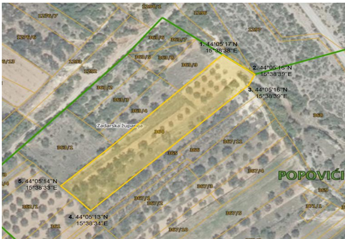
Slika 2. Istraživano područje s istaknutim GPS točkama

Provedena istraživanja ove pašnjačke zajednice odvijala su se tijekom svibnja gdje je odlazak na teren bio potreban više puta kako bi se kvalitetno moglo proučiti dominantne i najupečatljivije vrste pašnjačke vegetacije. Izlaskom na teren uočen je brz rast biljaka zbog izrazito kišnog vremena u ovom mjesecu. Tijekom izlaska na teren i proučavanja biljne zajednice uzeto je područje Popovića. Lokacija na kojoj su se radila istraživanja i proučavanja pašnjačke vegetacije, udaljena je od grada Zadra oko 45km te se nalazi na nadmorskoj visini od 240m. Za ovo područje je karakteristična mediteranska klima, gdje prevladavaju blage i kišovite zime te topla i suha ljeta.