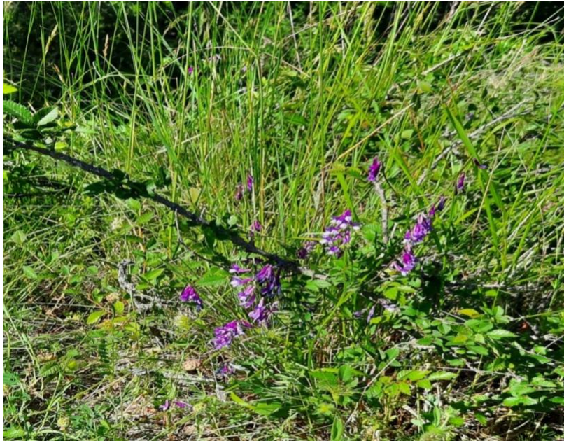
Slika 7. Campanula sibirica L.var. divergens

Campanula sibirica L.(slika 7.) je višegodišnja trajna zeljasta biljka, pripada porodici zvončića ( Campanulaceae ). Ova biljka rasprostranjena je na prostorima gdje prevladava umjerena klima, a to su najčešće područja poput stepa, livada ali i planinski predjeli gdje se nalaze stijene. Ovu biljku krase razgranjena stabljika na kojoj se nalaze naizmjenično raspoređeni i izverugani listovi. Ono što ističe ovu biljku i čini je posebnom je izgled cvjetova koji imaju oblik zvona, a oni mogu biti skupljeni u jednostavni ili sastavljeni grozd i modroljubičaste su boje. Čašku čine lapovi koji se sastoje od 5 linearno formiranih zubića, a plod se naziva tobolac. Vrijeme cvatnje je u periodu proljeća pa sve do ljeta. (Domac,2002.).