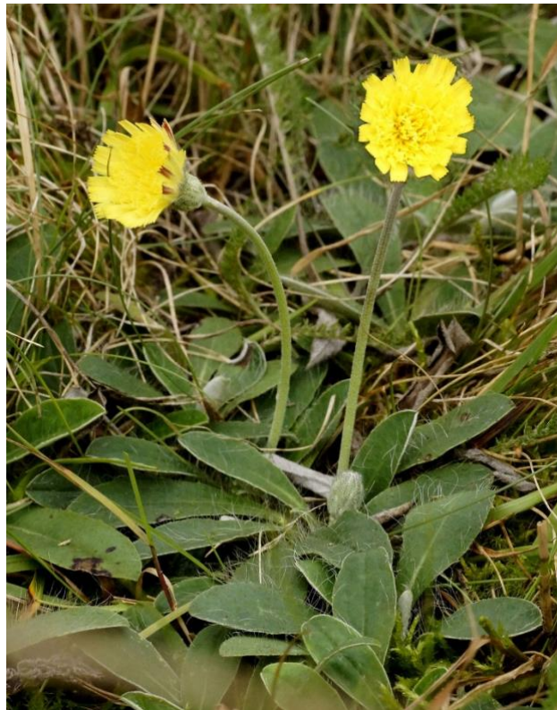
Slika 11. Hieracium pilosella L.

Mala runjika (slika 11.) je trajna zeljasta biljka, a spada u porodicu glavočike ( Compositae ). Cvjetovi su žuti ili narančasti, obodni cvjetovi često izvana s crvenim prugama, skupljeni u pojedinačnim glavicama. Ovojni listovi su uski i šiljasti. Stabljika je nerazgranjena s jednom glavicom, ne sadrži listove, malokad je u donjem dijelu rašljasta. Listovi su smješteni pri dnu