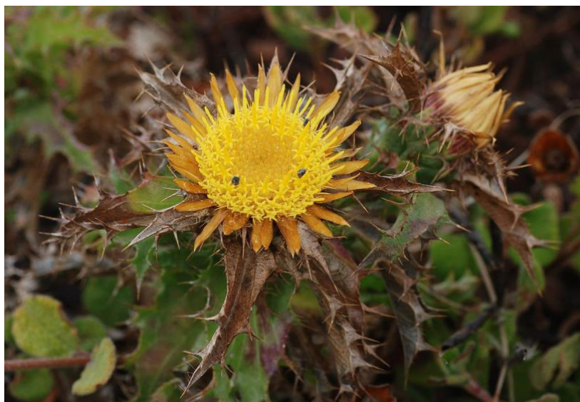
Slika 10. Carlina corymbosa L.

Gornjasti kravljak (slika 10.) je trajna zeljasta biljka, a pripada porodici glavočika (Compositae). Zrakasti ovojni listovi odozgo su žuti, široko su lancetasti, uglavnom goli. Glavice su skupljene u gornji. Samo su u vanjskim cvjetovima dlačice papusa rasperane. Unutarnji ovojni listovi cvjetnih glavica su produljeni, zrakasto su rašireni pa su slični jezičastim obodnim cvjetovima, uglavnom su bijeli. Stabljika većinom visoka, s nekoliko glavica, koje su do 3,5cm u promjeru. Papsus se sastoji od jednog reda perastih dlaka. Listovi su lancetasti, nazubljeni ili rasperani. Listovi su trnovito nazubljeni. (Rogošić,2011.)