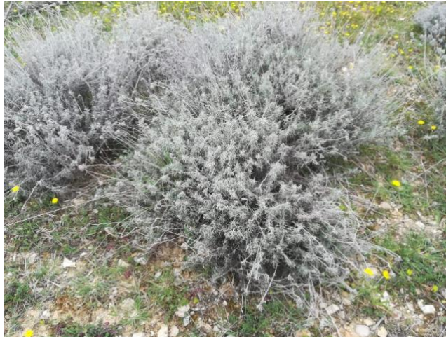
Slika 9. Helichrysum italicum G. Don.

Smilje (slika 9.) je polu grmovita biljka koja pripada porodici glavočike ( Asteraceae ). Ovojni listovi su svijetložuti. Ženski obodni cvjetovi su jednoredni, imaju oblik tankih niti. Papus je u obliku dlačica, koje su poredane u jednom redu. Ovojni listovi cvjetnih glavica čitavi su suho kožičasti. Ovojni listovi su najčešće žuti i na vrhu su često narančasti. Listovi su linearni, a na rubu su prevrnuti. (Rogošić,2011.).