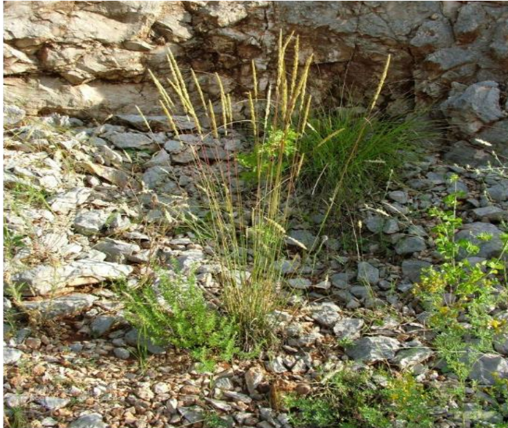
Slika 4. Koeleria splendens Presl.

Sjajna smilica (slika 4.) jednogodišnja trajnica je biljka koju karakterizira zbijeni busen. Nastanjuje kamenjarske travnjake i pašnjake ali i listopadne šumarke i šikare koji se protežu od 0 do 1800m nadmorske visine. Također, nastanjuje suhe i tople predjele koji su prekriveni vapnenom podlogom. Vrijeme cvjetanja započinje u svibnju a završava u srpnju, dok je oprašivač vjetar. (Domac, 2002.)