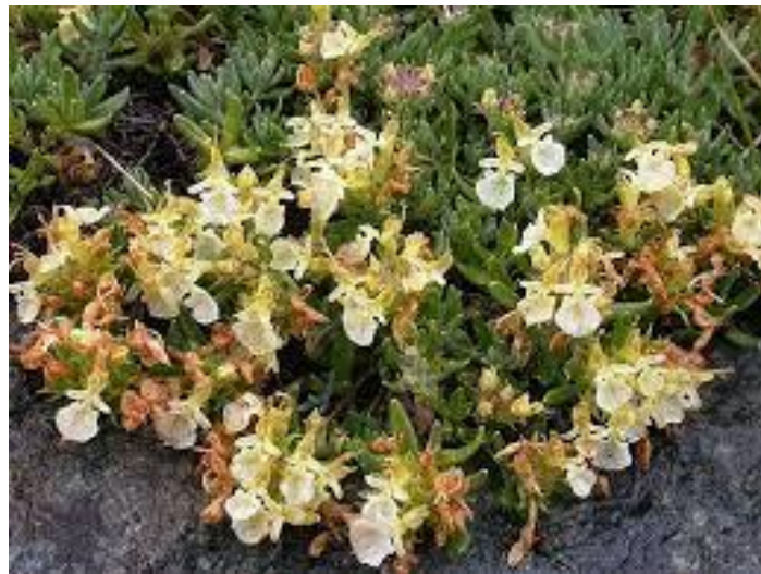
Slika 8. Teucrium montanum L.

Trava iva (slika 8.) spada u višegodišnje biljke, pripada porodici usnača (Laminaceae), a ime po kojem je još poznata je brdski dubać. Cvjetovi su žuti, skupljeni su u prividnim pršljenima, koji čine terminalne glavice. Donja usna vjenčića cvijeta je peterodijelna. Gornje usne nema, a na njezinu se mjestu nalazi na gornjoj strani cijevi vjenčića jedna pukotina. Čaška cvijeta se