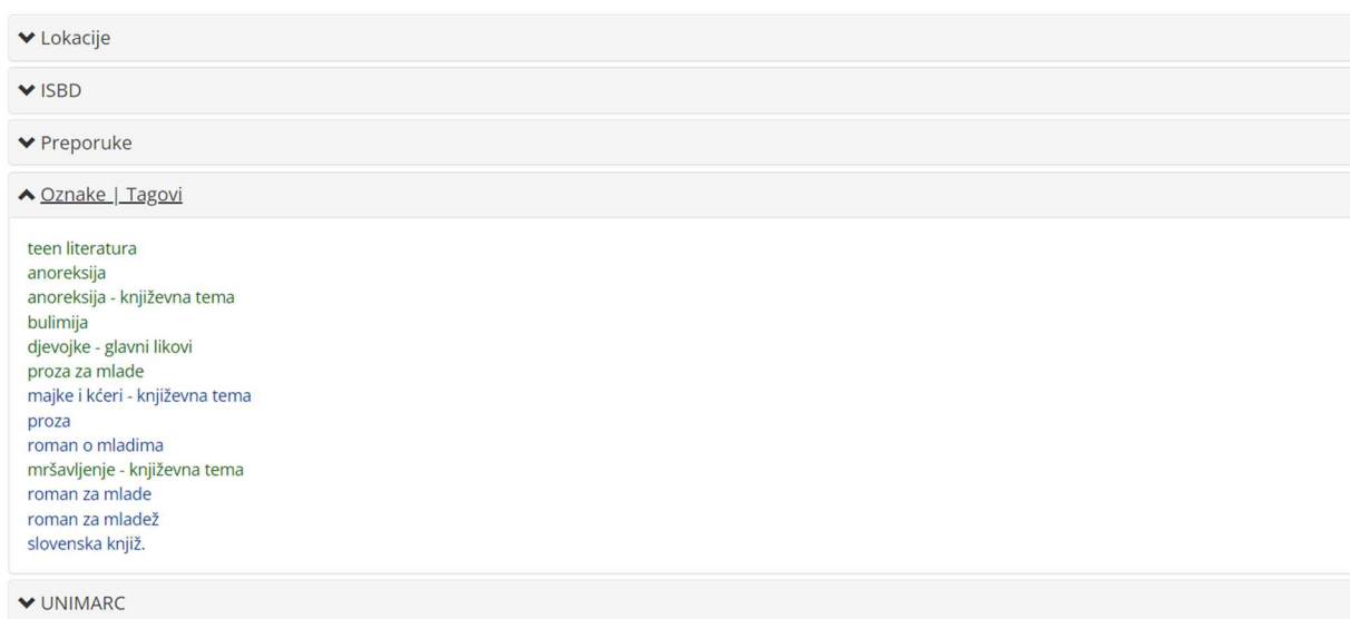
Slika 9. Primjer pronalaska rezultata prema oznakama ili tagovima u sustavu ZAKI

Prema predloženom popisu tekstova za djecu i mlade u sustavu Zaki od određenih knjiga izdvojeno je nekoliko odgovarajućih znakova ili tagova u svrhu pronalaska šireg popisa knjiga koji pripadaju beletristici. Ispod svakog dobivenog rezultata pretrage ponuđena je rubrika "Oznake | Tagovi" gdje se nalaze najstrodnije odrednice tražene tematike.