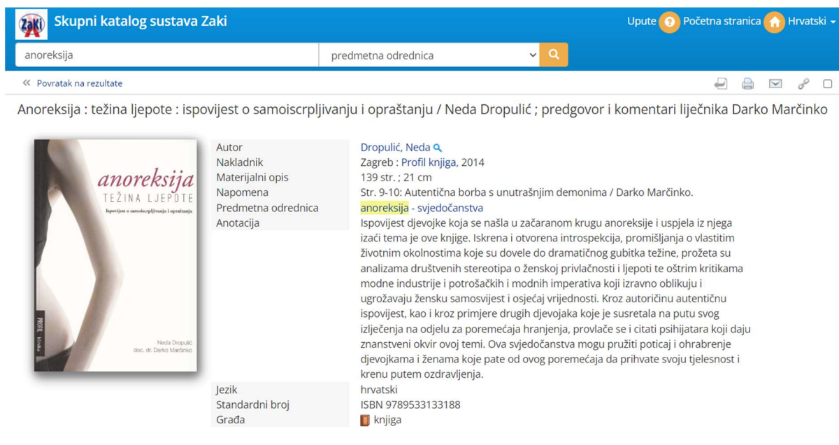
Slika 7. Primjer pretraživanja u skupnom katalogu sustava ZAKI

Također, potrebno je naglasiti djelo Anoreksija: težina ljepote: ispovijest o samoiscrpljivanju i opraštanju autorice Nede Dropulić. Kao i u CROLIST-u, prikazani rezultat donosi ispovijest adolescentice.