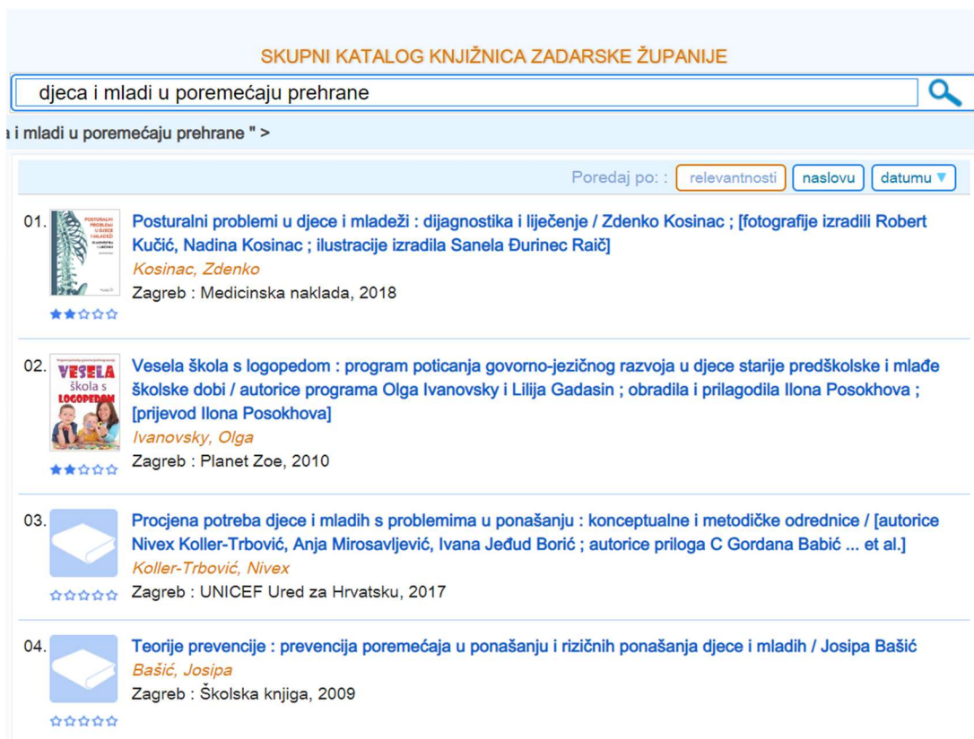
Slika 2. Primjer pretraživanja u sustavu Vero