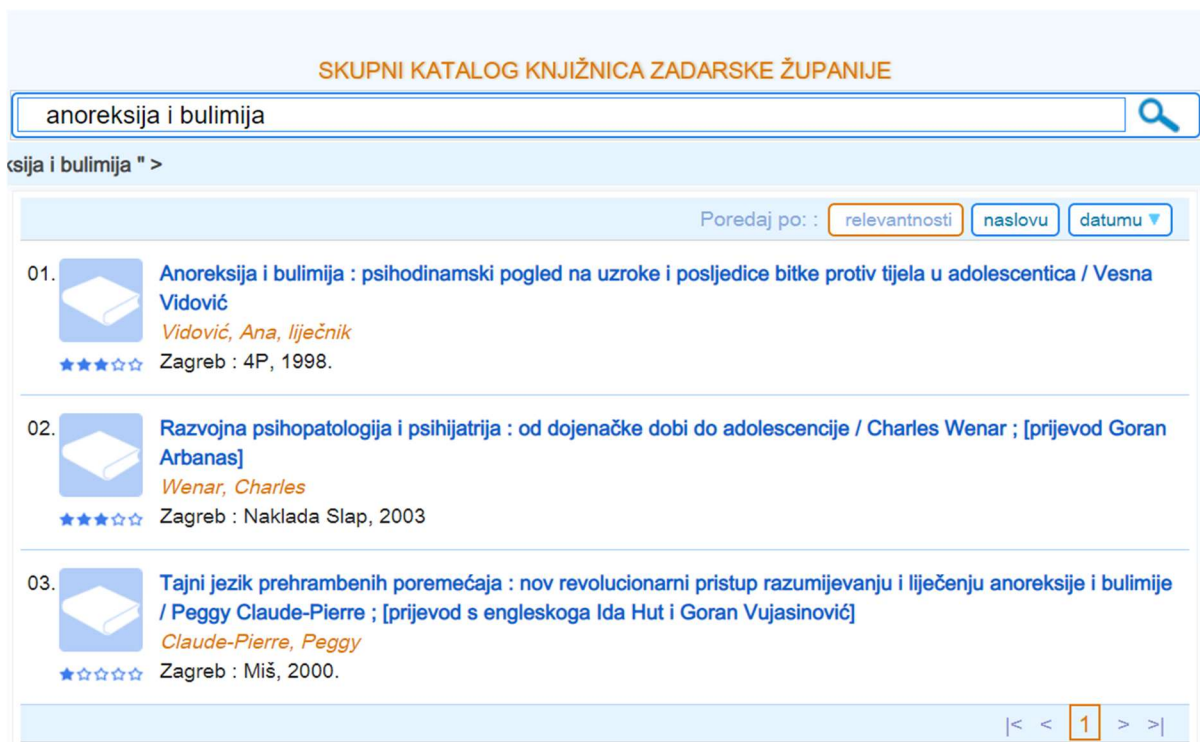
Slika 3. Primjer pretraživanja u sustavu Vero