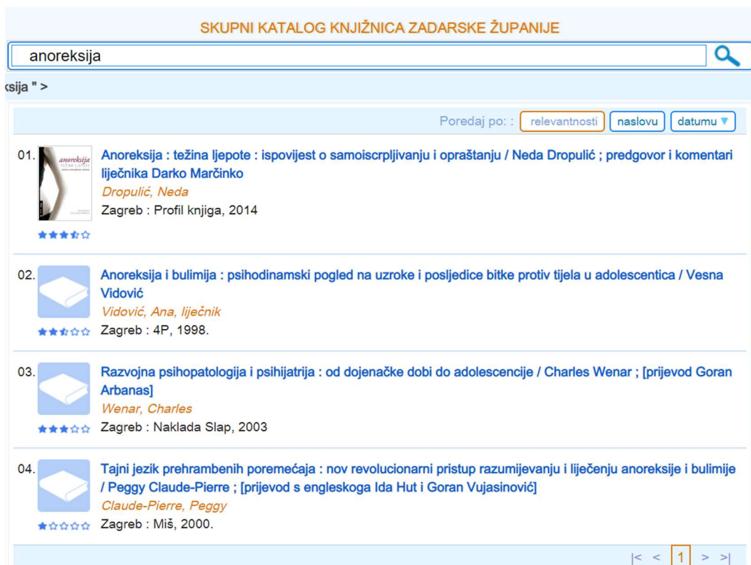
Slika 1. Primjer pretraživanja u sustavu Vero