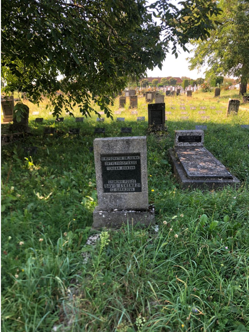
Slika 26. Skupna grobnica 11 nepoznatih omladinki (24. kolovoza 2023.)