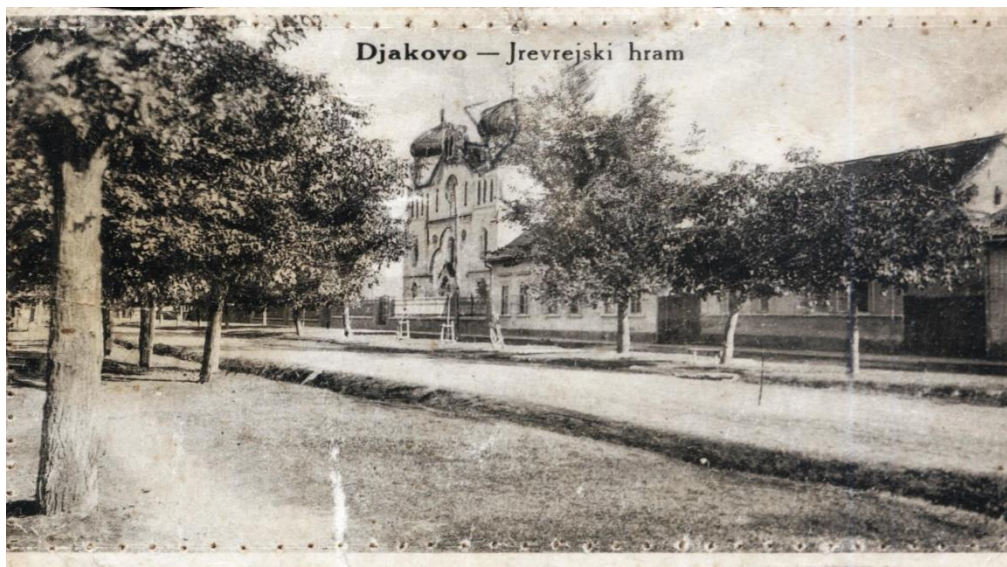
Slika 1. Faksimil razglednice s prikazom đakovačke sinagoge, 1915.