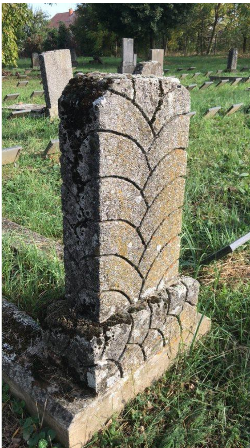
Slika 19. Grobnica Flore i Sare Levi, motiv riblje ljuske na kamenom spomeniku (24. kolovoza 2023.)