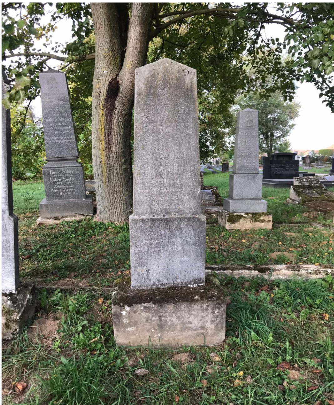
Slika 6. Primjer kamenog spomenika koji završava blago zakošeno (foto Lorena Lelas, 24. kolovoza 2023.)