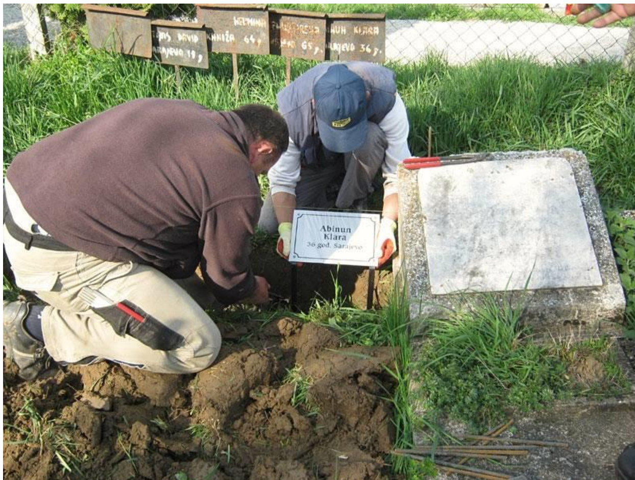
Slika 32. Radovi na obnavljanju nadgrobnih ploča logoraša, svibanj 2011.