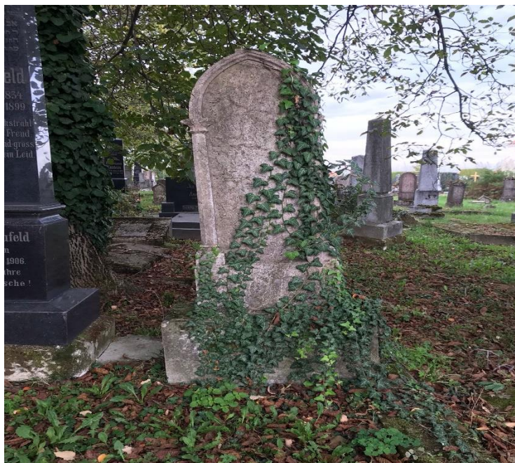
Slika 4. Primjer kamenog spomenika na kojem je nemoguće iščitati podatke o pokojniku (foto Lorena Lelas, 24. kolovoza, 2023.)