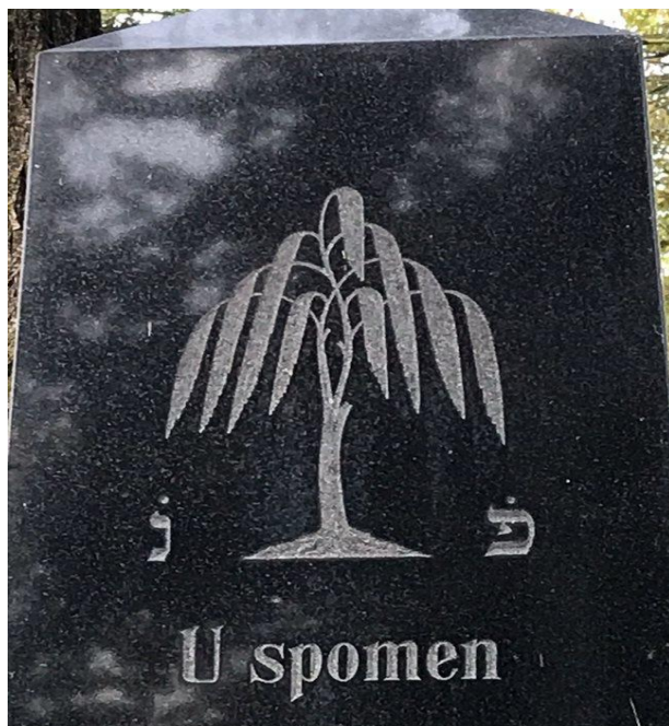
Slika 22. Motiv žalosne vrbe, grobnica obitelji Goldberger (24. kolovoza 2023.)