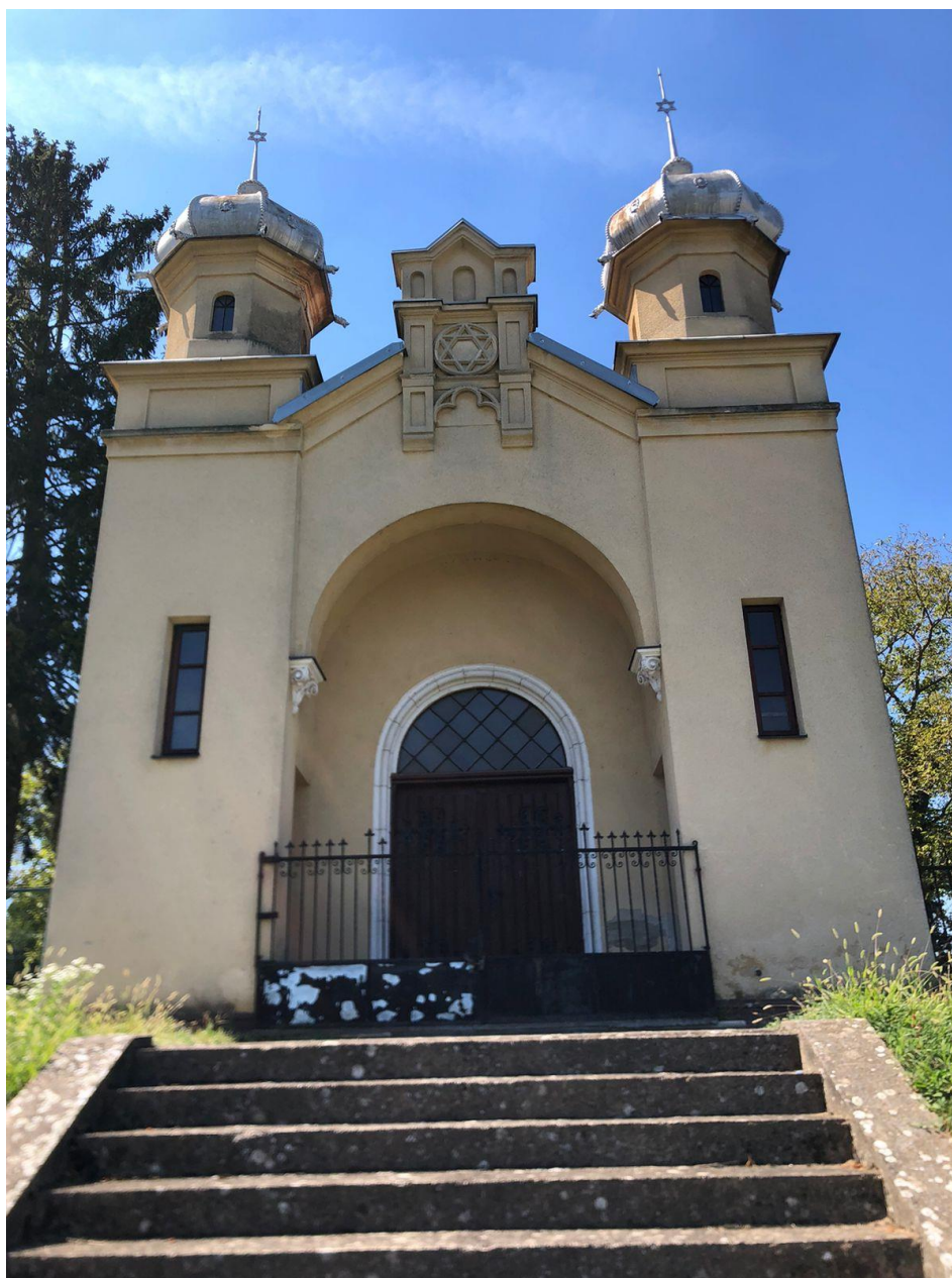
Slika 24. Mrtvačnica u sklopu židovskog groblja (foto Lorena Lelas, 24. kolovoza 2023.)