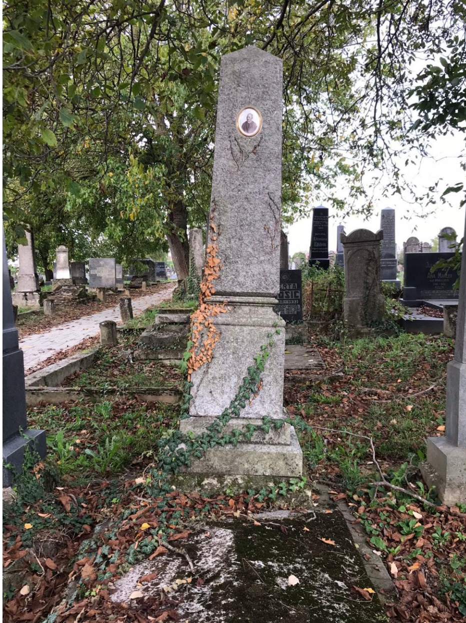
Slika 10. Primjer kamenog spomenika s pokojnikovom slikom (foto Lorena Lelas, 24. kolovoza, 2025.)