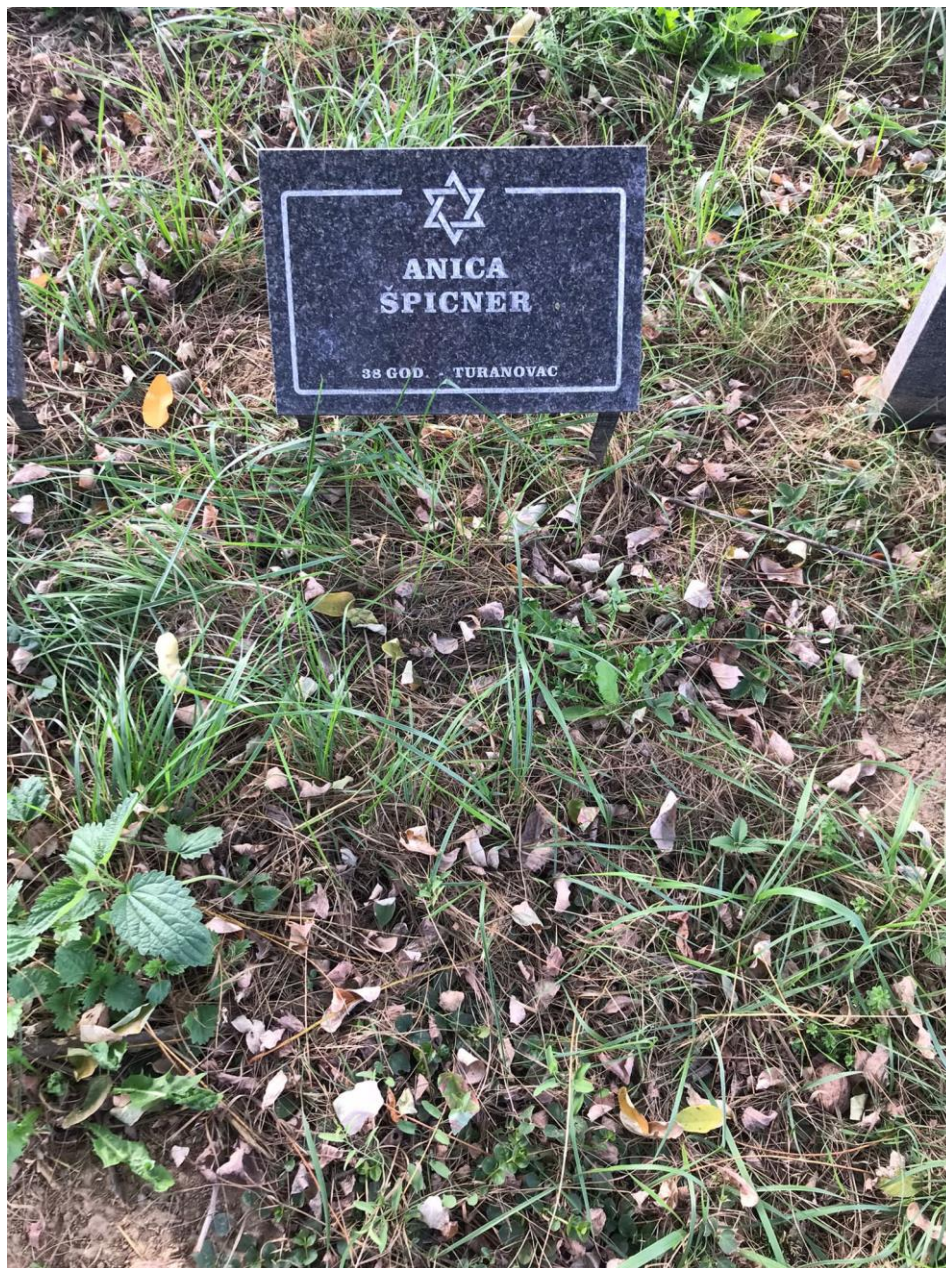
Slika 21. Obilježavanje grobnog mjesta crnom limenom pločom (foto Lorena Lelas, 24. kolovoza 2023.)