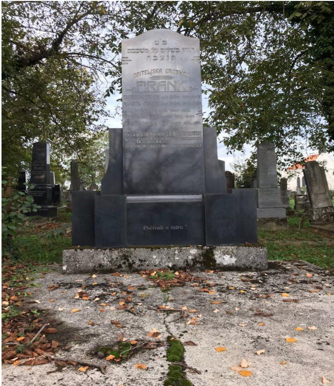
Slika 15. Grobnica obitelji Frank (foto Lorena Lelas, 24. kolovoza 2023.)