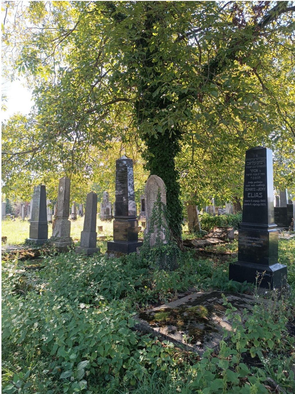
Slika 31. Vidljive posljedice neredovitog održavanja groblja, odnosno zaštićnog kulturnog dobra (foto Lorena Lelas, 24. kolovoza 2023.)