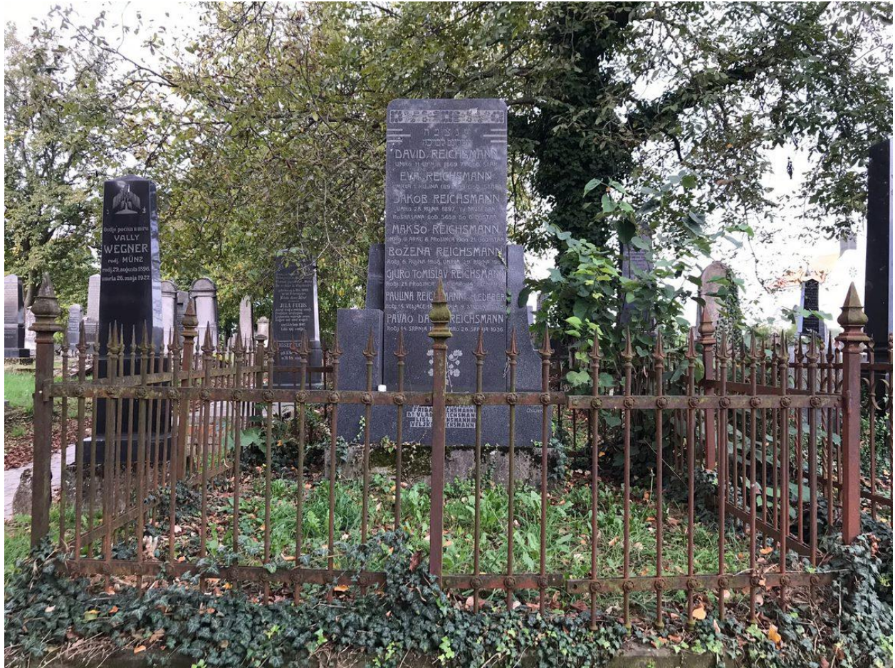
Slika 14. Grobnica obitelji Reichsmann (foto Lorena Lelas, 24. kolovoza 2023.)