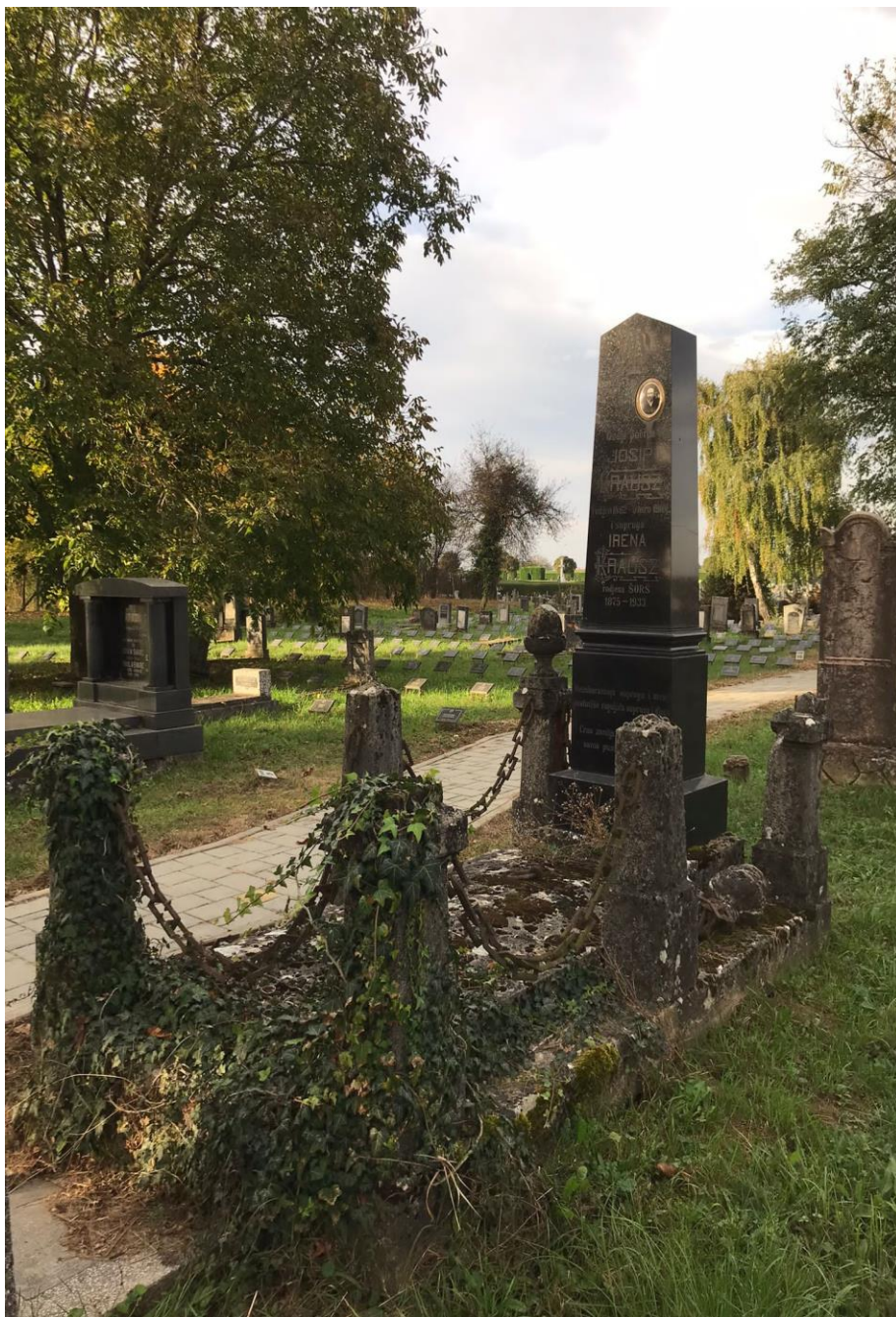
Slika 16. Grobnica obitelji Krausz (foto Lorena Lelas, 24. kolovoza 2023.)