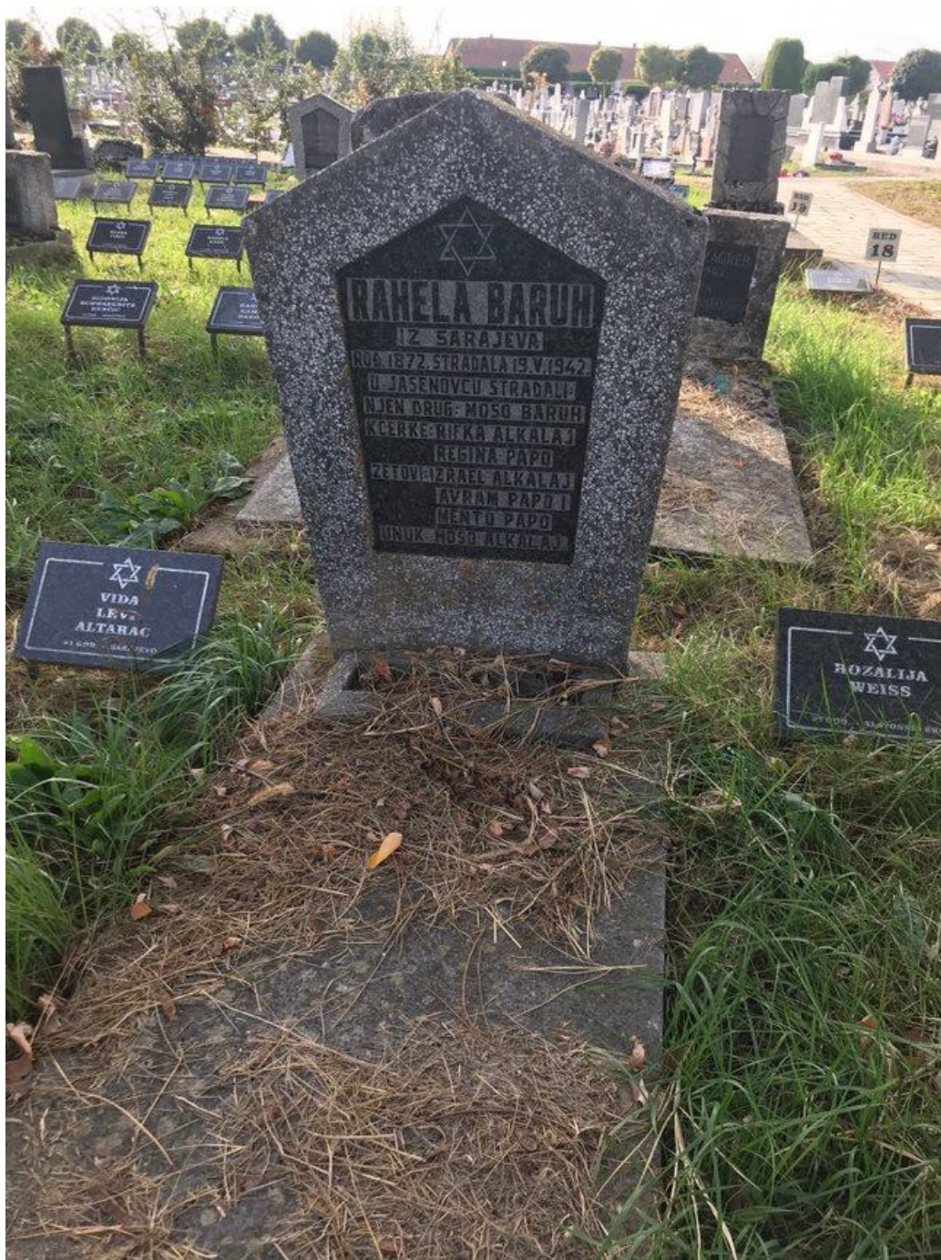
Slika 20. Još jedan često zastupljen tip nadgrobnog spomenika (foto Lorena Lelas, 24. kolovoza 2023.)