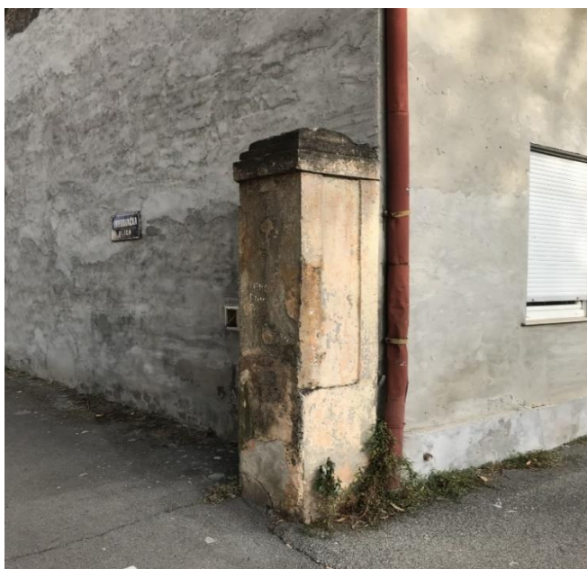
Slika 2. Jedan od dva, in situ sačuvana, ostatka nekadašnje đakovačke sinagoge, u današnjoj Frankopanskoj ulici na broju 14 (foto Lorena Lelas, 12. rujna 2023.)