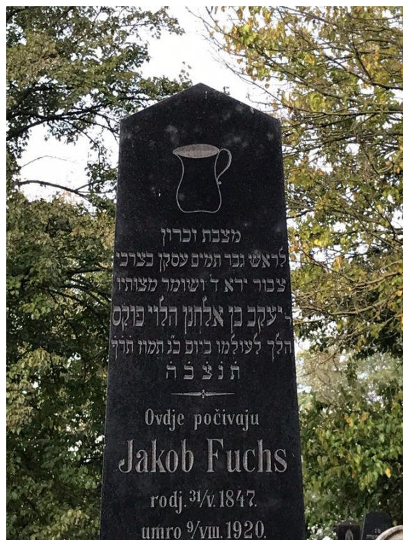
Slika 23. Motiv vrča, grobnica obitelji Fuchs (foto Lorena Lelas, 24. kolovoza, 2023.)