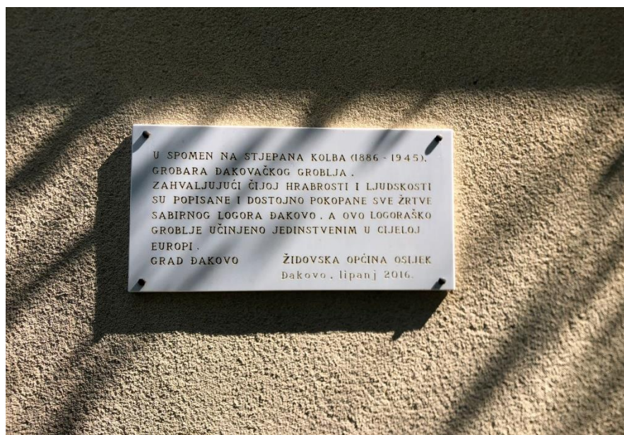
Slika 29. Spomen-ploča posvećena Stjepanu Kolbu (foto Lorena Lelas, 24. kolovoza 2023.)