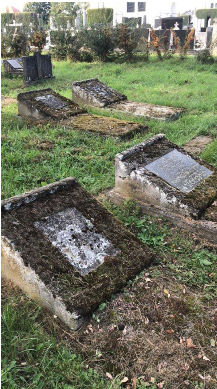
Slika 18. Tip grobnica napravljenih od dva betonska dijela (24. kolovoza, 2023.