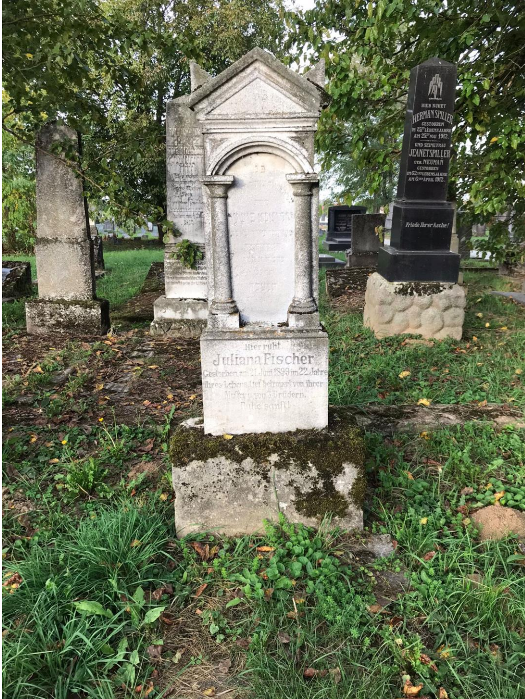
Slika 9. Primjer kamenog spomenika s dva polustupa, profiiranim lukom i zabatom (foto Lorena Lelas, 24. kolovoza 2023.)