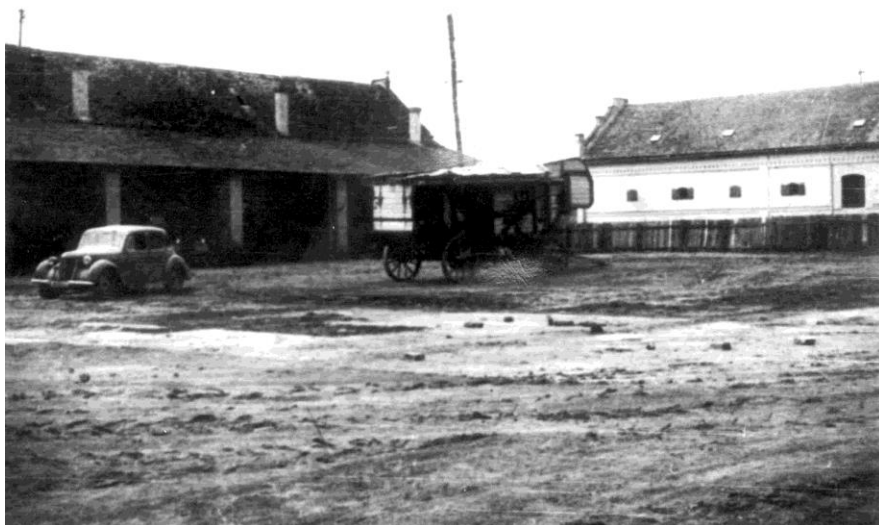
Slika 3. Dvorište nekadašnjeg mlina Cereale u kojem se nalazio Sabirni logor Đakovo