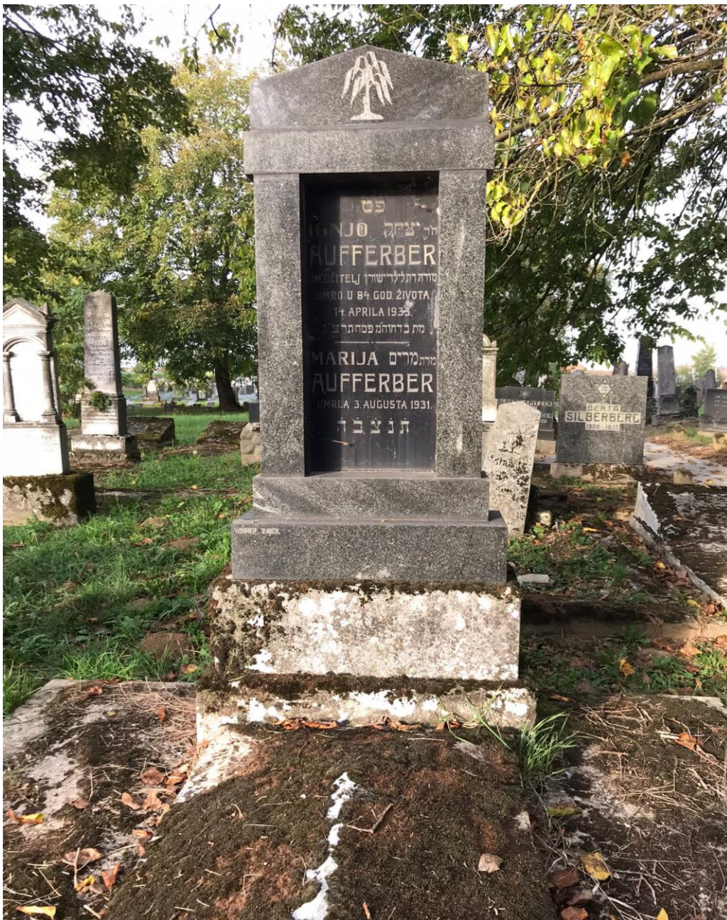
Slika 12. Granitni spomenik oslonjen na betonsku bazu, s bočnih strana omeđen stupovima koji pridržavaju arhitrav sa zabatnim završetkom ukrašenim judaičkim simbolom žalosne vrbe (foto