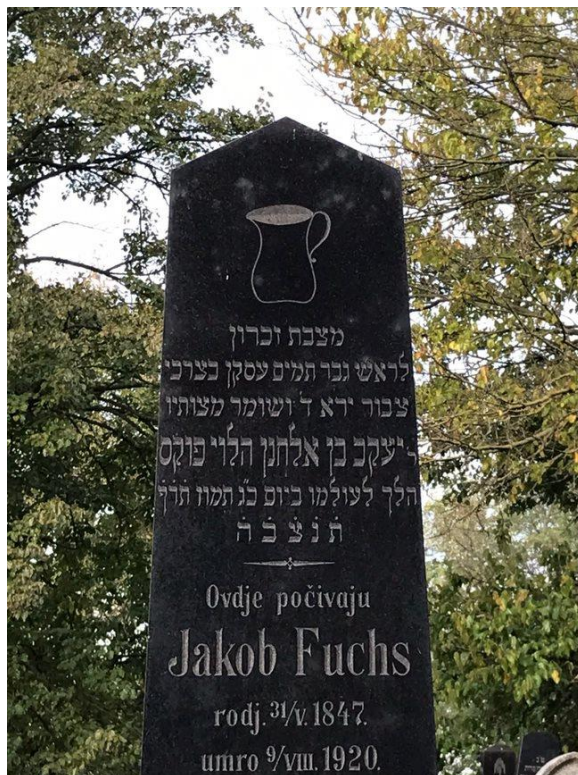
Slika 23. Motiv vrča, grobnica obitelji Fuchs (24. kolovoza, 2023.)