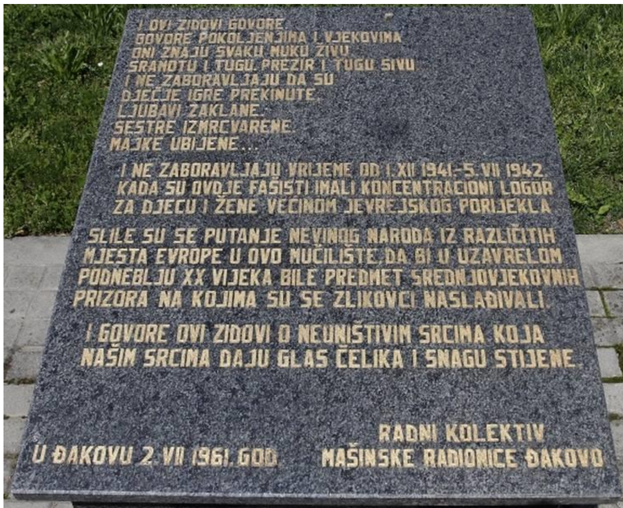
Slika 30. Spomen-ploča posvećena žrtvama fašističkog logora u današnjoj ulici Vladimira Nazora na broju 10 (24. kolovoza 2023.)