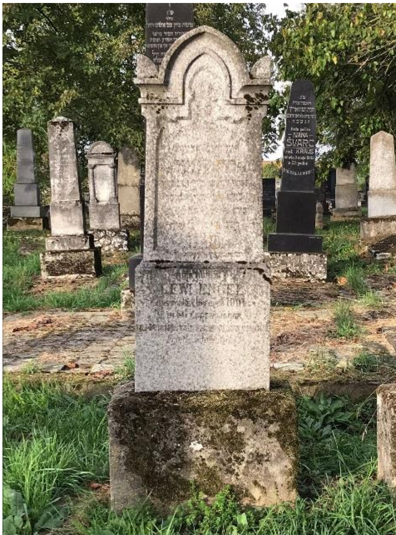
Slika 7. Primjer kamenog spomenika sa tankim polustupovima te zašiljenim lukovima i dekorativnim elementima s obje strane (foto Lorena Lelas, 24. kolovoza 2023.)