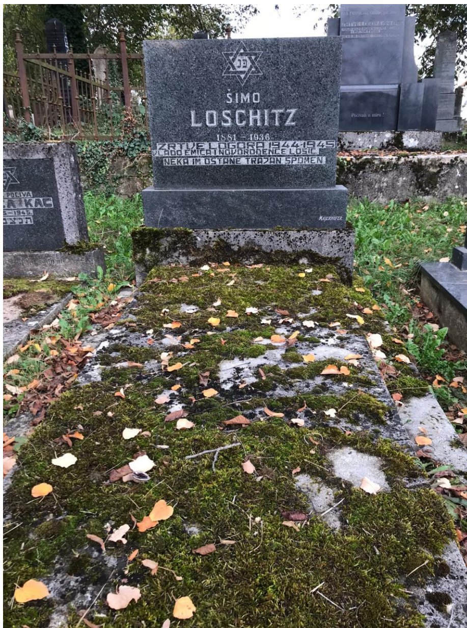
Slika 13. Najklasičniji tip nadgrobnog spomenika, kvadratna ili pravokutna ploča na visokoj bazi sa simbolom Davidove zvijezde (foto Lorena Lelas, 24. kolovoza 2023.)