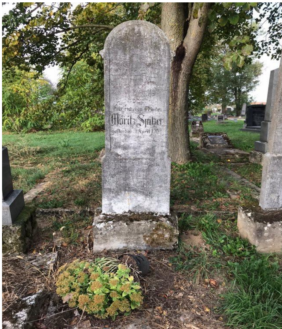
Slika 5. Primjer spomenika sa polukružnim završetkom ukrašenog tek tankom profilacijom uz rub spomenika (foto Lorena Lelas, 24. kolovoza 2023.)