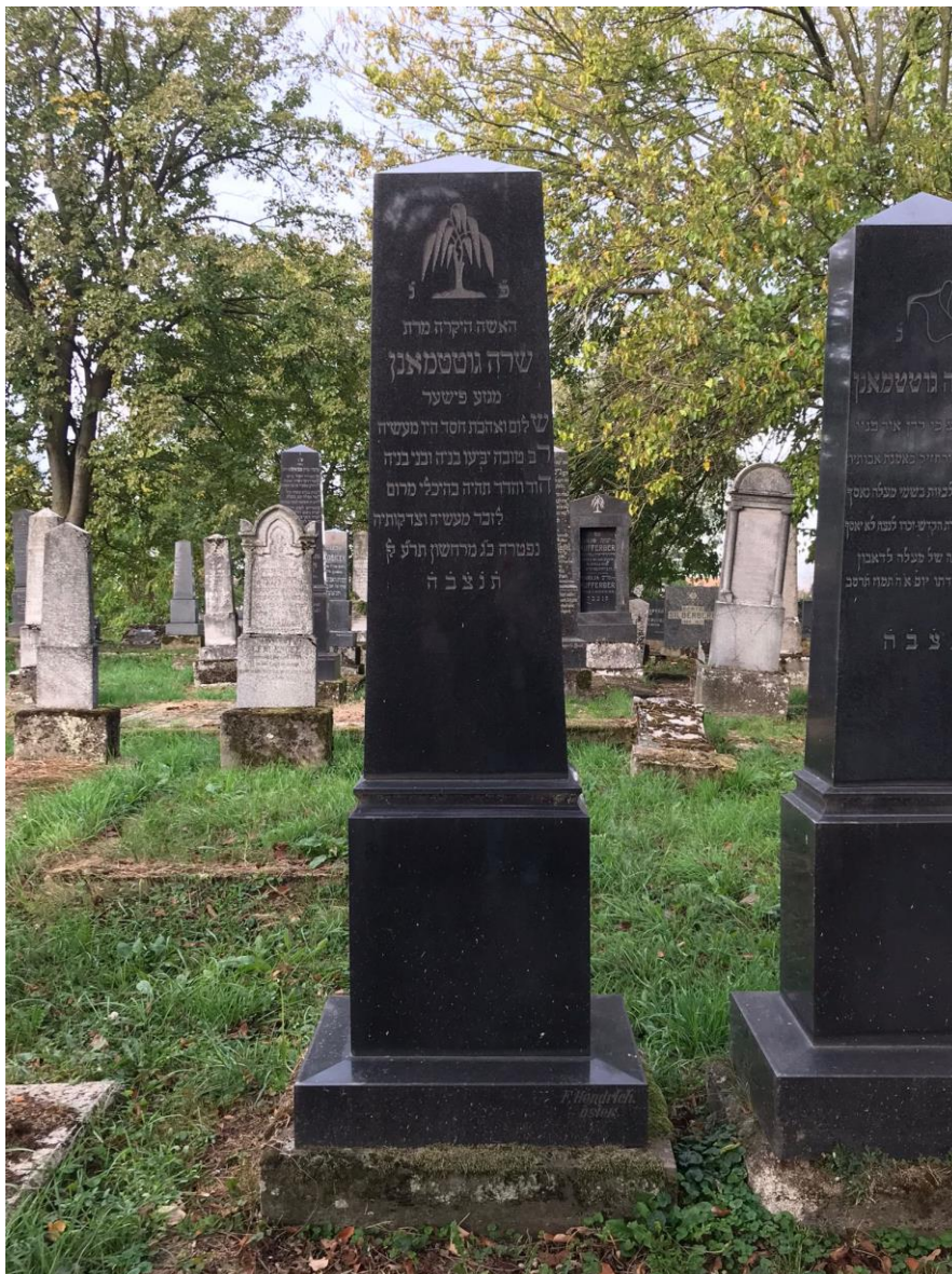
Slika 11. Primjer granitne grobnice koja je oblikom gotovo identična nekim kamenim primjerima (foto Lorena Lelas, 24. kolovoza 2023.)