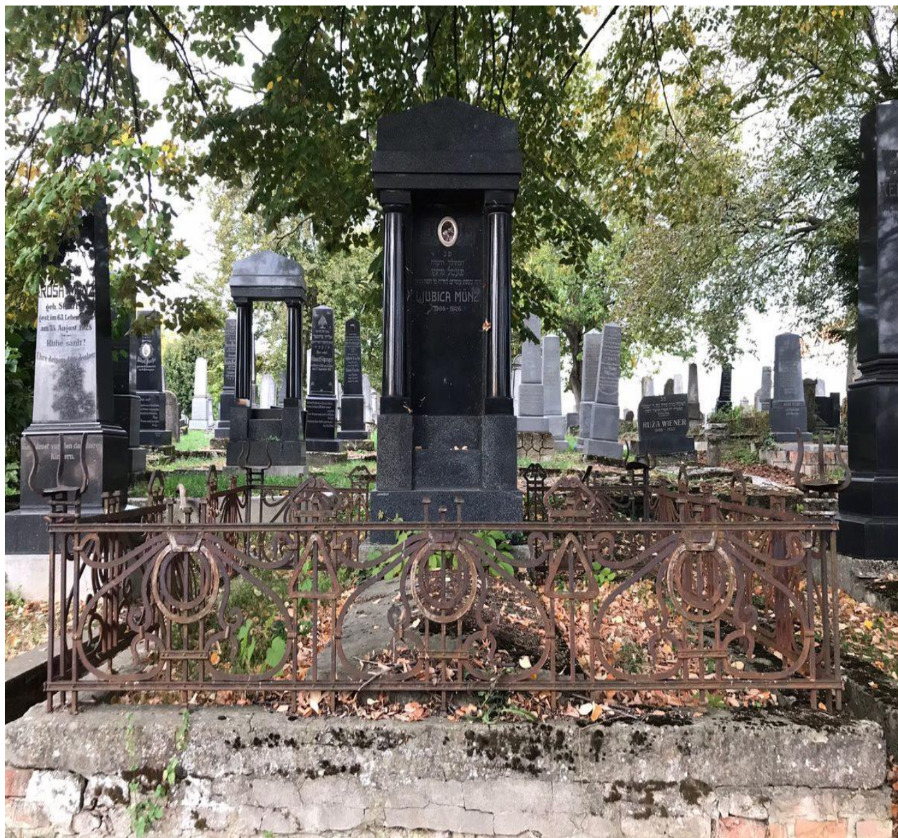
Slika 17. Grobnica Ljubice Münz