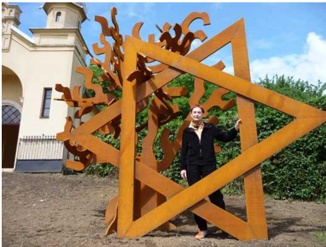
Slika 25. Izraelska umjetnica Dina Merhav ispred skulpture Peace in Heaven koju je poklonila gradu Đakovu