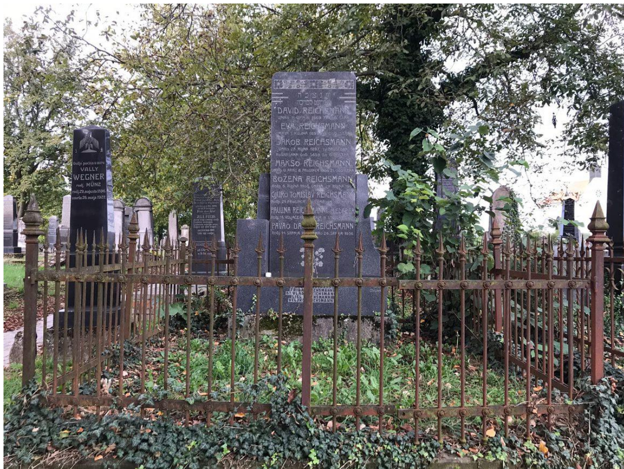
Slika 14. Grobnica obitelji Reichsmann (foto Lorena Lelas, 24. kolovoza 2023.)