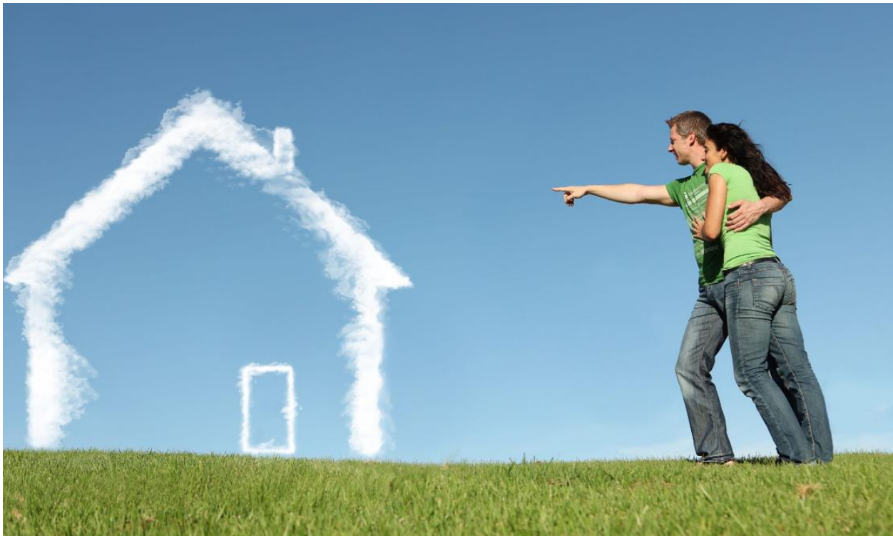
Slika 1: San o domu, <dostupno na: https://a1mortgage.com/what-are-the-benefits-of-having-a-mortgage/ >; [datum pristupa: 09. kolovoza, 2023.g.]

rejting, vjerujući da su stručnjaci u svojoj domeni. Kako bi dodatno ublažili potencijalne brige, investitori su čak mogli kupiti i osiguranje za ove vrijednosnice. Sve više su se pojavljivali financijski proizvodi čije su karakteristike bile sve kompleksnije i izazovnije za razumjeti (Zandi, 2010).