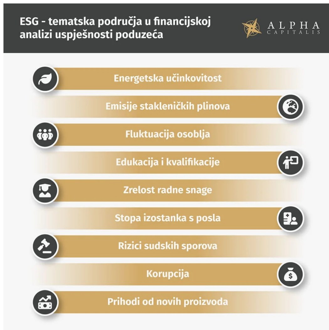
Slika 3 ESG u financijskoj analizi uspješnosti poduzeća

(Jovanović, 2022) (pristupljeno 10.09.2023.)