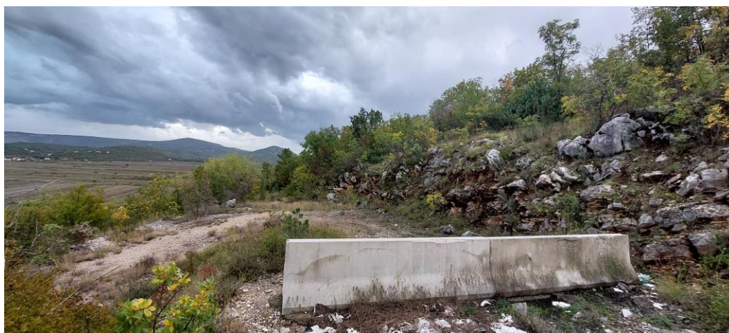
Slika 4. Kameni blok kao granična zapreka

„To isto više nema, jer ne ide se, niko ne smi ić, unda nit se obnavlja nit išta i to je već zaraslo, i trava i žbunje tako da nemoš ni proć, moraš ić di je prolaz i glavna rampa i to je to.“ 36