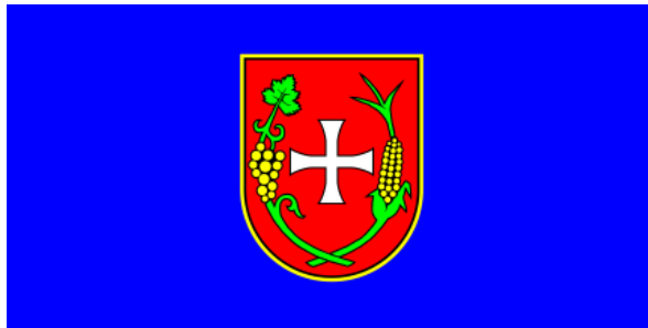
Slika 3. Zastava općine Runovići

Kontrola prekograničnih prijelaza na navedenim prijelaznim mjestima osnažila se nakon ulaska Hrvatske u Europsku uniju postavljanjem rampe čiji je prelazak omogućen jedino uz posjedovanje pogranične iskaznice, a prelazak granice u polju nužan je svim onim mještanima koji s druge strane granice posjeduju zemljišne posjede kako bi ih mogli obrađivati. Također, zbog odredbi Europske unije, malogranični prijelaz Drinovci – Sebišina unaprijeđen je izgradnjom nove građevine za nadzor prometa, dok su sva ostala mjesta koja nisu malogranični prijelazi niti su definirani prijelaznim mjestima stavljena pod kontrolu postavljanjem fizičkih zapreka kako bi se onemogućilo ilegalne prelaske preko granice.