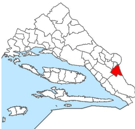
Slika 2. Položaj Runovića unutar Imotske krajine

kojemu se s jedne strane naslanja na Mračaj dok je s druge strane okrenuta prema Imotskom polju. (Strategija razvoja općine Runovići 2016. – 2021.: 6) Runovići kao mjesto koje graniči s Bosnom i Hercegovinom na sjeveroistočnoj strani pripada pograničnom području. (ibid.: 24) Nalazi se na jugoistočnom dijelu Imotske krajine te je formirano od mjesta Runović, Podosoja, Sebišine i Slivna, a zaseoci Runovića poredani su u nizu uz sami rub Imotskog polja kojim teče rijeka Vrljika. Ukupna dužina rijeke Vrljike iznosi 70 km, a u svome toku ona poprima 5 različitih imena. Protječući od sjeveroistočne strane Imotsko-bekijskog polja, Vrljika u Runovićima poprima naziv Matica, a u daljnjem protoku dolaskom u hercegovački dio Imotsko-bekijskog polja ona mijenja svoj naziv najprije u Tihaljinu te potom u Mladu i Trebižat. (ibid.: 75)