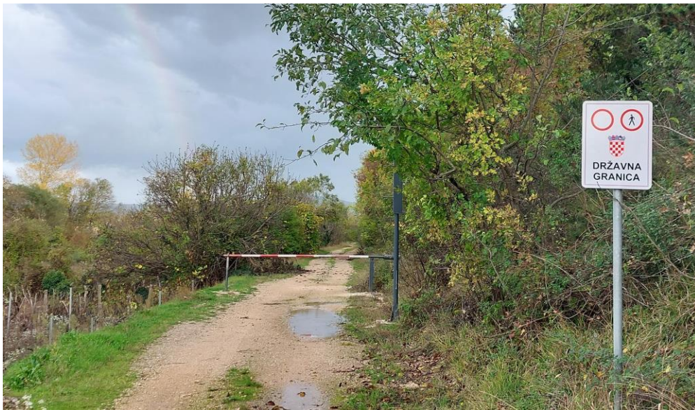
Slika 5. Granična rampa u polju

„A i kad je ovo došlo, da san ja stara od 80 godina morala napraviti sebi propusnicu, oditi u Grude i slikalo me i ima i sad ta legitimacija u mene. Pet godina, da mi je već izašla, i isto ne radin više moj vinograd, ostarila san, ali bez toga više nisan tadan mogla ić na polje, i unuk triba isto imat i sin, koji su me vozili na polje. Ključe je ko je vozila ima, on mora imat ključe. A ja nisan imala ključe jer ja nisan imala vozila.“ 39