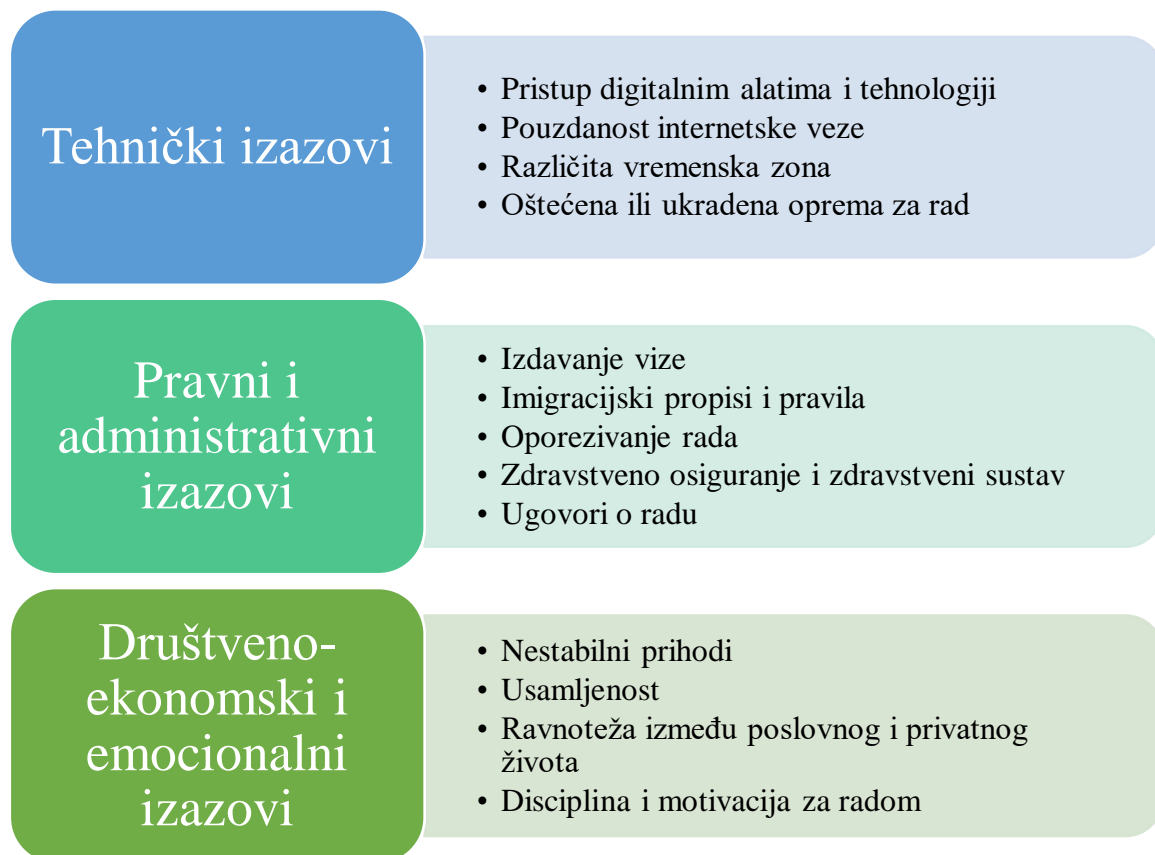
Slika 4. Izazovi digitalnog nomadstva