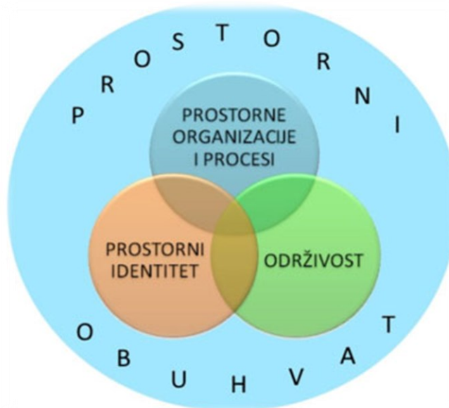
Slika 1. Koncepti u geografiji

Predmetni kurikulum geografije zasniva se na četirima konceptima koji obuhvaćaju i prirodoslovno i društveno-humanističko područje zbog interdisciplinarnosti same geografije. Koncepti predmeta Geografija su: Prostorni identitet, Održivost i Prostorne organizacije i procesi. Prostorni obuhvat. Posljednji koncept je integrativan i sastavni je dio triju prethodno navedenih koncepata, a isto se dobro može uvidjeti na Slici 1. ispod (URL13).