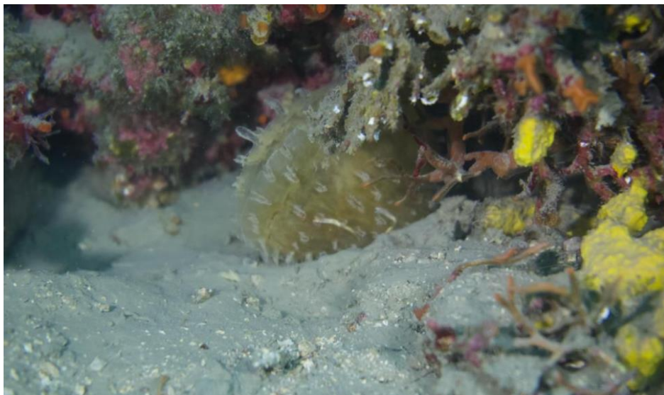
Slika 6. Novootkrivena periska kod Banjole

Morski.hr prenosi vijesti o pronalasku žive periske u moru kod Banjole na 17 metara dubine (URL 4).