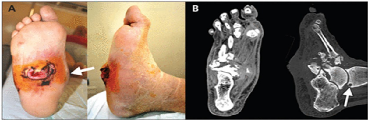
Slika 1. (A) Desno stopalo (plantarni i bočni pogled) 59-godišnjeg muškarca s dijabetičkom neuropatijom koja pokazuje kolaps unutarnjeg luka (strelica) i veliki neuropatski ulkus na srednjoj površini stopala. (B) Kompjuterizirane tomografske slike (dorzo-plantarni i lateralni prikazi) pacijentovog desnog stopala pokazuju subhondralnu cistu (strelica), fragmentaciju, dezorganizaciju i gubitak normalne arhitekture talusa, kalkaneusa, tarzalnih kostiju i baza metatarzalnih kostiju.

Preuzeto s: https://www.cmaj.ca/content/184/12/1392/tab-figures-data pristupljeno: 28.08.2023