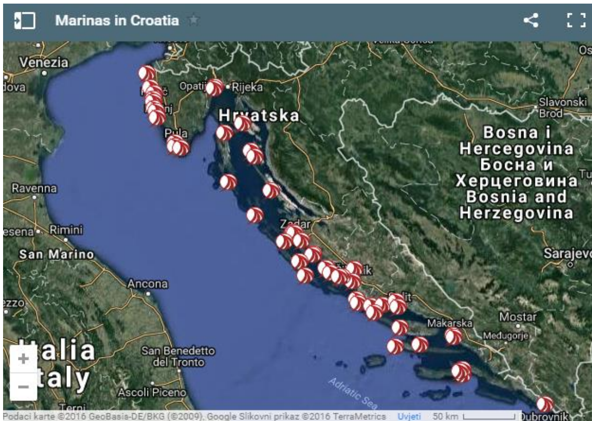
Slika 12. Marine na hrvatskoj obali