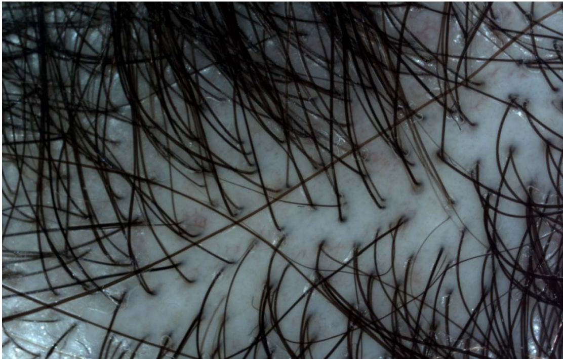
Slika 2B. Dermatoskopski je nalaz nespecifičan, iz većine folikula izlazi jedna dlaka, dlake su nejednolike debljine, vide se velusne dlake; novorastuće dlake imaju široku bazu i oštre su na distalnom dijelu.