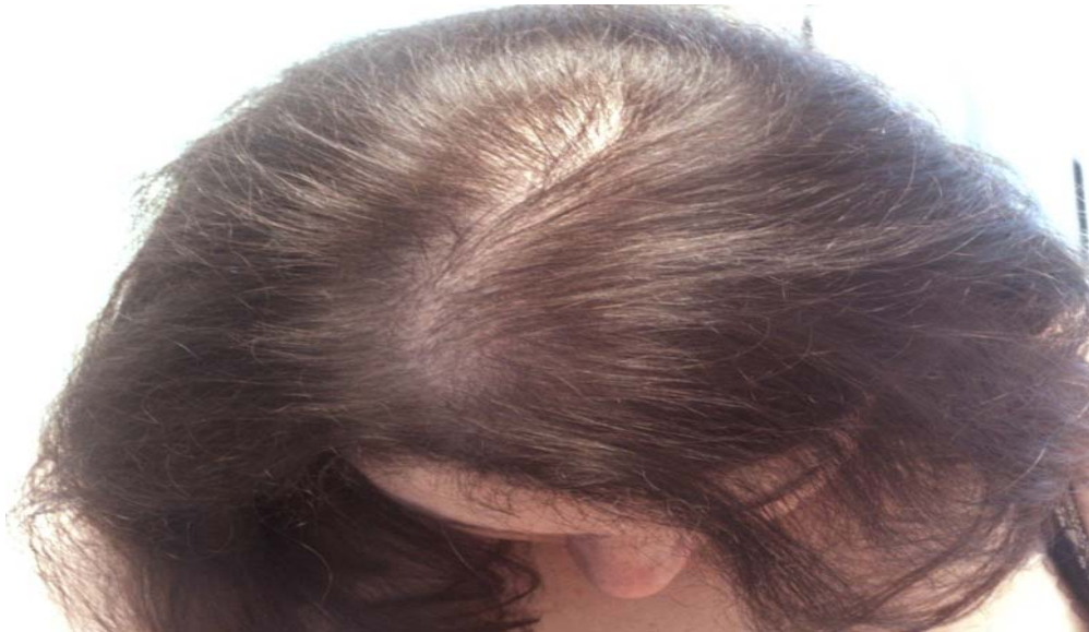
Slika 1A. Klinička slika: Androgena alopecija.