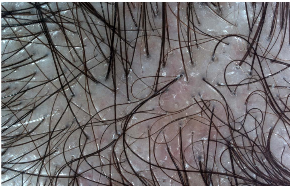
Slika 1B. Dermatoskopski se vidi anizotrihoza (različiti dijometri folikula), peripapilarna hiperpigmentacija, redukcija broja dlaka koji izlaze iz jednog folikula, žuti «dots» odnosno prazni folikuli ispunjeni sebumom.