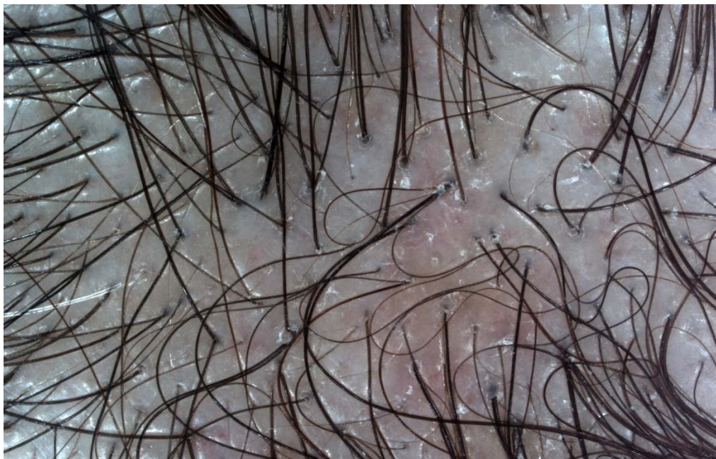
Slika 1B. Dermatoskopski se vidi anizotrihoza (različiti dijametri folikula), peripapilarna hiperpigmentacija, redukcija broja dlaka koji izlaze iz jednog folikula, žuti «dots» odnosno prazni folikuli ispunjeni sebumom. (Prof. Zrinjka Paštar, MD, PhD, specialist of dermatology and venereology. Dentaderm. )