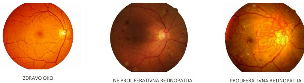
Slika 2. Zdravo oko i oblici dijabetičke retinopatije