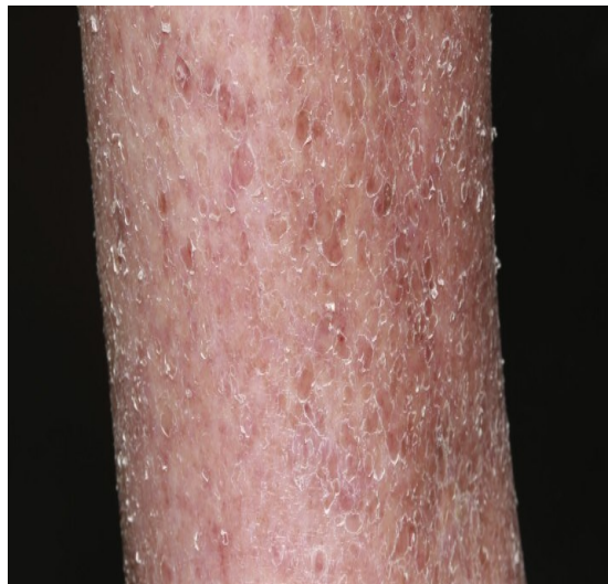
Slika 5. Xerosis cutis

Kseroza je vrlo čest kožni poremećaj u bolesnika s DM tipa 2. Kseroza je karakterizirana deskvamacijom, može zahvatiti bilo koje područje. Kako je kseroza povezana s povećanim transepidermalnim gubitkom vode, pojavljuje se oštećenje kožne barijere. Cilj liječenja je očuvanje funkcije barijere kože (37). Liječenjem kseroze mogu se smanjiti komplikacije na koži, kao što su pukotine, fisure i superinfekcije.