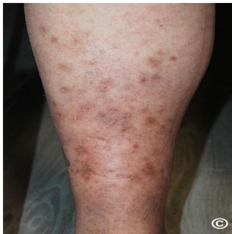
Slika 6. Dijabetička dermopatija

Dijabetička dermopatija (DD) se klinički manifestira kao asimptomatske crveno - smeđe hiperpigmentirane ili hipopigmentirane atrofične promjene velične oko 1.5cm, koje nastaju nakon neznatnih traumatskih ozljeda kože ili upala na koži. Promjene nestaju kroz 1 - 2 godine i prelaze u atrofične hipopigmentacije uz nastajanje novih (39).