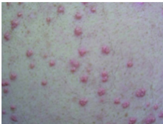
Slika 7. Eruptivni ksantomi

Dijagnoza se može postaviti klinički i potvrditi probatornom escizijom i patohistološkom analizom. Patohistološki se vide lipoproteini, prvenstveno kilomikroni u makrofazima. Hiperlipidemija dovodi i do lipemije retinalis. Ostali mogući simptomi hiperlipidemije su abdominalne boli, hepatosplenomegalija, pankreatitis, dispneja i rana koronarna arterijska bolesti(40). Liječenje bi trebalo biti usmjereno na smanjenje koncentracije triglicerida uz modifikaciju prehrane, regulaciju dijabetesa pri čemu dolazi i do regresije eruptivnih ksantoma.