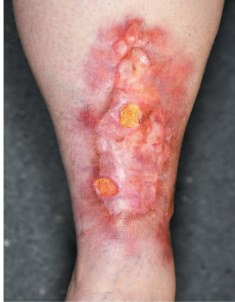
Slika 8. Necrobiosis lipoidica