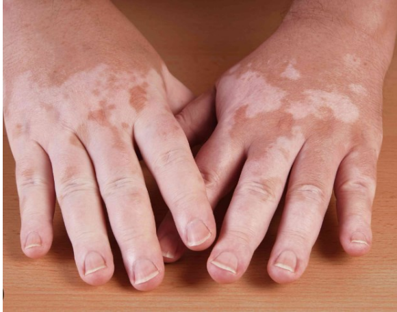
Slika 9. Vitiligo