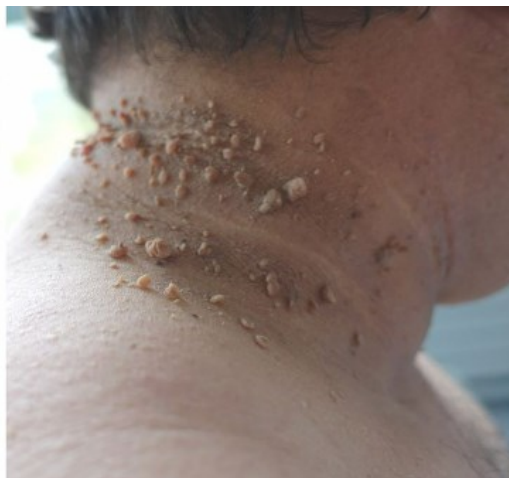
Slika 4. Acanthosis nigricans

AN su hiperpigmentirano i hiperkeratotičke papularne promjene – baršunaste površine kože, s predilekcijom u području vrata, aksile, ingvinuma i na ostalim pregibima kože kao što su kubitalna i infragarnaregija. Patohistološki, AN je papilomatoza, hiperkeratoza i akantoze. Liječenje se sastoji od liječenja temeljnog uzroka; gubitak težine ublažava kliničku sliku AN tip 2 i tip 3, a u terapije se koriste topički ili sistemski retinoidi (30).