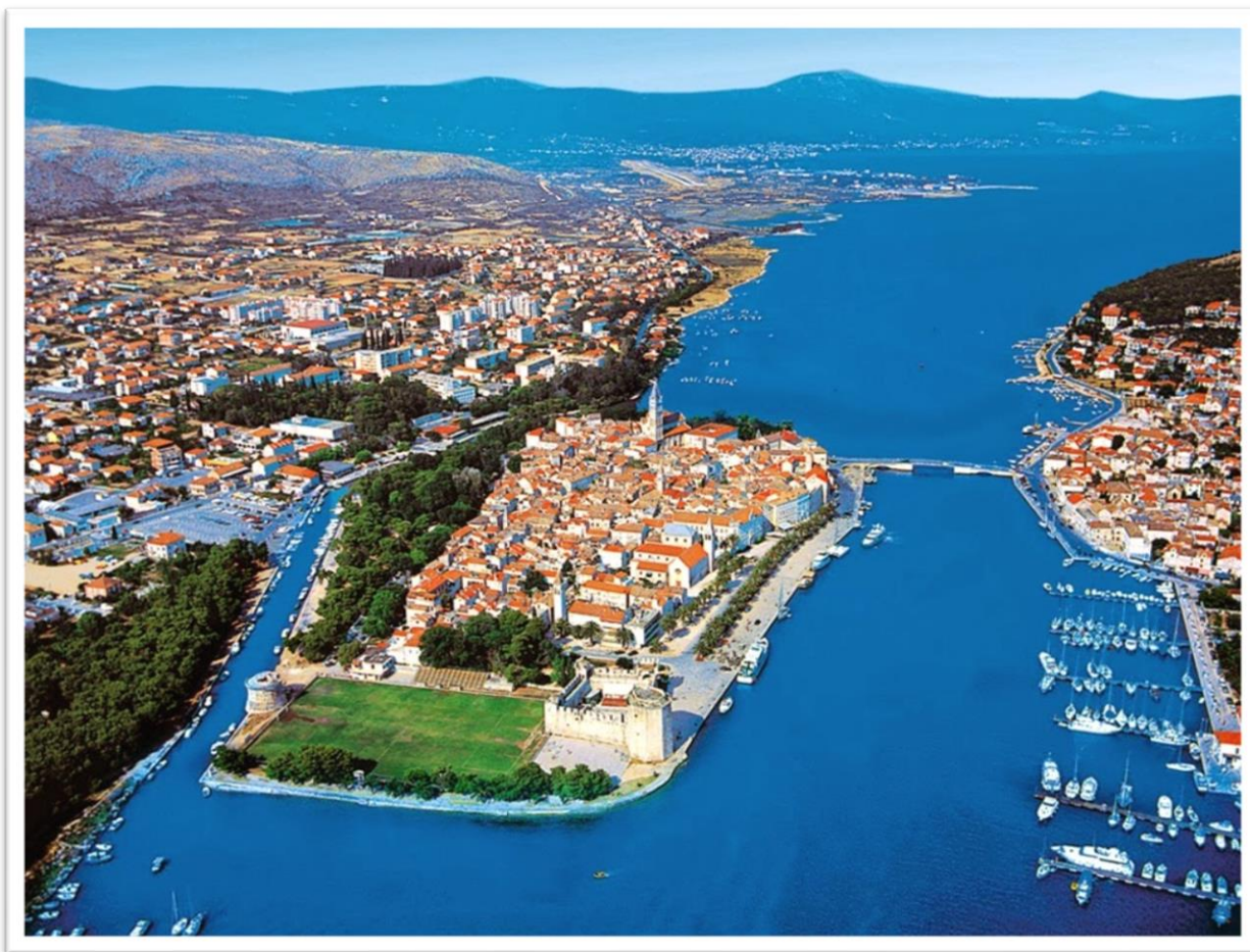
Izvor 13 : Moja Hrvatska: Trogir, 2013