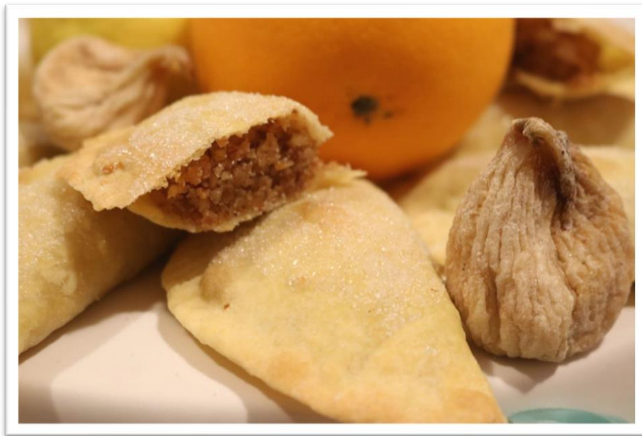
Izvor 15: croatiantraveljournal.com