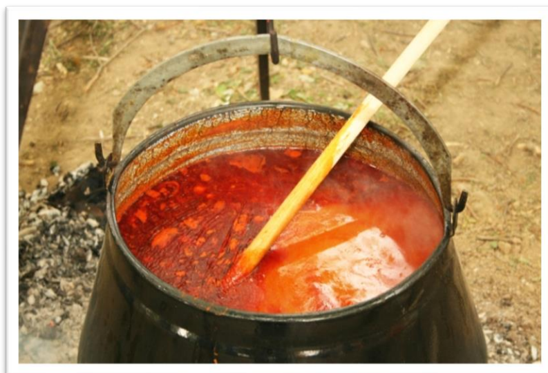
Izvor 4: Okusi zlatne Slavonije