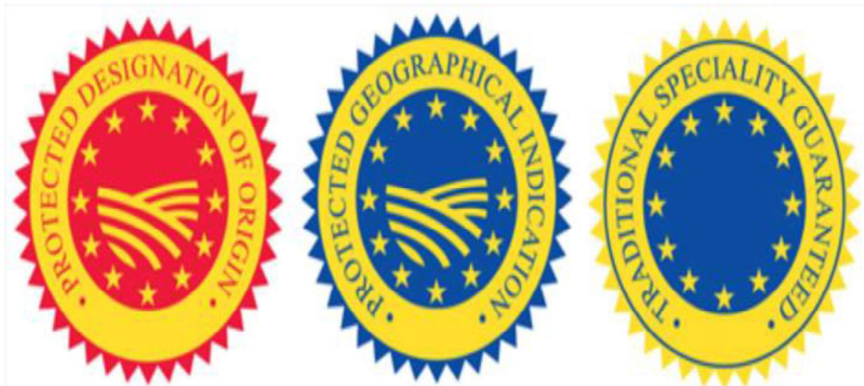
Slika 3: "Oznaka izvornosti, oznaka zemljopisnog podrijetla i oznaka zajamčenog tradicionalnog specijaliteta poljoprivrednih i prehrambenih proizvoda"