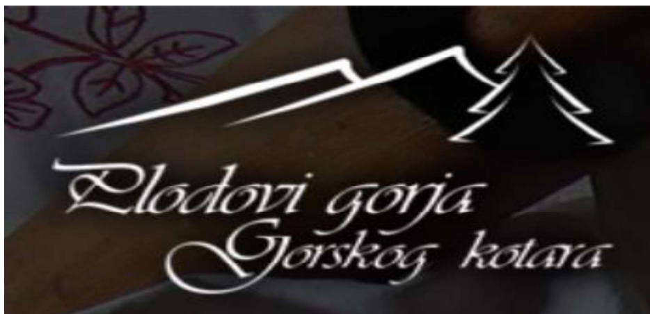
Slika 2: Logo Udruge Plodovi gorja

Udruga organizira brojne manifestacije pod zajedničkim nazivom Plodovi gorja koje se odvijaju u prirodi od travnja do studenoga, a imaju rekarativno-edukativni karakter s koncentracijom na domaću gastro ponudu i kušanje delicija plodova iz šume. Ovakve manifestacije idealna su prilika za promociju i upoznavanje ponude goranskih proizvođača domaćih proizvoda. Odvijaju se na lokacijama diljem Gorskoga kotara s misijom spajanja tradicionalne poljoprivrede, prirodnih vrijednosti i kulturne baštine. Organiziraju se Dani ljekovitog bilja, bazge, borovnica, šljiva, jabuka, krušaka, gljiva, šipka, bundeva i drugo. Program se sastoji od upoznavanja proizvođača, staništa ljekovitoga bilja i šumskih plodova, obilaska starih voćnjaka ili nasada, predavanja te naravno degustacije proizvoda. (Plodovi Gorja, 2014)