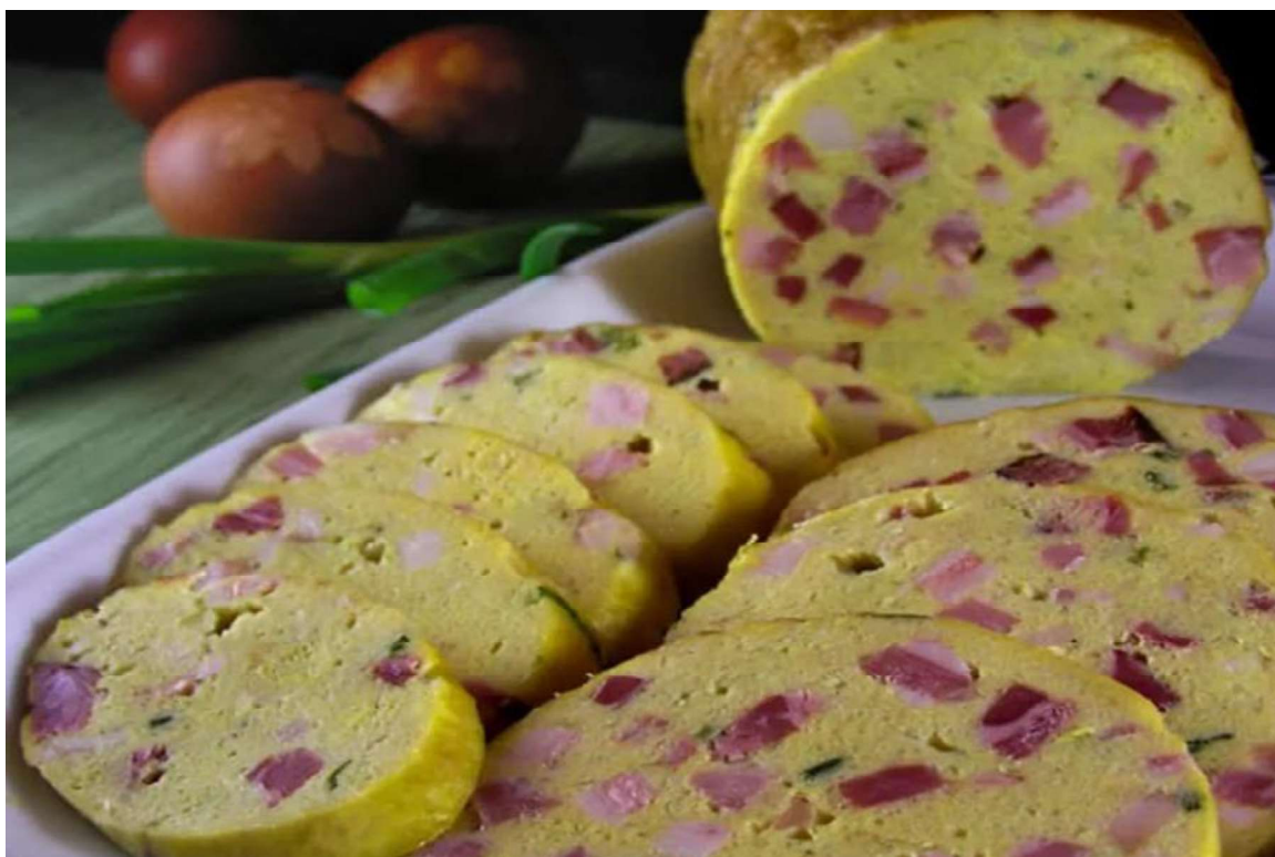
Slika 6: Nadjev