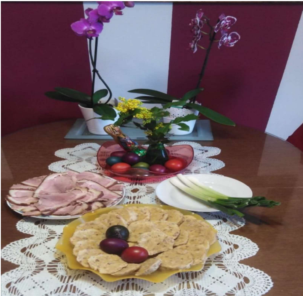
Slika 8: Uskršnji doručak