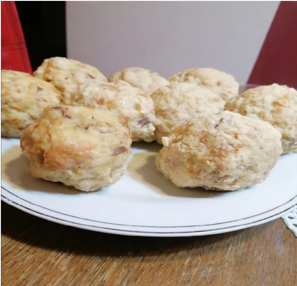
Slika 7: Hрге

U Lukovskom kraju pripremaju se hrge. Smjesa je slična gore navedenoj, ali se ne koristi crijevo za punjenje. Sui kruh nareže se na kockice te se pomiješa s umućenim jajima. Pravilo je da za jednu hrgu treba jedno jaje, odnosno stavlja se onoliko jaja koliko želimo hrga. Špek se poprži na masti i dodaje se u smjesu s kruhom i jajima. Smjesa ne smije biti ni presuha ni premekana. Ako je presuha, dodaje se još jaja, a ako je premekana, dodaje se još kruha. Začini se po želji, uglavnom samo s paprom jer je smjesa već dovoljno slana od špeka. Tada se oblikuju veće kuglice i stavljaju se kuhati nekoliko minuta u zasoljenu vodu ili još bolje, vodu u kojoj se kuhala šunka.