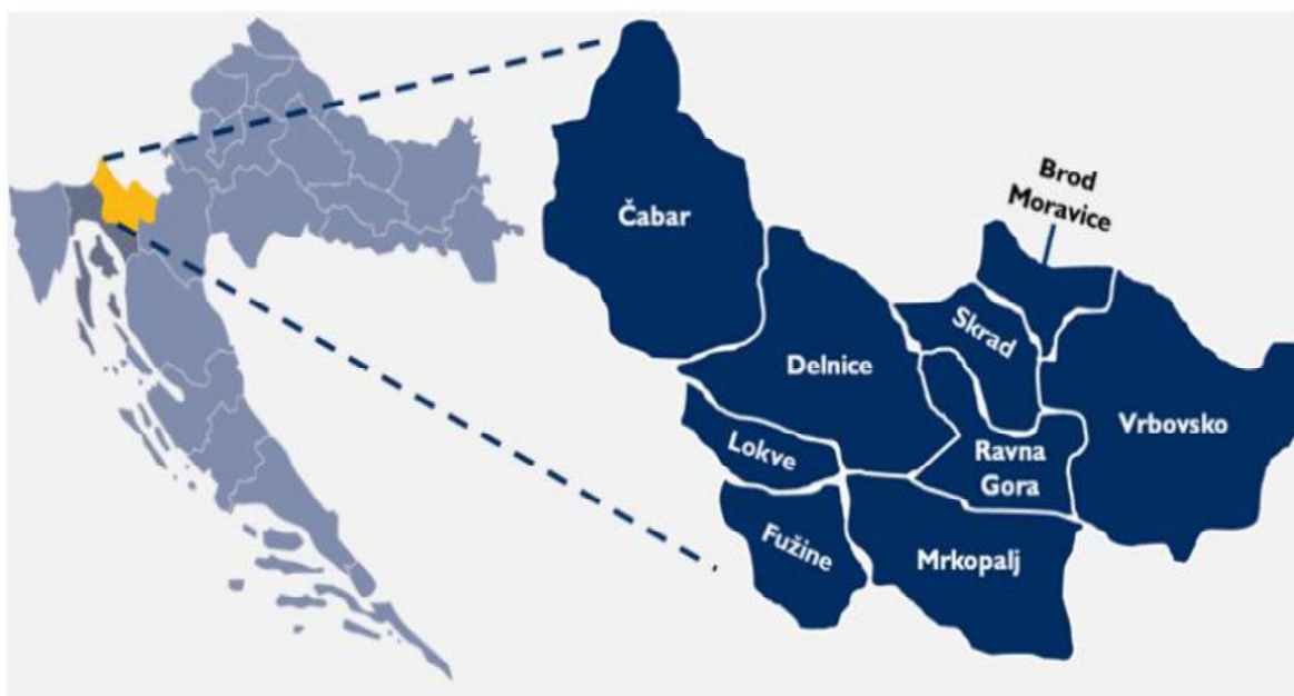
Slika 1: Teritorij Gorskog kotara i jedinice lokalne samouprave