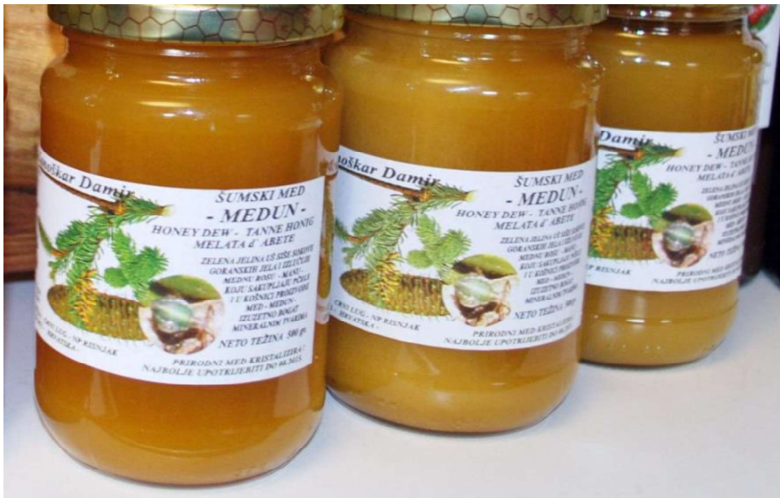
Slika 4: Goranski medun