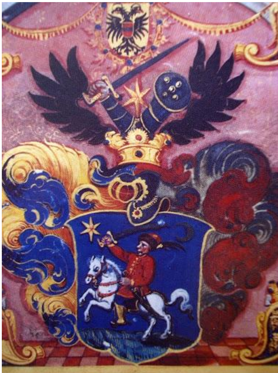
Slika 1. Plemički grb obitelji Vitezović

Leopolda. Neki su ga sumnjičili da je otišao raditi u Beč kako bi naudio hrvatskom kraljevstvu. S obzirom na pojačani pritisak, posao je uspješno obavio. 34