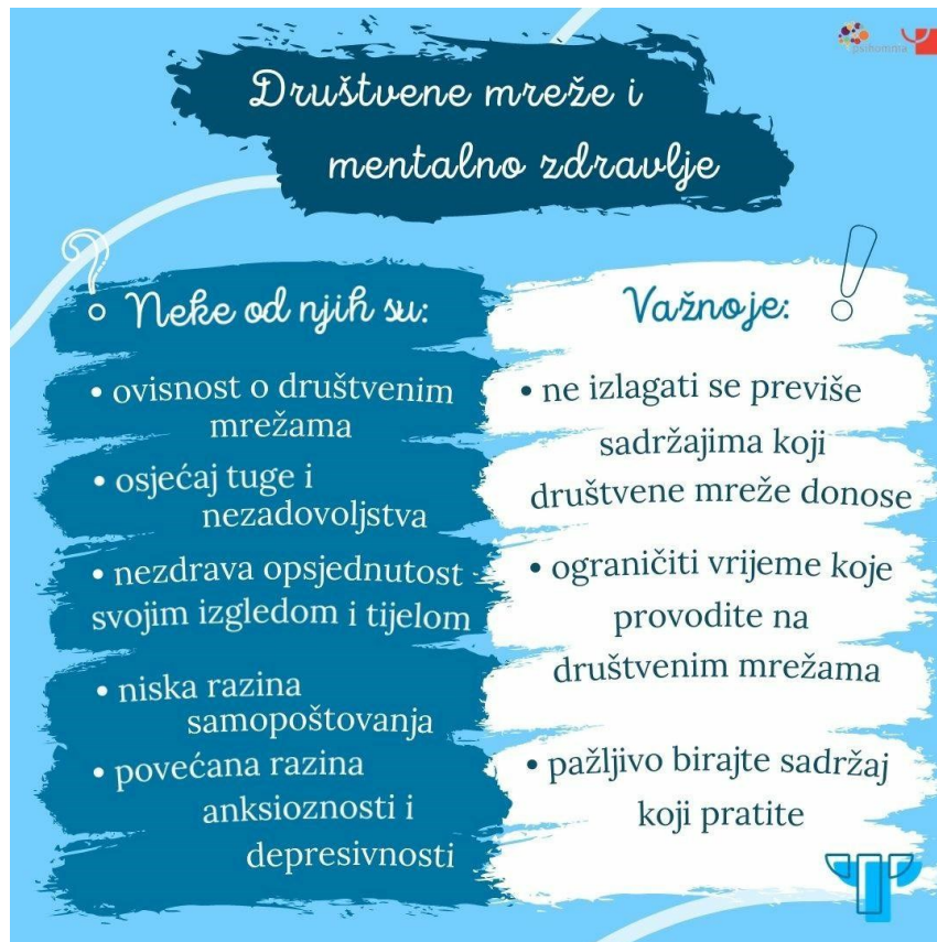
Slika 2. Društvene mreže i mentalno zdravlje

internetskog zlostavljanja, smatrajući ga smiješnim i zabavnim, nesvjesni negativnog utjecaja na žrtvu (14).