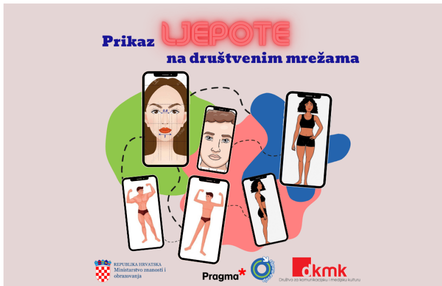
Slika 3. Prikaz ljepote na društvenim mrežama