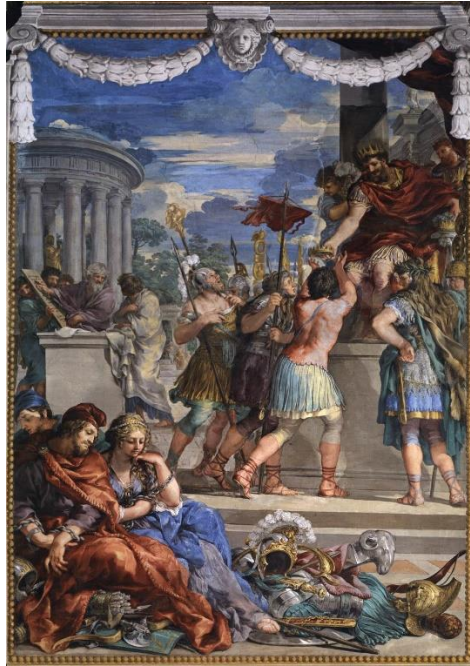
Slika 5. Brončano doba (Sala della Stufa), 1641., palača Pitti, Firenca