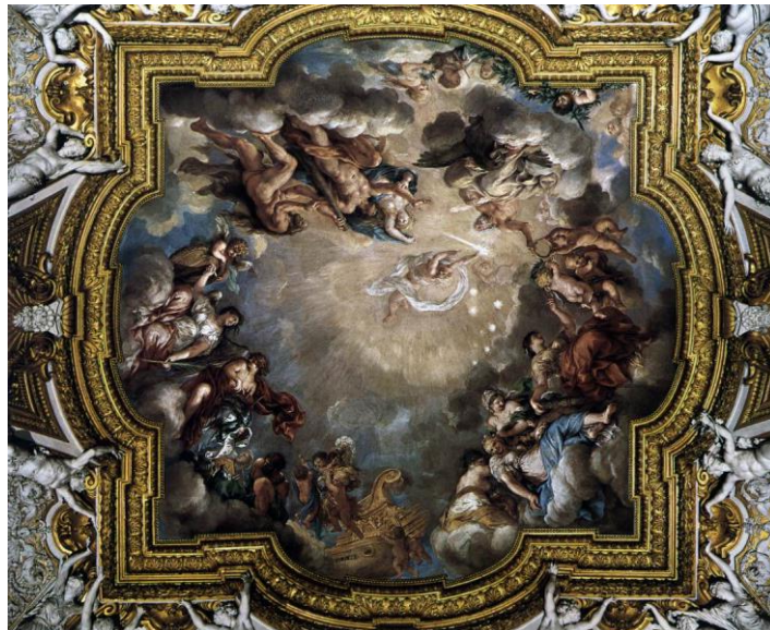
Slika 10. Sala di Giove, 1643-44., palača Pitti, Firenca