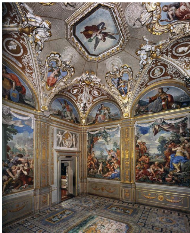
Slika 2. Sala della Stufa, 1637.-1641., palača Pitti, Firenca