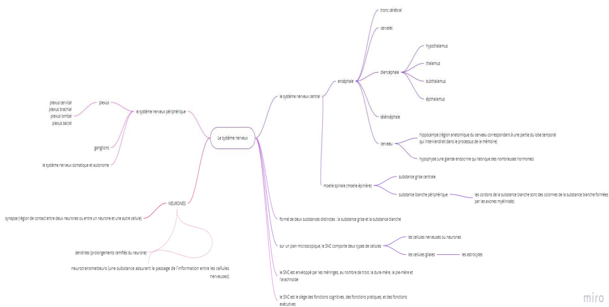
Image 3 L'arbre terminologique