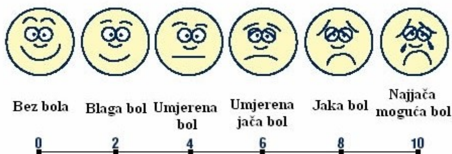
Slika2. Skala za procjenu boli