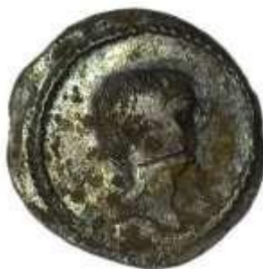
Slika 2 Republikanski denar, 42. god. pr. Kr., Arheološki muzej Istre, Pula