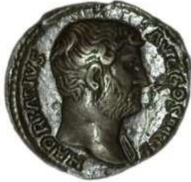
Slika 9 Novac s prikazom Hadrijana, 136. godina, Arheološki muzej Istre, Pula