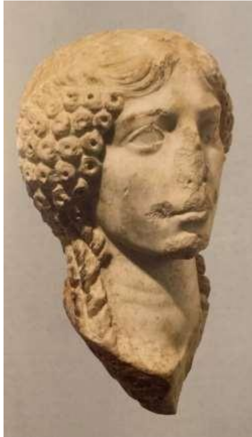
Slika 5 Portret žene, Pula, sredina 1. st., Arheološki muzej Istre, Pula