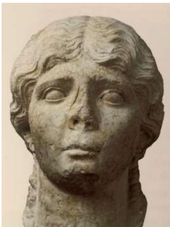
Slika 3 Glava žene, prva polovica 1. st., Arheološki muzej Istre, Pula