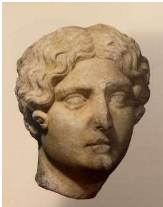
Slika 6 Portret nepoznate žene, Flanona, sredina 2. st., Zavičajni muzej Poreštine, Poreč