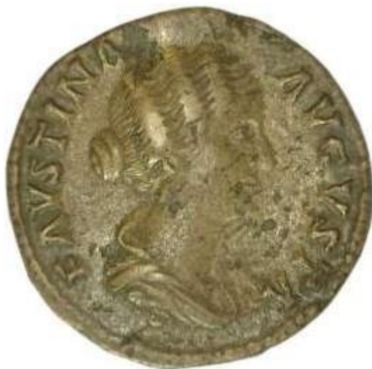
Slika 7 Novac s prikazom Faustine Minor, 161.-176. godina, Arheološki muzej Istre, Pula