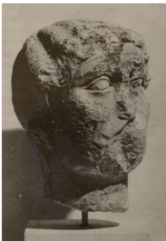
Slika 4 Glava žene pronađena u Ližnjanu, prva polovica 1. st, Arheološki muzej Istre, Pula