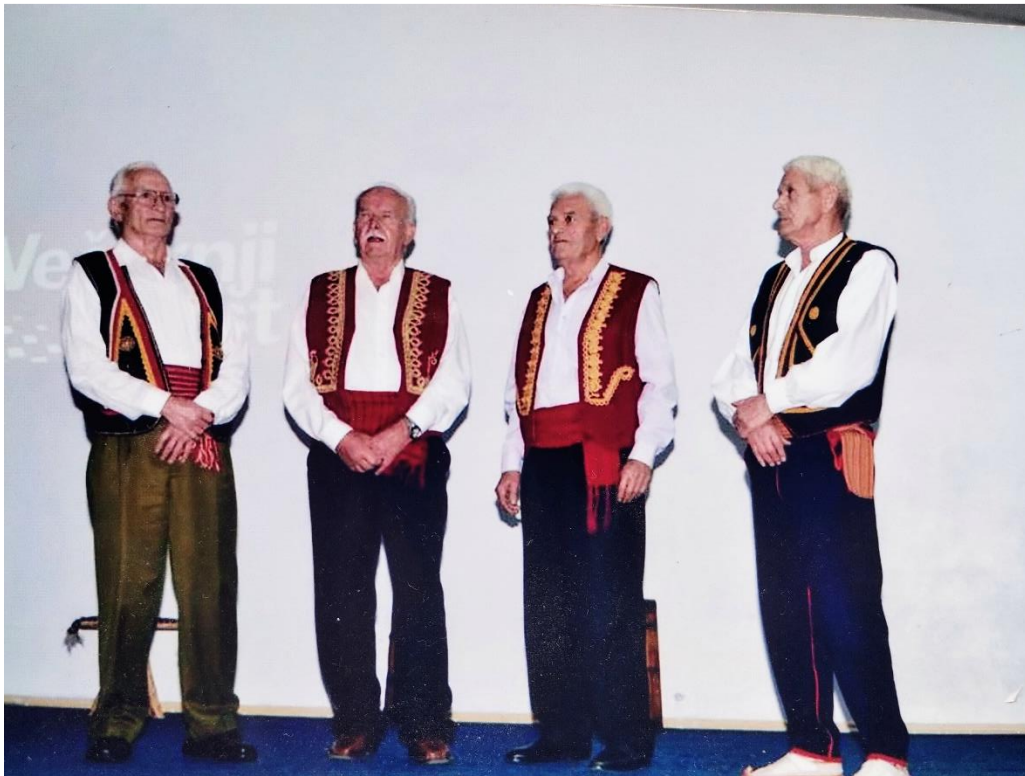
Slika 3.: Grudski gangaši