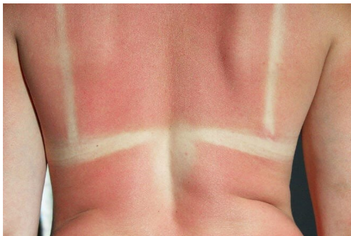
Slika 4 Opekline prvog stupnja