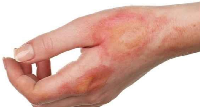
Slika 2 Opeklina ruke