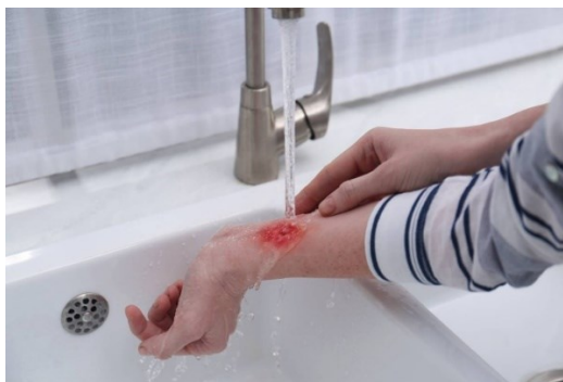
Slika 5 Hlađenje opeklina

Ozlijeđenog je potrebno maknuti s mjesta izvora topline te ugasiti vatru (5). Primarni pregled uključuje standardiziranu procjenu dišnih puteva, disanja, ventilacije, cirkulacije, srčanog statusa, invaliditeta, neurološkog deficita, deformiteta i stupnja izloženosti (zahtjeva potpuno skidanje odjeće kako bi se omogućila identifikacija povezanih ozljeda). Kako bi se izbjegla hipotermija, osobito u djece i starijih osoba, ova procjena se mora provesti uz održavanje toplog okruženja (11). Po potrebi se daje umjetno disanje usta na usta ili uz pomoć maske. Ako postoji mogućnost, opeklinu treba hladiti vodom kako bi se smanjila bol i toplina te se smanjila temperatura ozlijeđene površine (5).