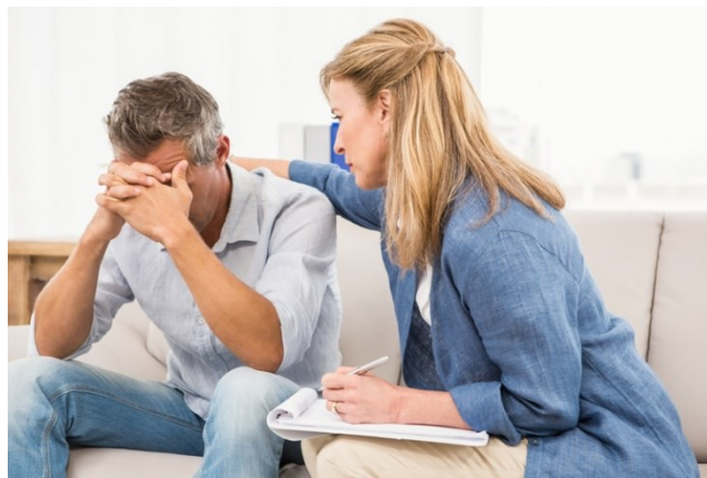
Slika 7 Psihoterapija

spriječiti heterotopičnu osifikaciju (stvaranje kosti unutar tkiva gdje se kost ne bi trebala formirati) i poboljšati funkciju mišića i tetiva. Dodatno, hipermetabolički odgovor može se smanjiti vježbanjem. Stoga je preporučljivo započeti s terapijom i vježbama čim je to moguće te krenuti s mobilizacijom odmah nakon prijema (11). Važno je upamtiti da su pacijenti s opeklinama doživjeli zastrašujući događaj te da im je i samo bolničko iskustvo zastrašujuće. Važno je pružiti pacijentu osjećaj sigurnosti i utjehe. Uzimanje trenutka da se pažljivo sasluša pacijenta, iskazivanje iskrene empatije i razumijevanja, davanje relevantnih informacija i rješavanje njihovih nedoumica može biti ključno za smanjenje njihove tjeskobe. To, pak, može pozitivno utjecati na njihov put oporavka(13). Pacijent tokom bolničkog liječenja može imati nekoliko psihičkih problema kao što su anksioznost, česte promjene raspoloženja, depresija, nesаница te pojava suicidalnih misli. Često je potrebna medikamentozna terapija u obliku antidepresiva te psihoterapija (3).