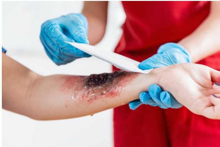
Slika 6 Previjanje opekline