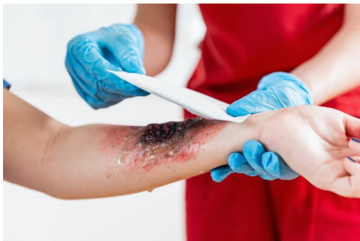
Slika 6 Previjanje opekline