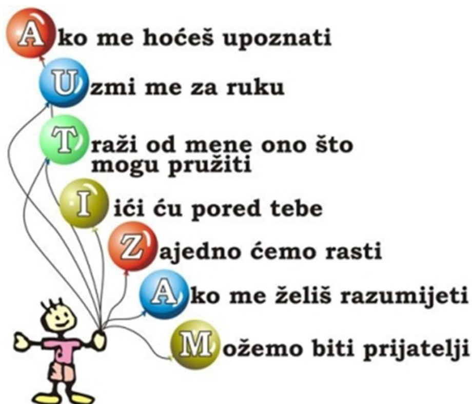
Slika 2. Primjer slikovnog tumačenja značenja pojma „autizam“ (1)

Osoba s autizmom stvara autističnu obitelj koja je izolirana i „zatvorena“ zbog brige oko djeteta, ali i nemogućnosti da se dijete ponaša primjereno u drugim sredinama. Autizam je po tome jedan od najvećih hendikepa (5).