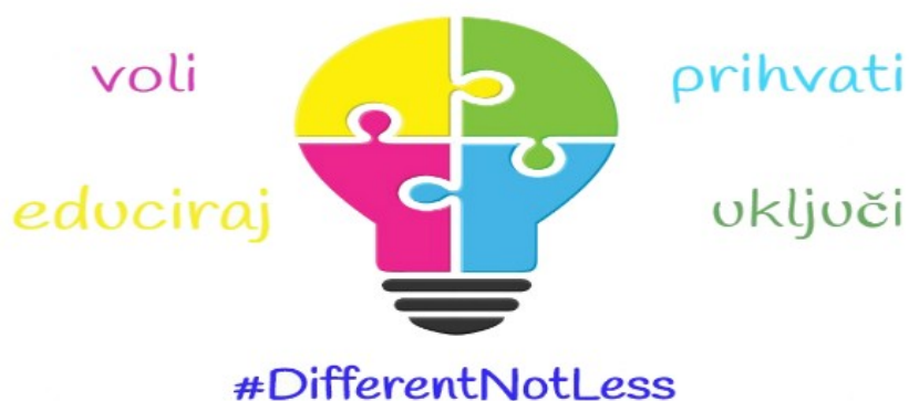
Slika 1. Logo Udruge Autizam – Jednaki u različitosti (2)