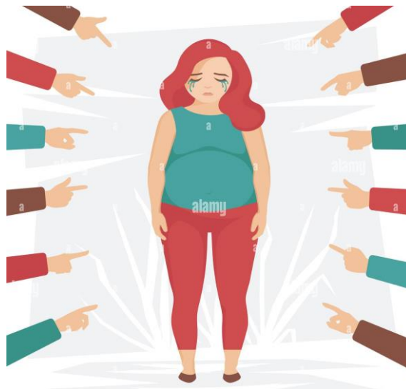
Slika 3. Jedan od uzroka bulimije – rujanje iz okoline

Mnogi istraživači smatraju kako poremećaj bulimije nastaje kombinacijom genetike i naučenog ponašanja. Primjer toga je ukoliko netko iz porodice ima ili je imao takav poremećaj, veća je vjerojatnost da dijete prisvoji takvo ponašanje te sve to preraste u poremećaj prehrane. Također se smatra da su kultura, mediji i društvo jedan od glavnih uzroka nastanka bulimije. Takvi vanjski utjecaji mogu narušiti vlastitu sliku o samom sebi, kao i dovesti do niskog samopoštovanja (slika 3). Uz sve to stres, uzrujanost, gubitak kontrole, gubitak voljene osobe i drugo, može dovesti do poremećaja bulimije (8,23).