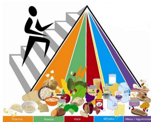
Slika 4. Piramida zdrave prehrane

Pacijentima koji pate od poremećaja prehrane važno je pružiti obrazovnu podršku o osnovama zdravog prehranbenog režima. Ovime se želi naglasiti da konzumacija hrane ne dovodi nužno do dobivanja na težini. Na slici 4 je prikazana piramida zdrave prehrane koja nudi smjernice o optimalnim proporcijama različitih skupina namirnica te istovremeno ističe važnost redovite tjelesne aktivnosti u održavanju zdrave tjelesne mase.