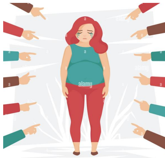
Slika 3. Jedan od uzroka bulimije – rujanje iz okoline

Mnogi istraživači smatraju kako poremećaj bulimije nastaje kombinacijom genetike i naučenog ponašanja. Primjer toga je ukoliko netko iz porodice ima ili je imao takav poremećaj, veća je vjerojatnost da dijete prisvoji takvo ponašanje te sve to preraste u poremećaj prehrane. Također se smatra da su kultura, mediji i društvo jedan od glavnih uzroka nastanka bulimije. Takvi vanjski utjecaji mogu narušiti vlastitu sliku o samom sebi, kao i dovesti do niskog samopoštovanja (slika 3). Uz sve to stres, uzrujanost, gubitak kontrole, gubitak voljene osobe i drugo, može dovesti do poremećaja bulimije (8,23).