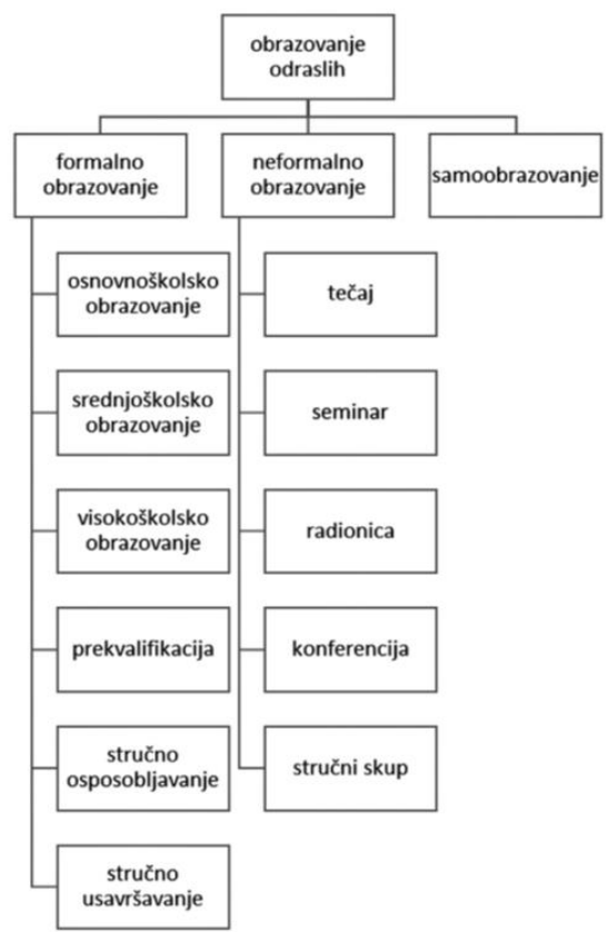
Slika 1. Obrazovanje odraslih (Vekić, 2018)

Vekić (2018) prema ovoj hijerarhiji prikazuje cjeloživotno obrazovanje kojeg u literaturi izjednačava s obrazovanjem odraslih. Obrazovanje je podijeljeno na formalno i neformalno obrazovanje te na samoobrazovanje. Vekić (2018) ne koristi engleski izraz informalno obrazovanje, već hrvatski prijevod samoobrazovanje.