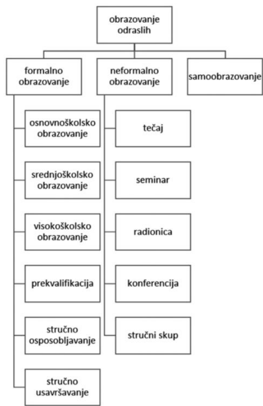
Slika 1. Obrazovanje odraslih (Vekić, 2018)

Vekić (2018) prema ovoj hijerarhiji prikazuje cjeloživotno obrazovanje kojeg u literaturi izjednačava s obrazovanjem odraslih. Obrazovanje je podijeljeno na formalno i neformalno obrazovanje te na samoobrazovanje. Vekić (2018) ne koristi engleski izraz informalno obrazovanje, već hrvatski prijevod samoobrazovanje.