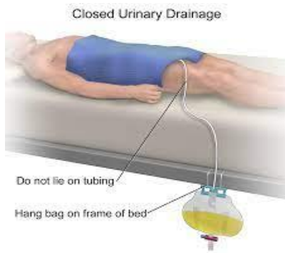
Slika 3 Ispravan položaj urinarne vrećice