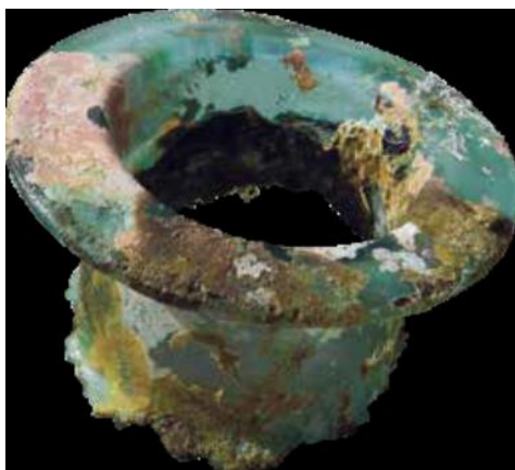
Slika 4. Ulomak oboda ollae (L. BEKIĆ, 2018, 14.)