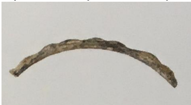
Slika 1. Ulomak narukvice (M. ILKIĆ, M. PARICA, 2009, 116.)