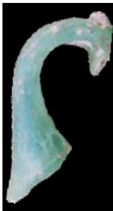
Slika 5. Ulomak ručkice ollae (L. BEKIĆ, 2018, 14.)