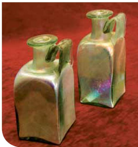
Slika 6. Četvrtaste boce (I. RADIĆ ROSSI, 2012, 26.)