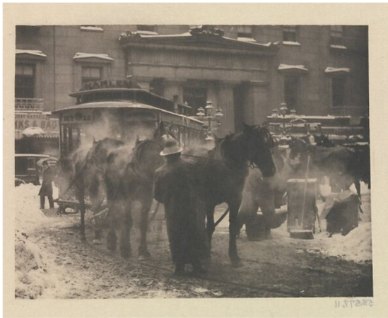
Slika 8. Alfred Stieglitz, Terminal , 1933., The Metropolitan Museum of Art, New York, (Izvor: https://www.metmuseum.org/art/collection/search/270032 )