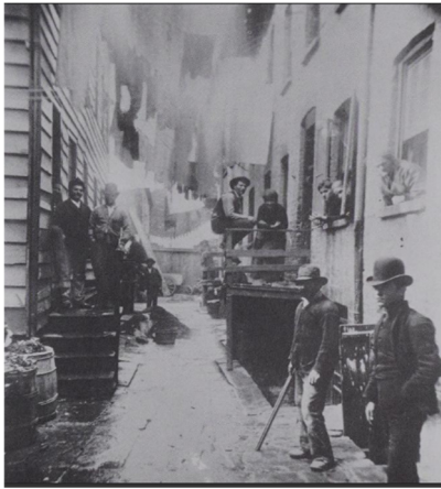
Slika 1. Jacob Riis, Bandit's Roots , 39 ½ Mulberry St., 1887., Museum of the City of New York, (izvor: M. STANGE, 1989., 9.)