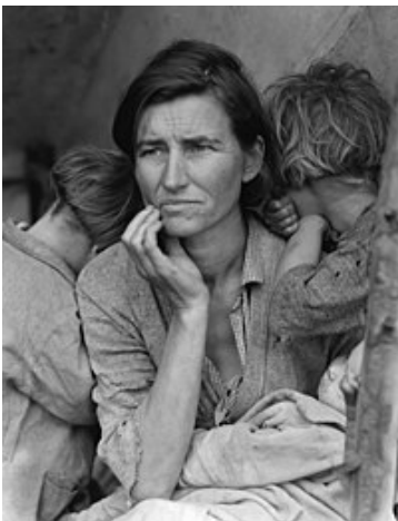
Slika 12. Dorothea Lange, Migrantska majka , 1936., Minneapolis Institute of Arts, (Izvor: https://www.kennedy-center.org/education/resources-for-educators/classroom-resources/media-and-interactives/media/media-arts/dorothea-lange-migrant--mother/ )