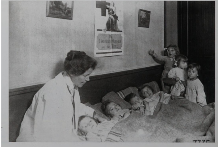
Slika 7. Lewis Hine, Najveća majka , 1918., International Museum of Photography at George Eastman House, New York, (izvor: D. KAPLAN, 1988., 62.)