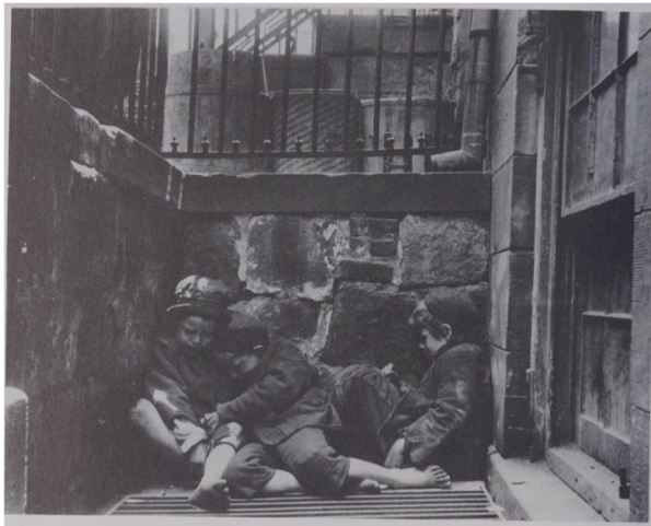
Slika 2. Jacob Riis, Street Arab sin Sleeping Quarters , 1880s., Museum of the City of New York, (izvor: M. STANGE, 1989., 20.)