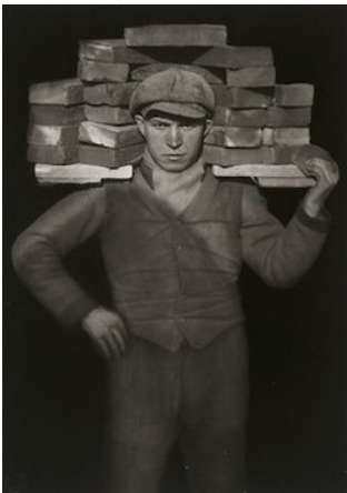
Slika 11. August Sander, Zidar , 1928., MoMa, New York, (Izvor: https://www.moma.org/collection/works/193778 )