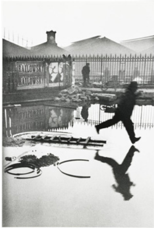
Slika 10. Henri CartierBresson, Iza stanice sv. Lazara , 1932, MoMa, New York, (izvor: https://www.moma.org/collection/works/98333 )