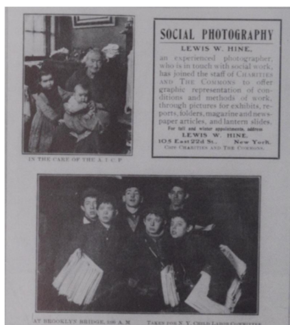
Slika 4. Lewis Hine, Oglas o socijalnoj fotografiji , reproducirano iz Charities and the Commons , 20 (06. lipnja, 1908.) stražnja naslovnica.