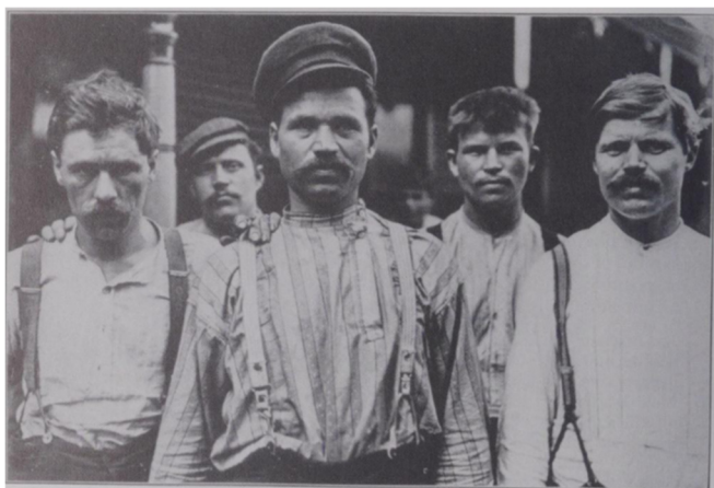
Slika 5. Lewis Hine, Slavenski radnici , 1907/8 (izvor: M. STANGE, 1989., 84)