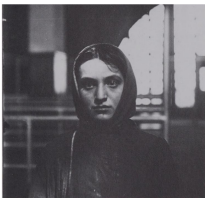
Slika 3. Lewis Hine, Mlada ruska Židovka na otoku Ellis , 1905., International Museum of Photography at George Eastman House, New York, (izvor: M. STANGE, 1989., 53.)