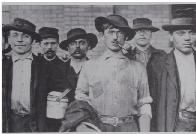
Slika 6. Lewis Hine, Radnici u čeličanama , 1907/8, (izvor: M. STANGE, 1989., 85)