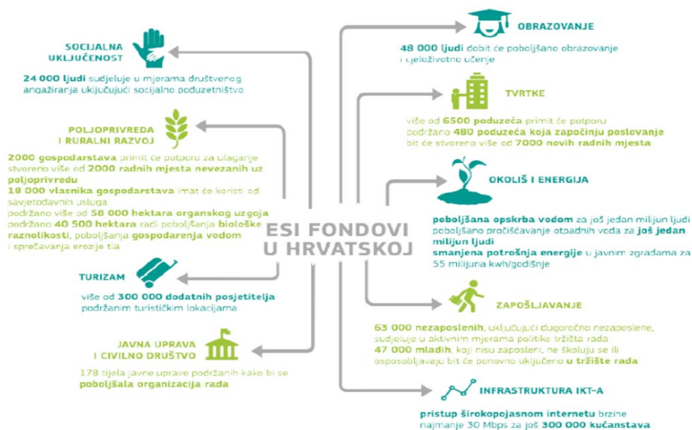
Slika 1 Cjelokupna slika gdje bi se Hrvatska trebala naći do 2020. godine

Slika 1 prikazuje očekivane ciljeve odnosno rezultate za koje je planirano da budu financirani iz sredstava za potporu hrvatskog društveno-gospodarskog razvoja, odnosno gdje bi se po pojedinim parametrima Republika Hrvatska trebala naći do 2020. godine.