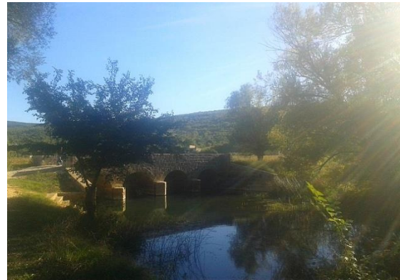
Slika 7. Bitangin most

Izvor: Osobna fotografija, snimljeno 23.9.2015