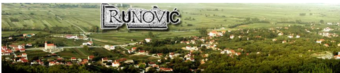
Slika 3. Runovići

O ovoj dvojbi piše i Šimundić koji navodi kako se do kraja 2. svjetskog rata pisalo Runovići , a administrativnim postupkom to se mijenja u Runović . On smatra kako ime Runovići dolazi od osobnog prezimena Runović koji je nastao od apelativa runo , pa pretpostavlja kako je motivacija za prezime povezana s mekoćom i bjelinom ovčje vune (Šimundić 1989: 494). O tome piše i Gudelj (2001), naglašavajući kako je ova analogija s runom novijeg postanka, ali da objedinjuje plemensko-porodično ime i ime sela.