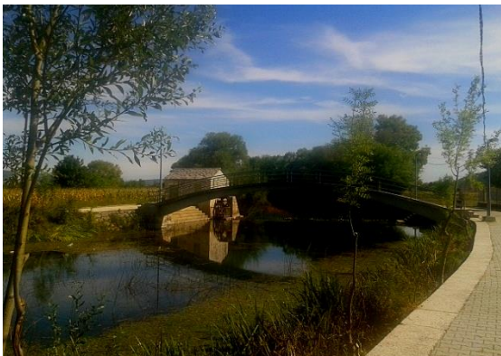
Slika 6. Most na Pojilu i mlinica u pozadini

a pokrov od cementa, a kako je to zapisao fra Silvestar Kutleša: „Ovi most učinijo je dosta laščine gornjim plemenima, ali dosta i šćete drugim jer su Babići stvorili put i progon priko tuđi zemalja, sve do Otoka“ (1993: 65). Bitangin most, Brvina , dobio je ime po glavaru Bitangi koji ga je načinio uz pomoć sela, ali ime vjerojatno potječe i od toga što su ljudi u početku brvnima, čime bi načinili uski prijelaz, vršili premošćivanje Matice. Ljubičića most vodi u polje i Donji Otok , a služi za prijelaz Ljubičićima i cijeloj Sebišini. Pješački most na Pojilu , napravljen devedesetih godina prošloga stoljeća, danas služi za prelazak s jedne strane Matice na drugu, a skakači s njega su nerijetki prizor tijekom vrućih ljetnih dana.