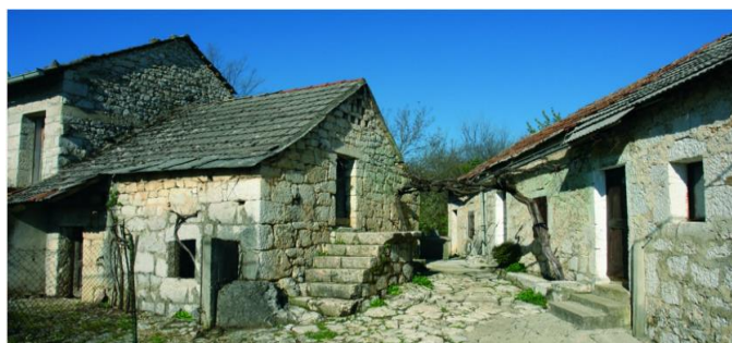
Slika 10. Primjer starih runovičkih kuća

Ono što veseli jest činjenica da su Runovićani prepoznali potencijal svoga kraja čineći ga tako posebnom atrakcijom među strancima, ali i domaćima koji žele dio svog vremena provesti odmarajući se u čistoj prirodi, uz domaću hranu i proizvode te tradicionalne i ambijentalne vrijednosti ovoga kraja. Boravak u starim kamenim kućama izazov je izletnicima, a turistički potencijal ovoga kraja dobra je prilika da se poboljšaju uvjeti kvalitete života i ono najvažnije, zaustavi odljev mladog stanovništva.