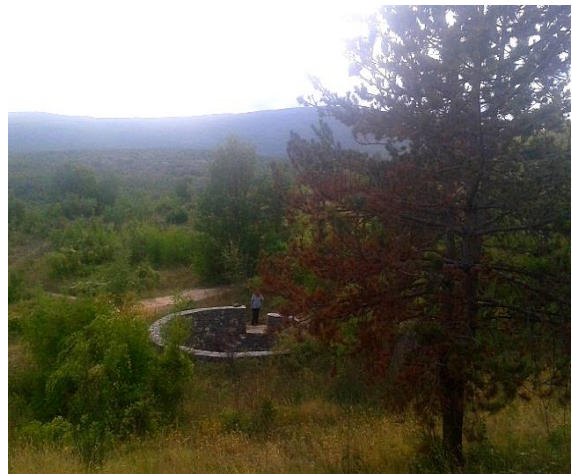
Slika 8. i Slika 9. Obnovljeni Radičevac na Umljanima