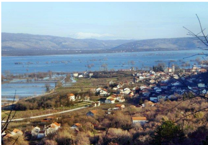
Slika 4. Poplavljeno polje i Otok u pozadini

U doba turskih nadiranja, na mjestu gdje je Majića podina u Tihaljini u susjednoj Bosni i Hercegovini, starosjedioci su znali zatrpati ponore da se voda zaustavi i da Turci manje prodiru u ove krajeve, pa se tako polje natopilo. Kad su ti stari umrli, zaboravilo se gdje su ponori i nije ih imao tko okopati i taj Otok je jedini virio iz polja, jer je bio uzvišen. Zbog toga su još u 18. stoljeću bili organizirani radovi na kopanju odvodnih kanala i čišćenje jaraka s ciljem širenja obrađenog zemljišta. Nakon 2. svjetskog rata, 1947. godine, završen je 1650 metara dug odvodni kanal kojim je spriječeno plavljenje polja. Unatoč odvodnom kanalu polje i danas nerijetko plavi, a to je uvjetovano sezonskom količinom oborina koje uzrokuju da vinogradi i ostala dobra ostaju pod vodom.