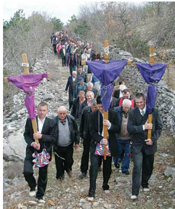
Slika 15. Procesija na Veliki petak

Sudjelovanje u procesiji izraz je čvrste i nepokolebljive vjere svakog Runovićana koji se kroz čitavu povijest ovoga kraja borio protiv raznih osvajača i režima na čije je zabrane odgovarao čvrstom i postojanom vjerom i ljubavlju prema domovini.