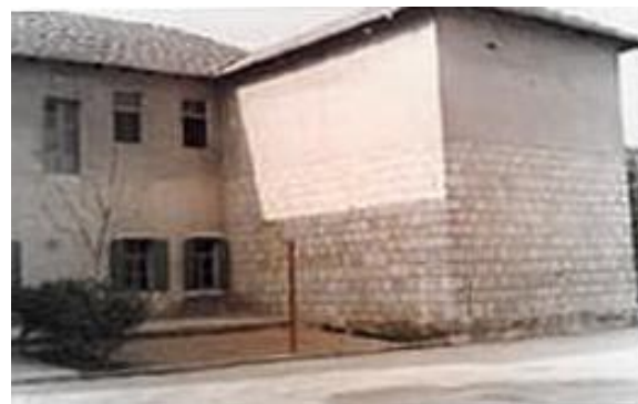
Slika 12. i Slika 13. Stara škola