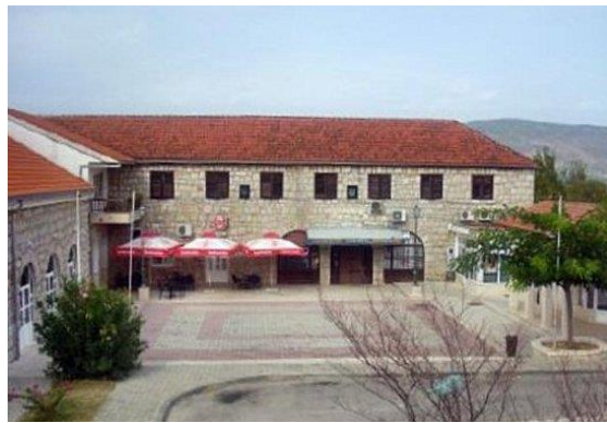
Slika 11. Dom kulture i trg fra Mije Runovića

Sredinom pedesetih godina runovička mladost je bila na okupu pod okriljem kulturno umjetničkog društva „Ivan Babić“ koja je poticala mlade da sudjeluju u dramskim i sportskim sekcijama (Bitanga 2001).