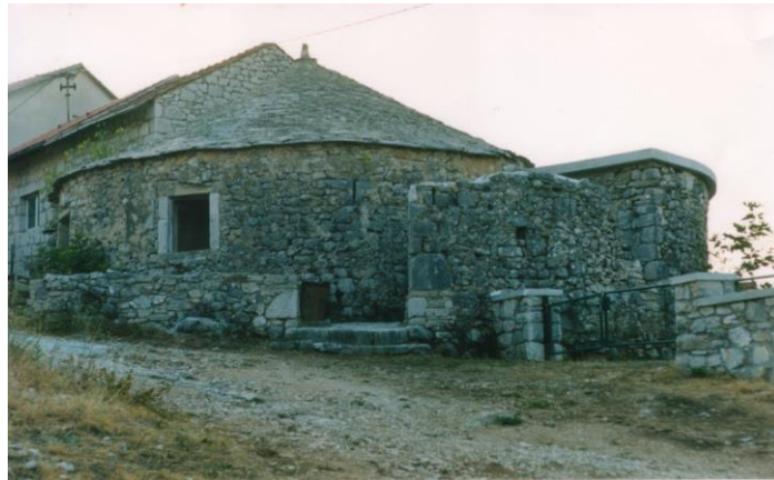
Slika 2. Majića kula na Sebišini