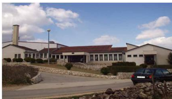
Slika 14. Nova škola na Kamenjima