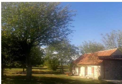
Slika 5. Primjer kućare u Otoku

Blage komande, zadovoljstvo, bogatstvo mlika, jaja, kruh se je redovito priprema ode u Kraju i onda bi se kruh i ovo, osnovne druge namirnice tamo pribacivale, a od tamo se pribacivalo mlijeko. Imali smo ponekad po sto pedeset ovaca i to nisu bile samo naše ovce. To su bile ovce koje su dotjerali ljudi preko ljeta, nije bilo vode gore s brda sa Sebišine, Podosoje, Slivno, samo da ostanu na životu, da imaju nekakvu pašu, da imaju vode jel. Tako da, tako da ovaj, tog mlijeka je bilo dosta, a ovaj, ja sam uglavnom bio okrenut prema krupnoj stoki. Konja, imali smo konje, volove, krave, a sestra, rodica i ove ženske su bile okrenute prema ovcama. Mi smo bili i tada u nekakvom, da tako kažem, povlaštenijem položaju. Ovca mala, ko će se s njome zanimat, to je bilo za žensku dicu, a ne za nas muškarce. 26