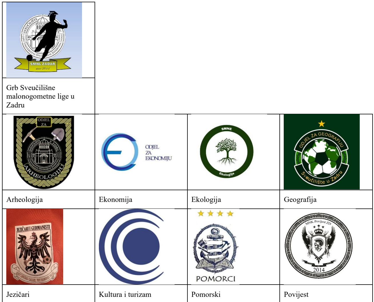
Slika 2. Grbovi SMNL-a i odjela koji su igrali Ligu 2023. godine.