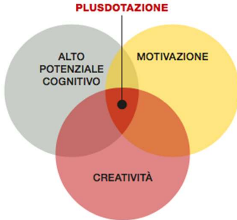
Immagine 1 – Il modello di J.S. Renzulli (URL2)