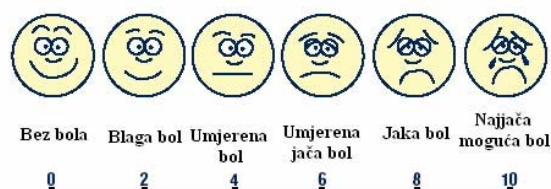
Skala za određivanje jačine bola

Bol se javlja kod gotovo svih operiranih pacijenata. Moramo imati na umu da je bol subjektivan osjećaj te da uvijek postoji ako se osoba žali na nju. Važno je da odredimo mjesto, karakter i jačinu boli, kada nastaje te što pomaže u suzbijanju boli. Jačinu boli ćemo procijeniti tako da pacijentu ponudimo skalu za bol. Uspješnost naših intervencija ćemo evaluirati tako što ćemo pacijentu nakon nekog vremena ponovno ponuditi skalu za bol i usporediti s prvotnom procjenom. Ako je bol nestala ili je umanjena tada su naše intervencije bile uspješne.