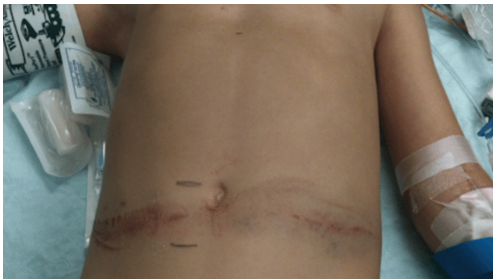
Slika 2. Znak sigurnosnog pojasa (eng. seat belt sign)

https://dontforgetthebubbles.com/seat-belt-injuries/