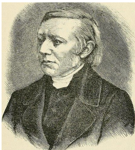
Slika 1. Pastor Theodor Flinder

Početak organiziranog sestrinstva veže se uz Vinka Paulskog koji govori o potrebi obrazovanja medicinskih sestara te osniva savjetodavno društvo „Dames de Charite“. U 18. stoljeću razvoj znanosti utječe na početak radno orijentirane njege bolesnika gdje liječnik organizira, propisuje i određuje, a sestra izvršava naloge liječnika. Početkom 19. stoljeća Elizabeth Fry osniva udruženje sestara milosrdnica koje njeguju bolesnike. Pastor Theodor Flinder (slika 1.) osniva školu za sestre Đakonise u Kaiserwerthu. Đakonise su bile sestre koje su osposobljene i obrazovane za njegu bolesnika te brigu o siromašnima. (2)