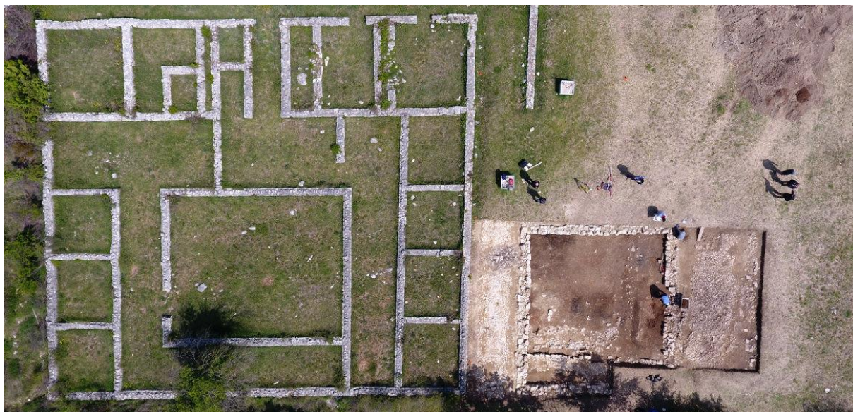
Slika 12 Rimski vojni logor Bigeste

Izvor: https://kravica.ba/wp-content/uploads/Rimski-logor-03.jpg , (16.8.2022)