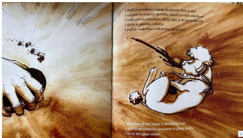
Slika 4. Tekst i ilustracija iz slikovnice Pudl (2020.)

Tekst i ilustracije su u svakoj slikovnici vrlo usklađene. Svaka ilustracija prati tekst (primjer Slika 3.), ali i da nema teksta preko ilustracije bi se poanta shvatila, što je rezultat kvalitetne slikovnice. Autori teksta su napisali vrlo jasno što su htjeli reći, pa i one slikovnice s narječjima i pisane u žargonu su jasne i razumljive čitatelju. Sadržaj u slikovnicama je neprimjeren djeci, ali nezačuđujuć obzirom da se radi o slikovnicama za odrasle. Sami podnaslov koji je otisnut na naslovnici svake slikovnice „slikovnica za odrasle“ jasan je signal da ovu knjigu ni po čemu ne bi trebalo ponuditi ili čitati – djeci (Slika 4.).