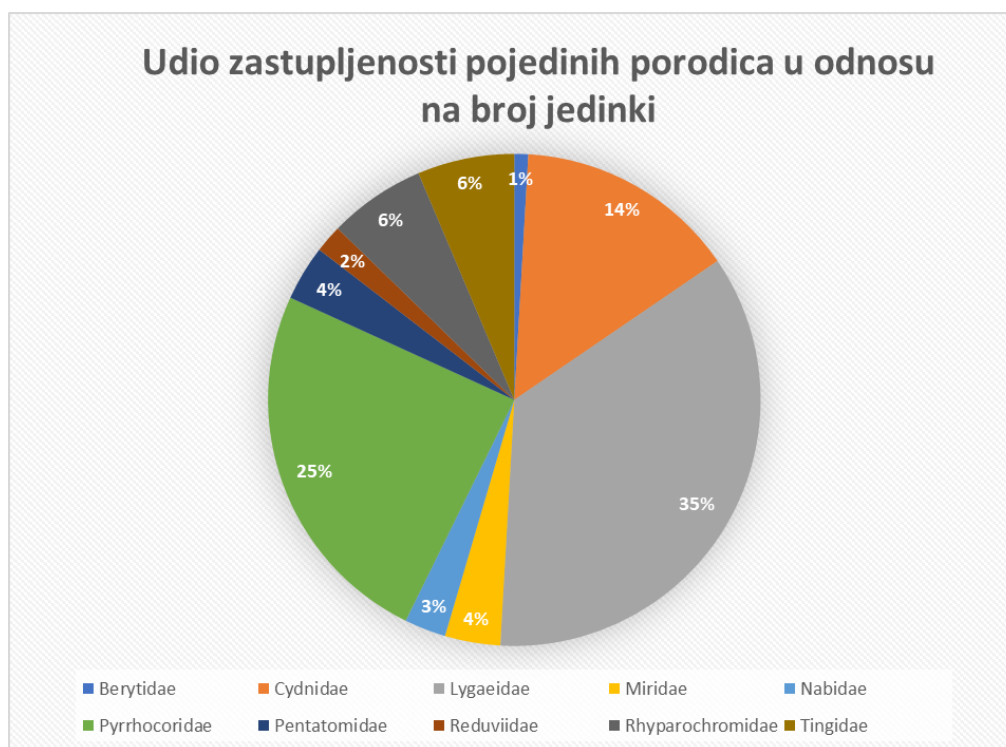
Graf 1. Postotni udio jedinki po porodicama

U grafu 1. prikaz je udjela zastupljenosti pronađenih porodica ovog istraživanja sakupljenih metodom lovni posuda i metodom otresanja. Najzastupljenija porodica je Lygaeidae s 35%, zatim slijede porodice Pyrrhoridae s 25%, Cydnidae 14%, Tingidae i Rhyarochromidae 6%, Pentatomidae i Miridae 4%, Nabidae 3%, Reduviidae 2%, a najmanje zastupljena porodica je Berytidae sa svega 1%.