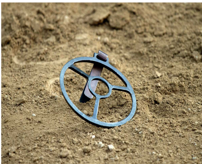
Foto. N. 3. L' anello di alca