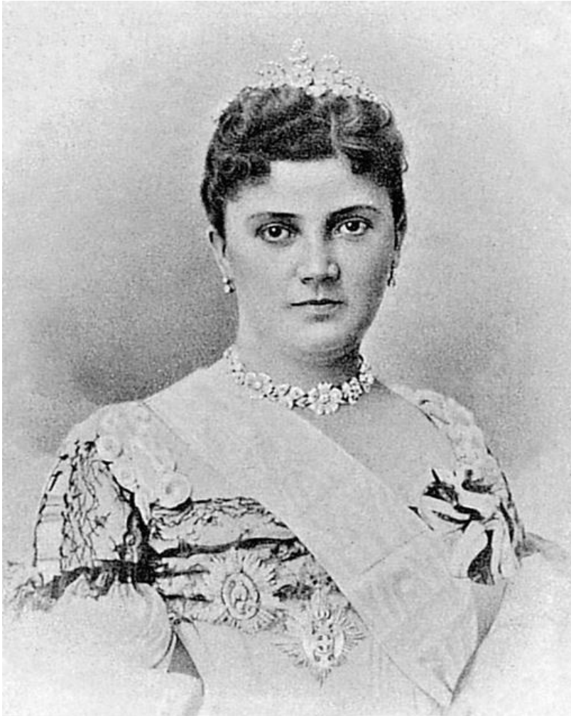
Slika 3. Kraljica Draga Obrenović.

kad je kralj Aleksandar odlučio za ženu uzeti Dragu Mašin, dvorsku damu svoje majke Natalije. Tom braku su se usprotivili mnogi, među ostalim i kralj Milan, pa je bio prisiljen napustiti Srbiju u koju se više nije vraćao do svoje smrti. 67