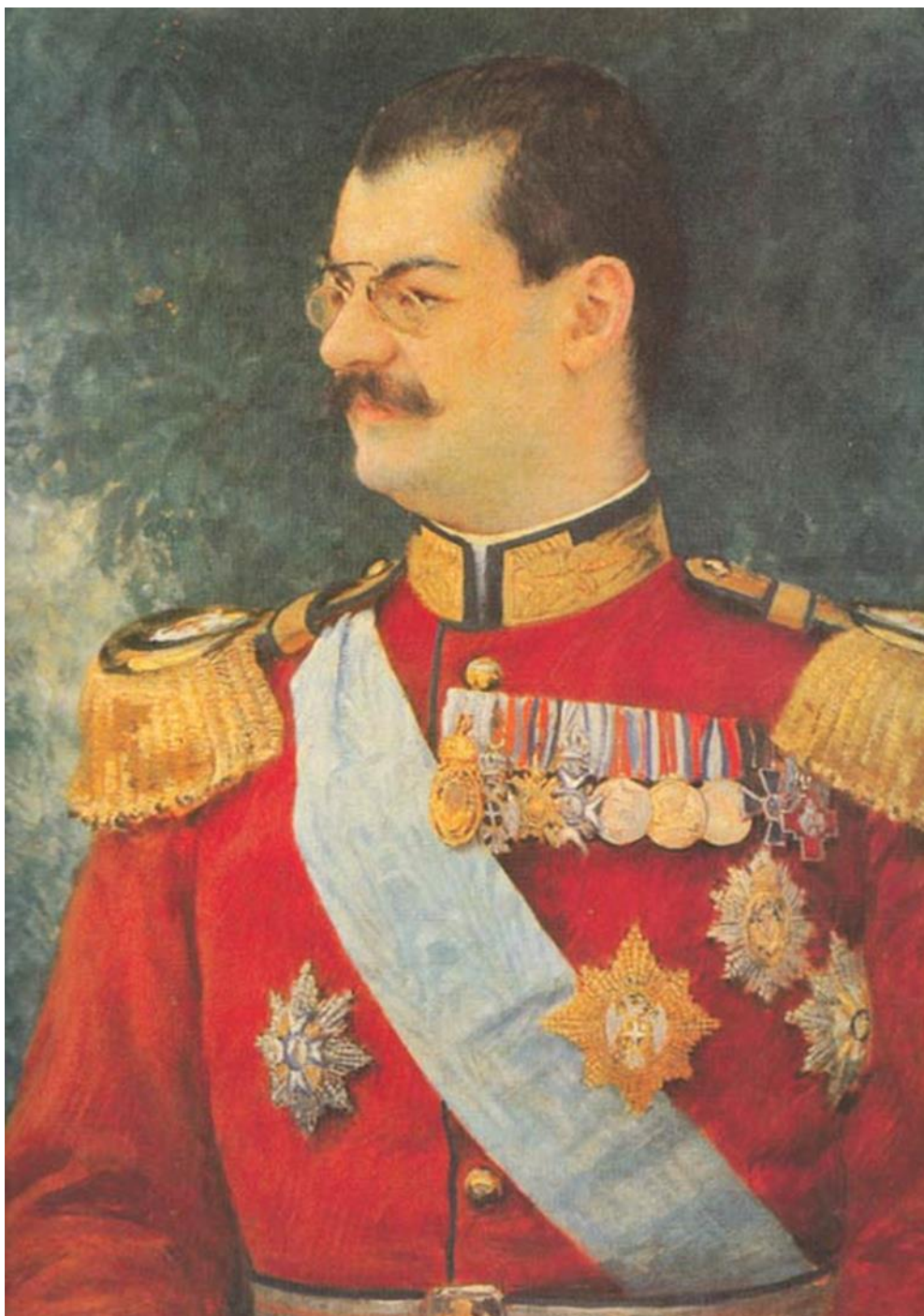
Slika 2. Kralj Aleksandar Obrenović. Portret je naslikao Vlaho Bukovac 1900. godine.