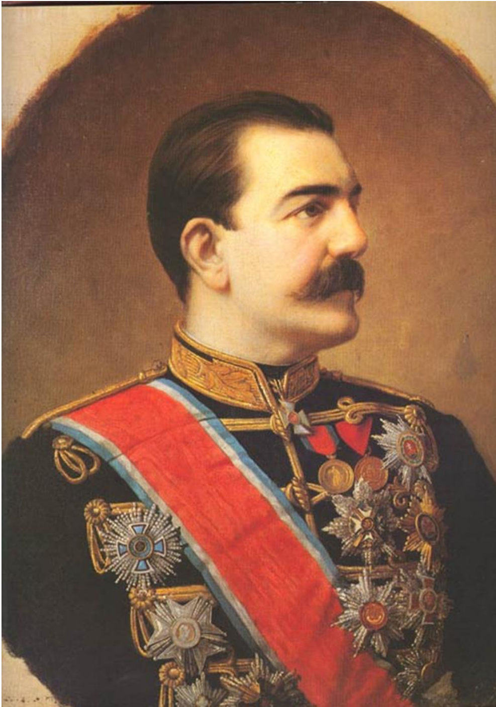
Slika 1. Portret Milana Obrenovića nastao oko 1881. godine.

Monarhiju. Radikali su smatrali da će Srbija postati kolonija dvojne Monarhije što će spriječiti nacionalno oslobođenje i ujedinjenje. 23