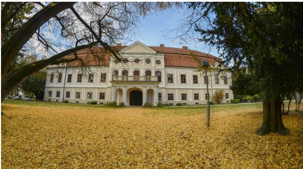
Slika 4: Dvorac grofa Antuna Jankovića

http://hotspots.net.hr/2016/02/upoznajmo-daruvar-grad-koji-voli-zivot/