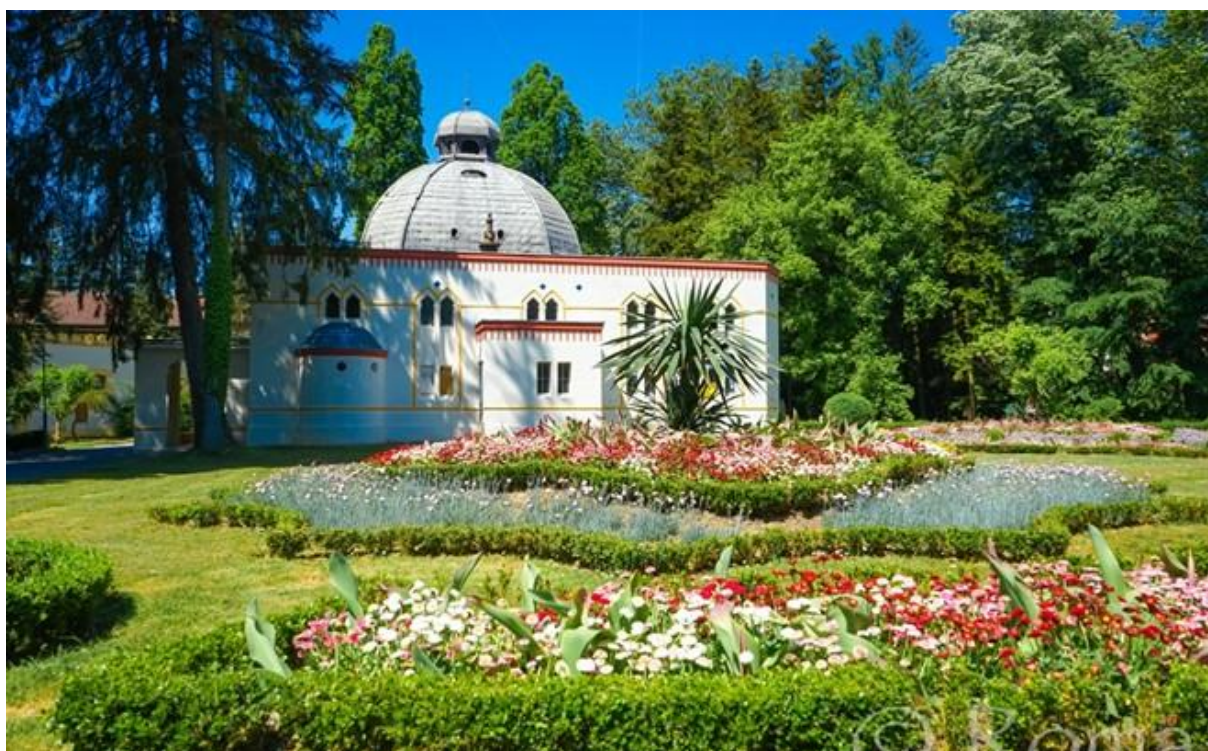
Slika 3: Centralno blatno kupalište

http://www.visitdaruvar.hr/ljecilisni-perivoj-julijev-park.aspx