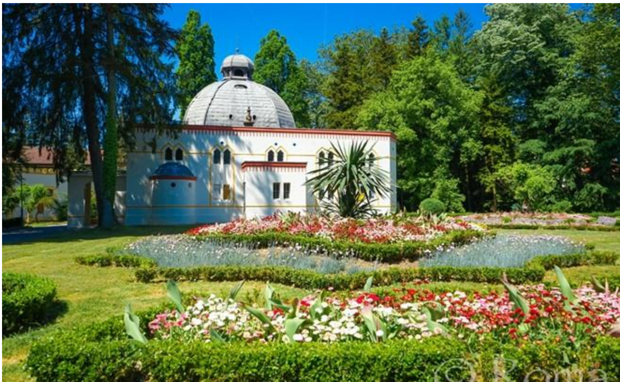
Slika 3: Centralno blatno kupalište

http://www.visitdaruvar.hr/ljecilisni-perivoj-julijev-park.aspx